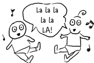
Penny a Regina – mimina