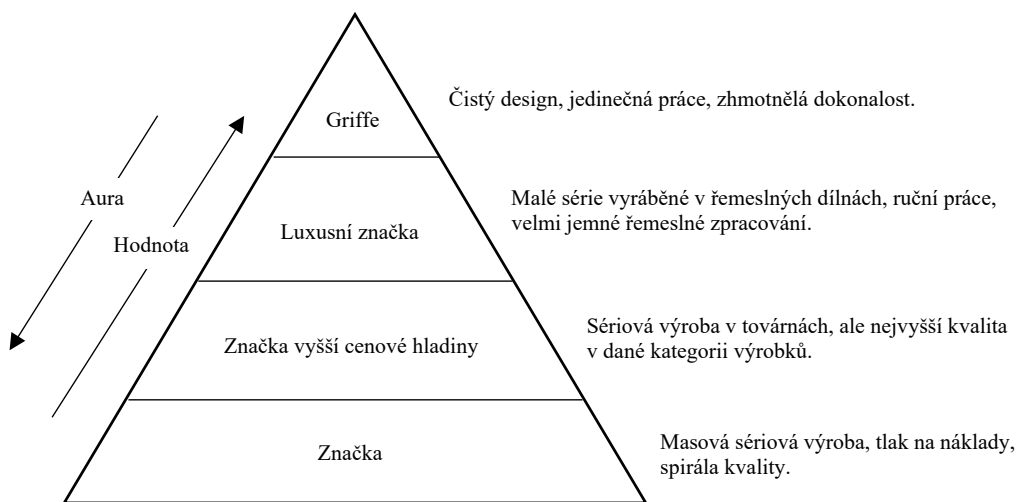
Schéma 1.1 Systematizace značek ve světě luxusu