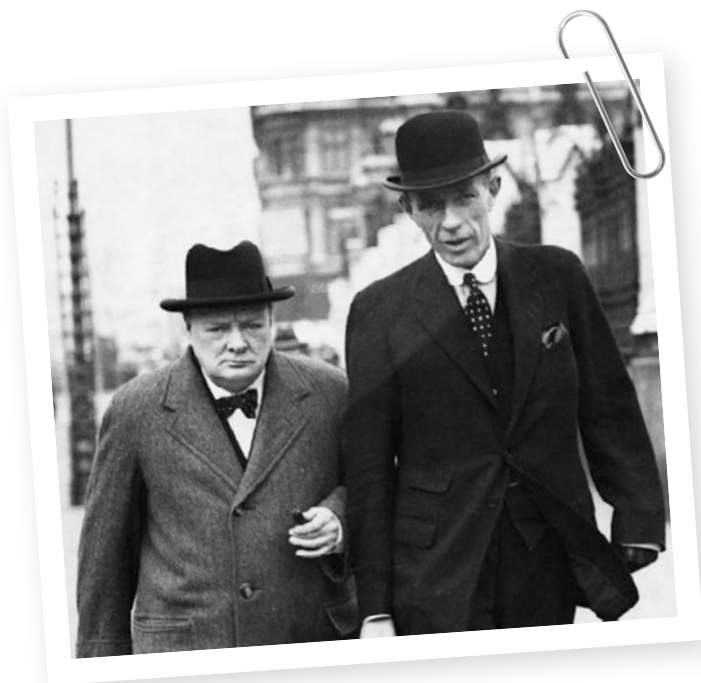
2. Churchill and Halifax

Halifax, jemuž někteří kvůli jeho politickému důvtipu a lstivosti přezdívají „Holy Fox“ (Svatá liška), je vysoce respektovanou personou britské politiky, jež zastávala řadu vysokých funkcí, včetně ministra války a místokrále Indie. Od počátku roku 1938 působí na postu ministra zahraničí, a přestože byl zapletený do Chamberlainovy politiky appeasementu , k mnichovské dohodě se stavěl rezervovaně a byl klíčovou postavou kabinetu při nátlaku na Chamberlaina, aby se neochvějně postavil na stranu Polska. Uhlazený a vzdělaný Halifax, vnímaný pro své aristokratické vystupování jako nositel „vysokých mravních zásad“, je štíhlý a velmi vysoký (196 cm), a je tak o hlavu vyšší než zavalitý Churchill, který měří jen 170 centimetrů. Ani zmrzačená ruka a ráčkování nebyly pro něj v dosavadním životě žádným hendikepem (viz Vyobrazení 2).