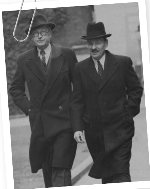
5. Greenwood a Attlee

Od 10. května, kdy Halifax složil přísahu a stal se premiérem, stále častěji uvažujete nad tím, jestli to skutečně byla ta nejlepší volba. Labouristická strana se zasloužila o odstranění nešťastného a politicky zdiskreditovaného Chamberlaina – jeho odchodem jste si podmínil svou ochotu sloužit v novém