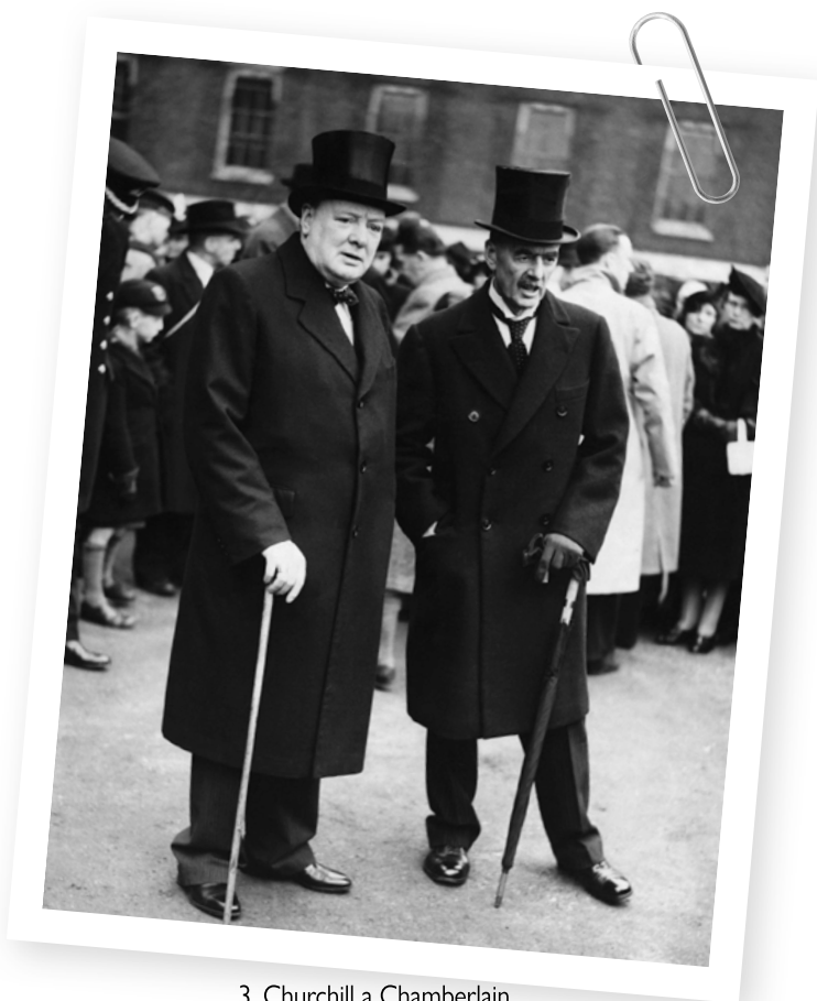
3. Churchill a Chamberlain

coby předsedu parlamentního klubu Konzervativní strany na schůzku do Downing Street, aby se rozhodlo o dalším postupu. Během předchozích čtyřadvaceti hodin jste Halifaxe ujišťoval, že má podporu vedení Konzervativní strany, vůdců opozice, samotného Chamberlaina, a dokonce i krále – stejně jako mnozí jiní samozřejmě předpokládá i král, že se Halifax, muž, jehož on sám i jeho žena jednoznačně preferují, ujme postu premiéra. Otázkou je samozřejmě Churchillův postoj: podpoří Halifaxe na post premiéra? Ten ale v této roli možná vidí sám sebe – což lze i navzdory vašim výhradám taktéž pokládat za dobré řešení. Možná ze všeho nejdůležitější je nyní Halifaxovo vlastní rozhodnutí převzít otěže moci.