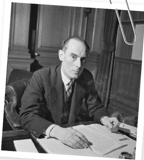
1. David Margesson, poslanec Dolní sněmovny

několika dní povedou k Chamberlainovu sesazení a nahrazení jeho vlády národní koalicí. S obligátním tvrdým límečkem a v oblečení, co už očividně dávno vyšlo z módy, působí Chamberlain jako muž, který stále více ztrácí kontakt s realitou. Jeho projev během rozpravy je naprosto nevýrazný a premiér dělá dojem „otřeseného muže“. Dilema, před nímž coby jeden z klíčových hráčů v parlamentu stojíte, však zní: Může se Chamberlain ve funkci premiéra udržet, a pakliže ne, kdo by ho mohl ve straně nahradit?