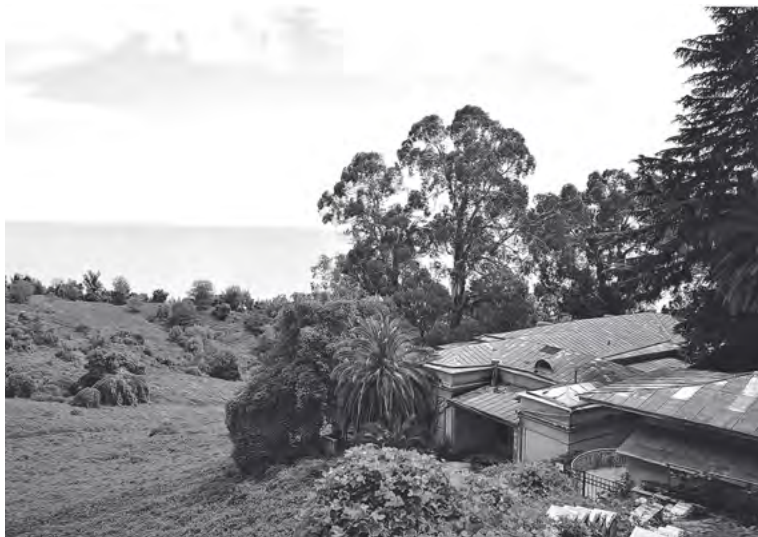
Pohled ze Stalinovy dači

mi hlásili moji známí, kteří se tam dostali pár let po mně, vstup do Stalinovy kuchyně je nadále zakázán – a dveře zabeďněné.