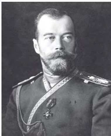
Mikuláš II. Romanov