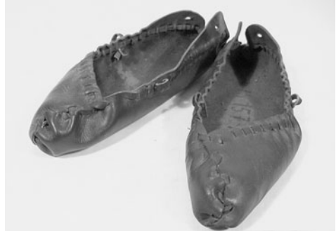
■ obrázek 4 Krpce s otevřenou patou a asymetrickým „nosem“ z Lopeníku na Moravských Kopicích.

Lýtka si u nižších typů obuvi lidé chránili hustým omotáním řemínků kolem nohy. Dá se říci, že tento způsob ochrany byl předchůdcem punčoch z vlněného materiálu, které jsou doloženy již od 12. století a pravděpodobně se na ně také vztahuje ruský výraz kopytce , známý od 11. století. Na Moravě a v Polsku se dosud používá pro vlněné ponožky, které se obouvají do krpců.