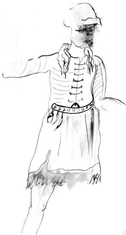
■ obrázek 1 Použití opasku u starých Slovanů. Podle L. Niederleho.

Z evropských oblastí za římskou hranicí, které tehdy obývaly tzv. barbarské národy, se nedochovaly žádné hmotné doklady ani zprávy o zpracování kůží, ačkoli tyto technologie museli obyvatelé barbarských území ovládat, protože zprávy Římanů o nich uvádějí, že se oblékali do chlupatých kůží divoké i krotké zvěře. Lidé v kulturně rozvinutých středomořských státech, kteří již dávno zhotovovali oděvy z tkaných látek, považovali takový způsob odívání za necivilizovaný. Lze předpokládat, že chladnější středoevropské klima nutilo obyvatele i nadále si zhotovovat oděv z kůže a kožešin, přestože i oni posléze poznali konopné, lněné nebo vlněné tkané látky.