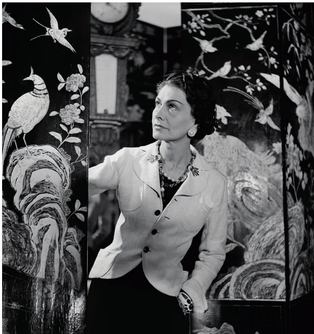
Chanel se svými lakovanými paravány, 1937.