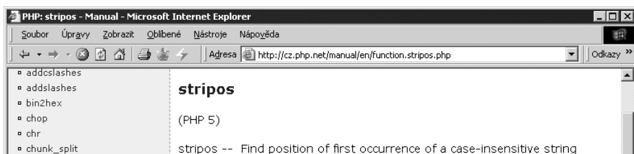
Obr. 1.1: Manuál k PHP – nápověda k jednotlivé funkci