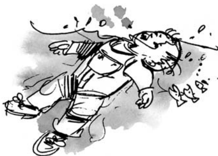
Rozvoj sebezáchranných dovedností – vznášení se v poloze na zádech

V zahraničí se této oblasti věnuje mnohem výraznější pozornost než u nás, např. v USA nebo Austrálii řada klubů zakládá svůj image výhradně na nácviku sebezáchranných dovedností již od kojeneckého věku (po pádu do vody přetočení do šikmé polohy na zádech a vznášení se). Tato oblast je určena opět převážně zdravým dětem.