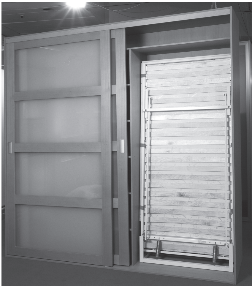
Obr. 2 Za posuvné dveře lze uschovat sklopnou postel nebo malou pracovnu

Před tím, než se pustíme do zařizování interiéru, musíme si uvědomit, jaké jsou naše požadavky na úložné prostory. Nezapomeňme, že další prostor nám zaberou sezónní potřeby nebo sportovní vybavení. Nenechme se zcela strhnout trendy, kde se minimalizuje umístění nábytku v interiéru – objem úložných prostor je zde přemístěný z obytné části zpravidla do vestavěných skříní a šatěn. V úvahu