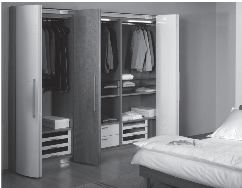
Obr. 3 Odstín vanilkové s třešňovou dýhou je elegantní kombinací

vždy berme velikost našeho bytu. Nevycházejme pouze z kvantitativní potřeby současnosti, vždy počítejme s tím, že některé věci přikoupíme a úložný prostor by měl mít rezervu.