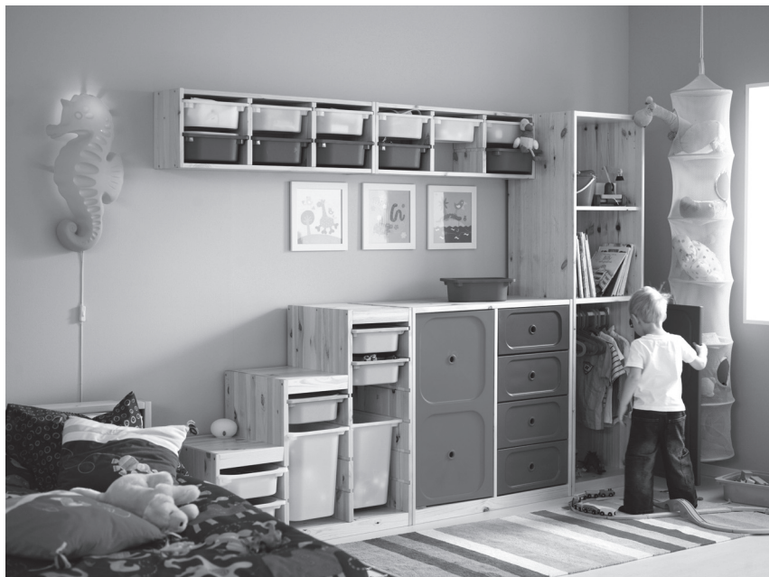
Obr. 8 Systematické uspořádání prostor v dětském pokoji učí dítě pořádku ve svých věcech