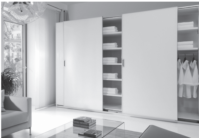
Obr. 6 Objem úložných prostor vždy plánujeme s rezervou

Trendem posledních let jsou podlouhlé formáty členění skříněk. Preferují se široké obdélníkové kontejnery a výklopné skříně. Tento trend je viditelný na komodách, televizních stolcích i velkých skříních. Často se můžeme setkat s členěním vestavných skříní do podlouhlých formátů, mnohdy se jedná pouze o pohledové členění, které se samostatně neotevívá.