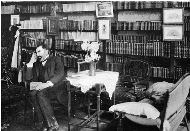
Zeyer doma. Přemýšlí o Paříži?