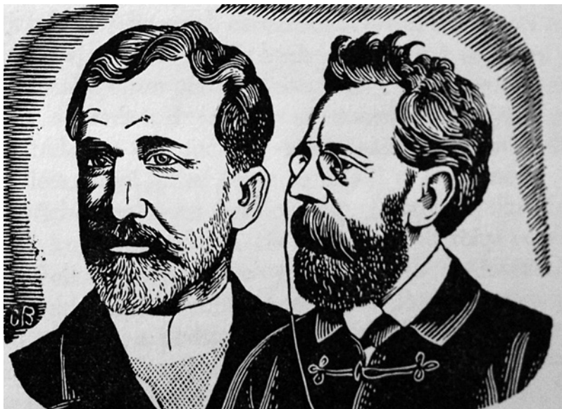
Julius Zeyer a František Herites.

vodu nevěřil. Podobně nevlídně až nepřátelsky se Zeyer choval i k Jaroslavu Vrchlickému, tady mu, odhaduji, Zeyer záviděl větší divadelní a literární úspěch.