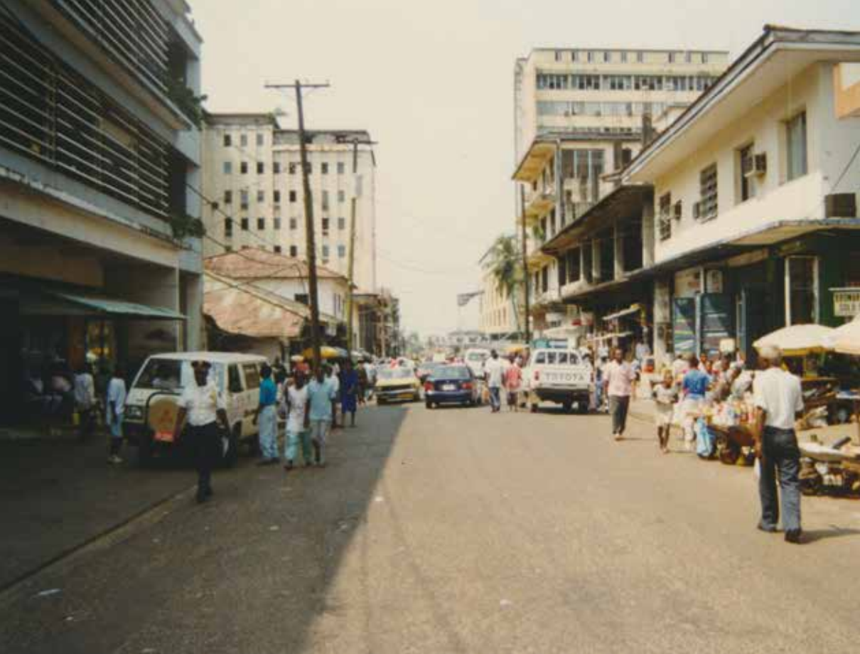
Centrum hlavního města Monrovie.

v Banjulu rozhodl vyslat do Libérie mírové jednotky. V září 1993 byla vyslána do Libérie Pozorovatelská mise OSN (UNOMIL), která měla spolu se Zápa-doafriickým mírovým sborem ECOMOG dohlížet na příměří a přípravu voleb.