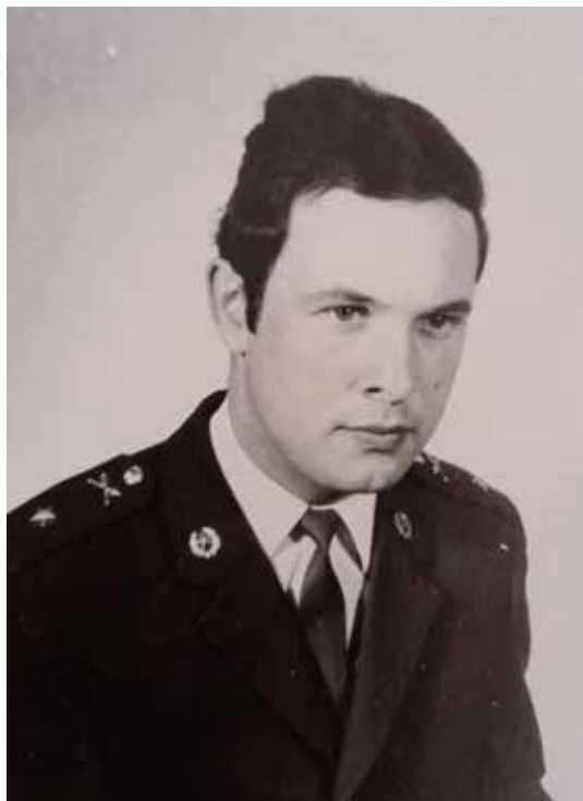
V první důstojnické hodnosti v roce 1973.

Po ukončení základního vzdělání jsem absolvoval střední všeobecně vzdělávací školu, dnešní gymnázium, následně jsem úspěšně dokončil nástavbové studium – abiturientský dvouletý kurz na střední ekonomické škole. Poté se