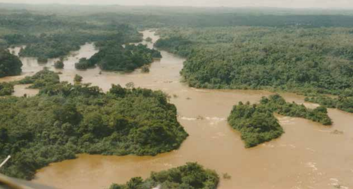
Řeka Svatého Pavla v období dešťů.

Území Libérie vyplňuje asi ze 40 % plochá až mírně zvlněná pobřežní nížina, která podél řek zasahuje hluboko do vnitrozemí, kde přechází ve zvlněnou náhorní plošinu zabírající převážně střední a východní část země. Od oceánu odděluje vlastní nížinu poměrně ploché a málo členité pobřeží, severní výběžky země vyplňuje výrazně zvlněná Guinejská vysočina zvedající se z náhorní vysočiny do výšek přes 1300 m (nejvyšší vrchol Mount Wutibih 1381 m n. m.). Říční síť Libérie je hustá, vodní toky jsou krátké, bystré a vodnaté, kvůli četným vodopádům a peřejím jsou ale splavné pouze na malých úsecích. Nejdelší je s 540 km řeka Cavalla na hranici s Pobřežím slonoviny, která je však splavná jen na 80 km úseku. Vedle nesčetných krás však řeky v sobě skrývají i nebezpečí v podobě tropických parazitních červů způsobujících bilhariózu. Větší jezera a umělé vodní plochy se v Libérii nevyskytují.