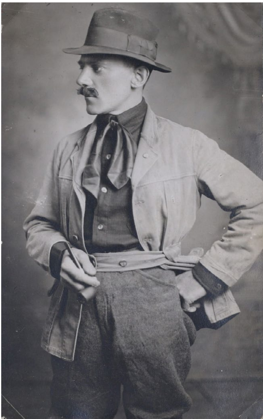
Portrét J. L. Erbena, USA, kolem roku 1920