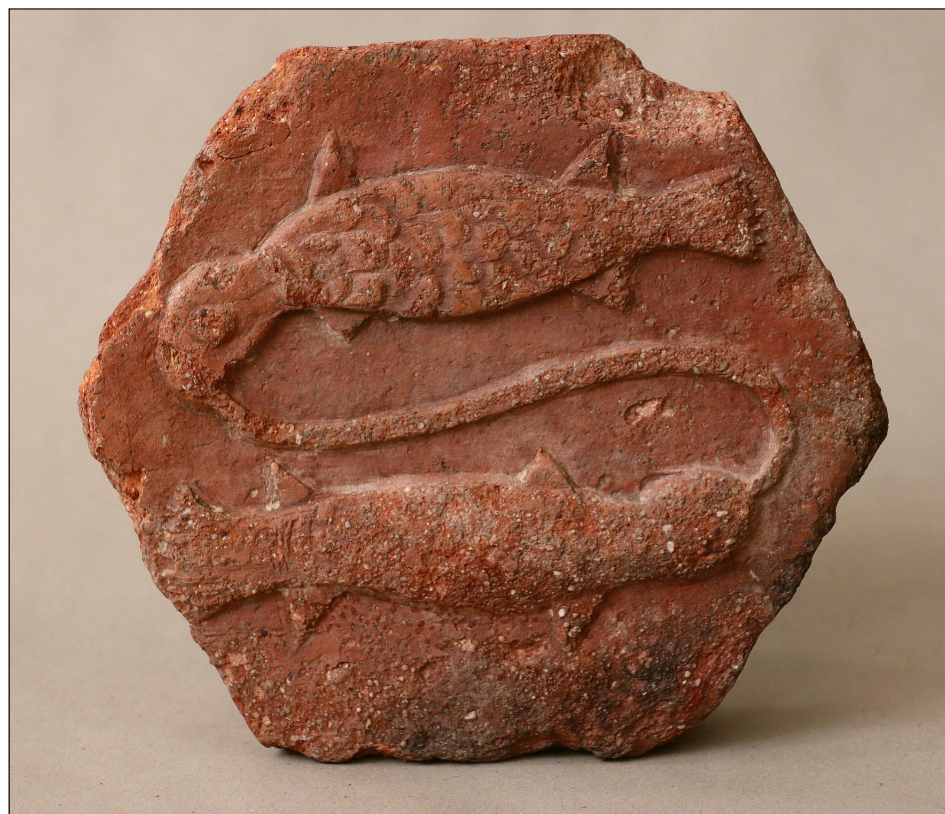
Obr. 3. Litoměřice. Románská šestiboká nepolévaná dlaždice je na svrchní straně zdobena reliéfem dvou ryb, umístěných horizontálně nad sebou a spojených vláknem. Národní muzeum, H2-35 547.

Fig. 3. Litoměřice. Romanesque hexagonal unglazed tile, decorated on the upper side with a relief of two fish, placed horizontally above each other and connected by a thread. National Museum, H2-35 547.