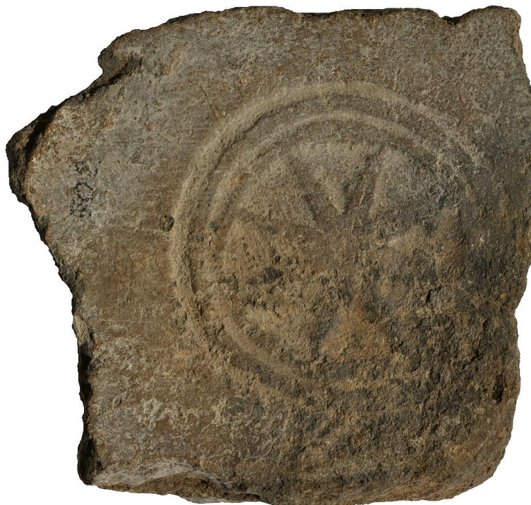
Obr. 1. Benešov u Prahy - klášter minoritů na Karlově. Gotická nepolévaná dlaždice zdobená kolkem v podobě osmicípé hvězdy. Muzeum Podblanicka, I.č. 106 112.

Umělecky asi nejméně náročné dlaždice z našeho území jsou zdobeny jednoduchou rytou výzdobou, která je již na hranici zvládnuté řemeslné výroby. Setkáváme se s nimi však zřídka, jedním z dokladů může být dlaždice z kláštera v Sázavě (Nechvátal 1982, 247).