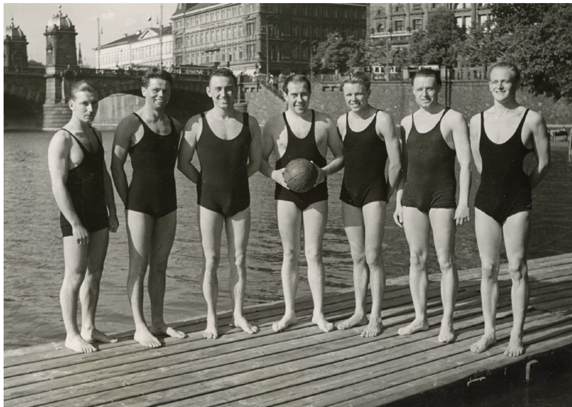
Družstvo Českého plaveckého klubu Praha ve vodním pólu na plovárně na Žofině v roce 1939. Fotoarchiv Oddělení dějin tělesné výchovy a sportu NM (ODTVS), H7F 058034a

sloužila mola lemuující takřka celý břeh.