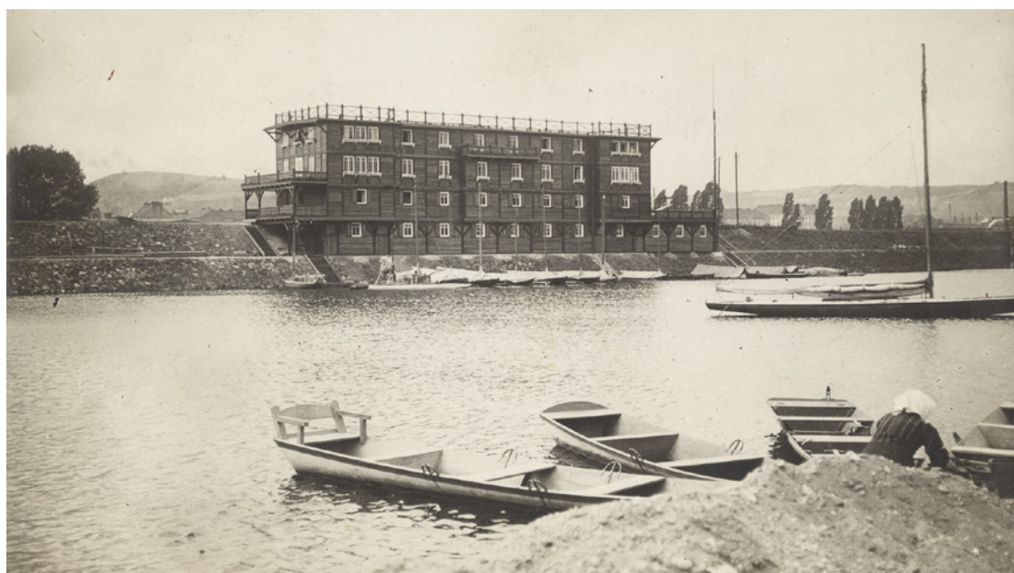
Klubovna Českého Yacht klubu krátce po svém dokončení v roce 1912. V této době vzbuzovala značné vášně, kritizován byl zejména fakt, že je příliš mohutná a naruší pražskou scenérii. Fotoarchiv Oddělení dějin tělesné výchovy a sportu NM (ODTVS), H7F 039118