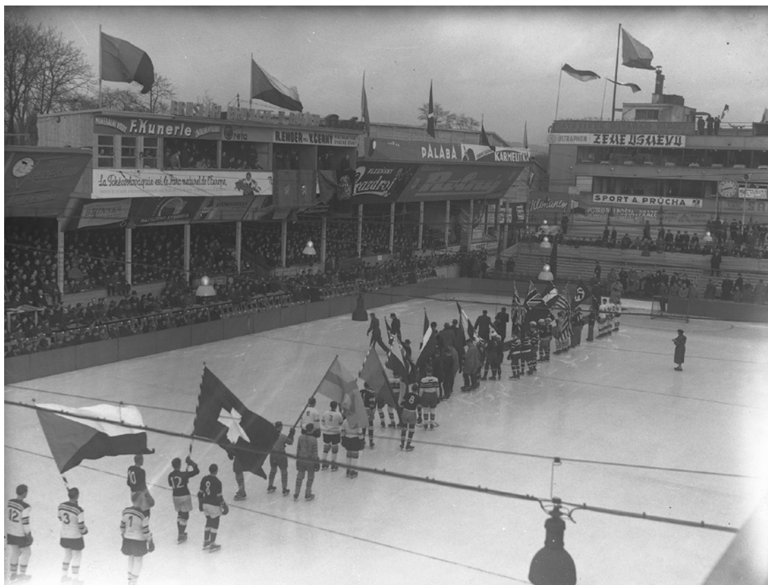
Zimní stadion na Štvanici měl kapacitu 10 tisíc diváků, a byl tedy vhodný i pro soutěže evropského a světového formátu. Snímek zachycující Mistrovství světa v hokeji v roce 1938.

v 16. století. 28 Jednalo se o souboje dvojic na člunech – zatímco jeden vesloval (případně odpichoval bidlem), druhý se kopím snažil srazit protivníka do vody.