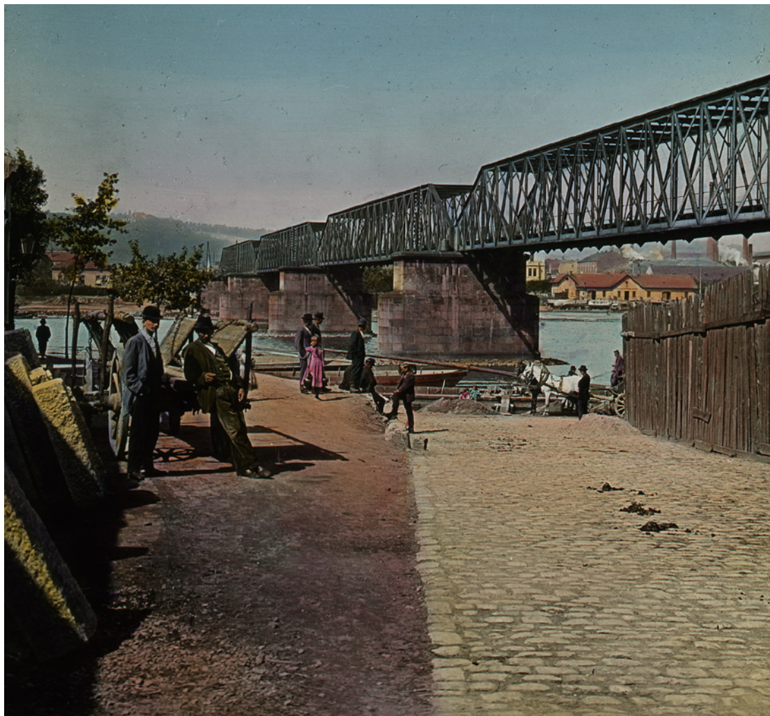
Před vybudováním náplavek ve druhé polovině 19. století byl přístup k řece značně omezený, jak vidíme na skleněném diapositivu, pořízeném před rokem 1901. Fotoarchiv Oddělení dějin tělesné výchovy a sportu NM (ODTVS), PS-1472

Vltava také byla a dodnes je důležitým aspektem v kultuře volného času a utužování těla. Rozvoj této funkce je spojen především s industrializací v 19. století, s ní související proměnou konceptu volného času a kompenzací tělesné námahy, jež z mnoha odvětví v důsledku technologického pokroku vymizela. Z činnosti, kterou do té doby vykonávala prakticky jen šlechta, se stal sport masovou zábavou. Bylo přirozené, že se před vznikem velkých sportovišť obracela pozornost Pražanů k řece, nabízející bohatou škálu pohybového vyžití.