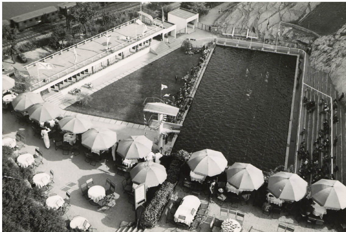
Fotka z Mistrovství Československa v plavání ve dnech 2.–4. srpna 1935. Praha si po otevření bazénu na Barrandově, který již plně vyhovoval světovým závodním standardům, mohla dovolit hostit nejen domácí, ale i světové soutěže. Fotoarchiv Oddělení dějin tělesné výchovy a sportu NM (ODTVS), H7F 058054a

1923 využívat bazén na Klárově. Další větší, obdélníkové nádrže vznikly na přelomu dvacátých a třicátých let v paláci YMCA a v hotelu AXA, obě instituce se nacházejí v ulici Na Poříčí. Až v roce 1927 byl otevřen první 25metrový krytý bazén v českých zemích, a to v Praze v Klimentské ulici. Přestože se zde konaly závody včetně Mistrovství ČSR v plavání roku 1928, po pouhých deseti letech od svého vzniku byl bazén opět uzavřen.