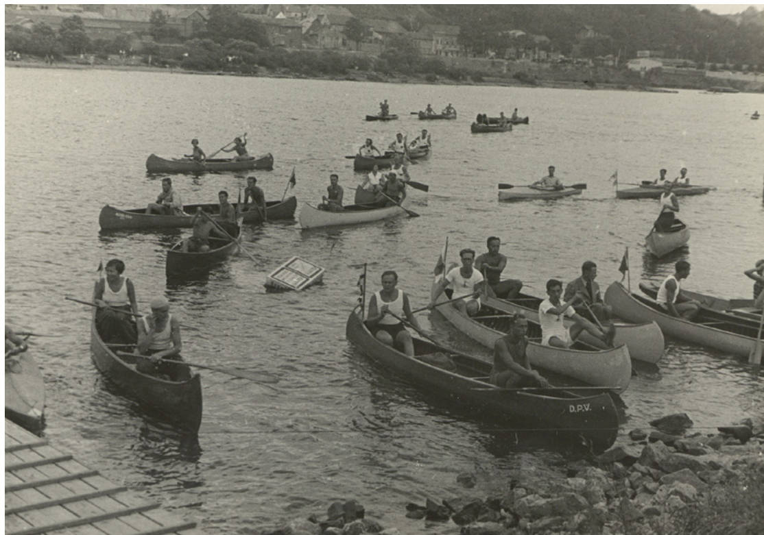
Účastníci prvního Mistrovství Evropy v kanoistice v roce 1933 v Praze jsou vítáni na Zbraslavi, kde startoval závod na 10 km. H7F 058124

Největší zástupy přitahovala zejména oblast na jih od Prahy, s krajinou plnou romantických skal, zátočin a ostrovů. Mezi válkami šlo o obzvlášť oblíbenou destinaci mezi tzv. divokými skauty, jak se tehdy říkalo trampům. 48 Jedno místo svou popularitou přeci jen předčilo ostatní: Svatojánské proudy. Výpravy do tohoto malebného zákoutí za Prahou jsou fenoménem, trvajícím bezmála tři čtvrtiny století.