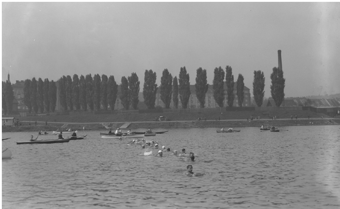
Od Vyšehradské plovárny, přezdívané podle jejího majitele Mejlíkárna, startoval tradičně závod Napříč Prahou. Snímek z počátku třicátých let.

Majetnější klientele sloužila plovárna Florida, kotvící původně u tenisových hřišť pod Barrandovem. Šlo o konstrukci upravenou ze dvou pontonových lodí, spojených můstkem se vstupem do vody. Na jedné se nacházely společenské prostory a restaurace, na druhé kabinky a šatny. Roku 1938 byla Florida přestěhována k výstavní síni Mánes, odkud byla na zimu přesouvána do přístavu na Smíchově. O devět let později se však potopila. 14