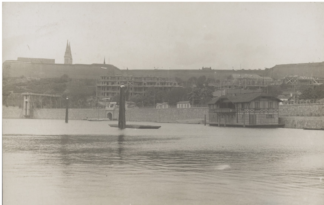
Hausbót, sloužící jako klubovna Českého Yacht klubu před otevřením velké klubovny v roce 1912. Fotoarchiv Oddělení dějin tělesné výchovy a sportu NM (ODTVS), H7F 039119