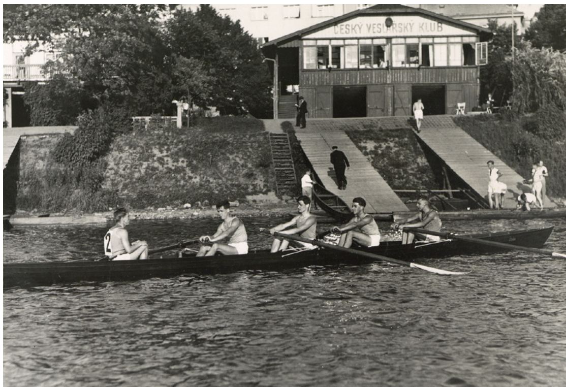
Vítězná čtyřka s kormidelníkem začátečníků VK Blesk po vítězném závodě na Rennerově memoriálu 23. června 1934. V pozadí klubovna Českého veslařského klubu, který událost pořádal (a dodnes pořádá) na počest svého zakladatele Josefa Rennera od roku 1919. H7F 058141a

ný klubovní dům a loděnici otevřel také VK Slavia. V historii klubu byl již čtvrtý. Po svém založení v roce 1885 sídlila Slavia v malém hrázděném pavilonu na smíchovském břehu pod Palackého mostem. Po pouhých třech letech přesídlila do plovoucí loděnice u Slovanského ostrova, aby nakonec zázemí i těžké gigové lodě přesunula na pronajatý pozemek na Střeleckém ostrově. Závodní lodě byly mezitím uskladněny u smíchovského břehu.