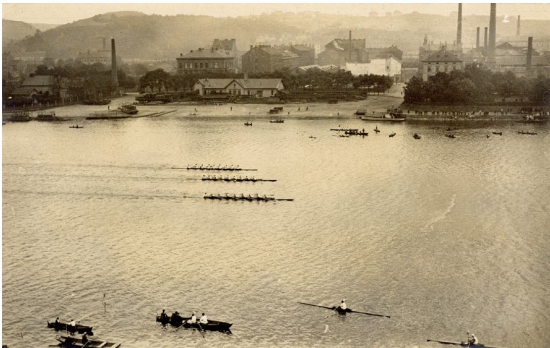
Závody primátorských osmiveslic v roce 1920. Již následujícího roku byl omezen počet startujících lodí, neboť v platnost vešlo pravidlo, že se z každého klubu smí účastnit pouze jedna. H7F 040754

obsahuje zatáčku, na kterou nejsou zvyklé. Od roku 1933 je součástí Primátorek i nejstarší český veslařský závod, založený roku 1895: Jarní skulérský závod, po svém zakladateli přejmenovaný na Jarní skulérský závod Josefa Rösslera-Ořovského. 36