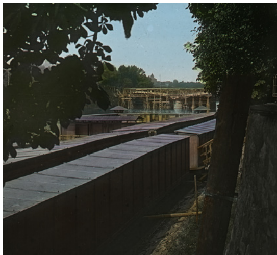
Plovárna Slovanka na Žofíně, asi kolem roku 1900. Fotoarchiv Oddělení dějin tělesné výchovy a sportu NM (ODTVS), PS-0949 a PS-0950

v Česku do současnosti nezachovala ani jediná z nich. Představu o jejich podobě si tak můžeme udělat pouze z dobových fotografií a vyprávění pamětníků.