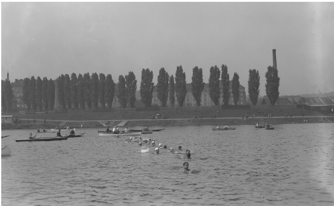
Od Vyšehradské plovárny, přezdívané podle jejího majitele Mejlíkárna, startoval tradičně závod Napříč Prahou. Snímek z počátku třicátých let.

Majetnější klientele sloužila plovárna Florida, kotvící původně u tenisových hřišť pod Barrandovem. Šlo o konstrukci upravenou ze dvou pontonových lodí, spojených můstkem se vstupem do vody. Na jedné se nacházely společenské prostory a restaurace, na druhé kabinky a šatny. Roku 1938 byla Florida přestěhována k výstavní síni Mánes, odkud byla na zimu přesouvána do přístavu na Smíchově. O devět let později se však potopila. 14