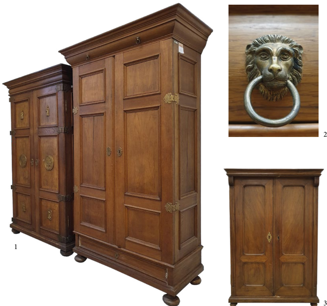
Obr. 1: Tzv. velké skříně I (vlevo) a II (vpravo) původně umístěné v bytu Karla Chaury

Fig. 1: So-called big cabinets I (left) and II (right) originally located in Karel Chaura's apartment