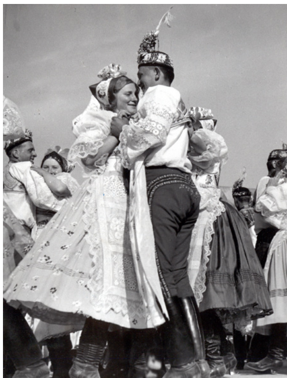
Dvojice tanečníků v podlužáckých krojích o hodech v Lanžhotě. Foto Ferdinand Bučina, nedat. Dokumentační fond Ústavu evropské etnologie Filozofické fakulty Masarykovy univerzity, inv. č. 667.

Tradiční oděv je jedním z určujících znaků pro stanovení národopisného regionu a jeho hranic. Oděv převážně venkovského obyvatelstva na Moravě a ve Slezsku vykazoval mimořádnou rozrůzněnost. Ta byla dána geografickými podmínkami, ekonomickou prosperitou jednotlivých krajů, etnickým složením i vlivem blízkých měst. Na velké části území se původní podoba oděvu udržela až do poloviny 19. století. Teprve zásadní společenské změny, jako zrušení poddanství, které umožnilo volný pohyb obyvatelstva, a pokračující průmyslová revoluce, jež si vynutila příchod nových pracovních sil z venkova do měst, přiměly nejprve muže k odložení tradičního oblečení a jeho výměně za praktickou a stále dostupnější konfekci. Ženy, které neopustily původní prostředí, v němž pečovaly o domácnost a hospodářství, zůstaly nadlouho nositelkami tradice včetně oděvních zvyklostí, předávaných z generace na generaci. Nebylo nic neobvyklého, když nejstarší ženy v obcích na Moravském Slovensku nebo Valašsku a Těšínsku oblékaly tradiční komplet ještě na přelomu tisíciletí.