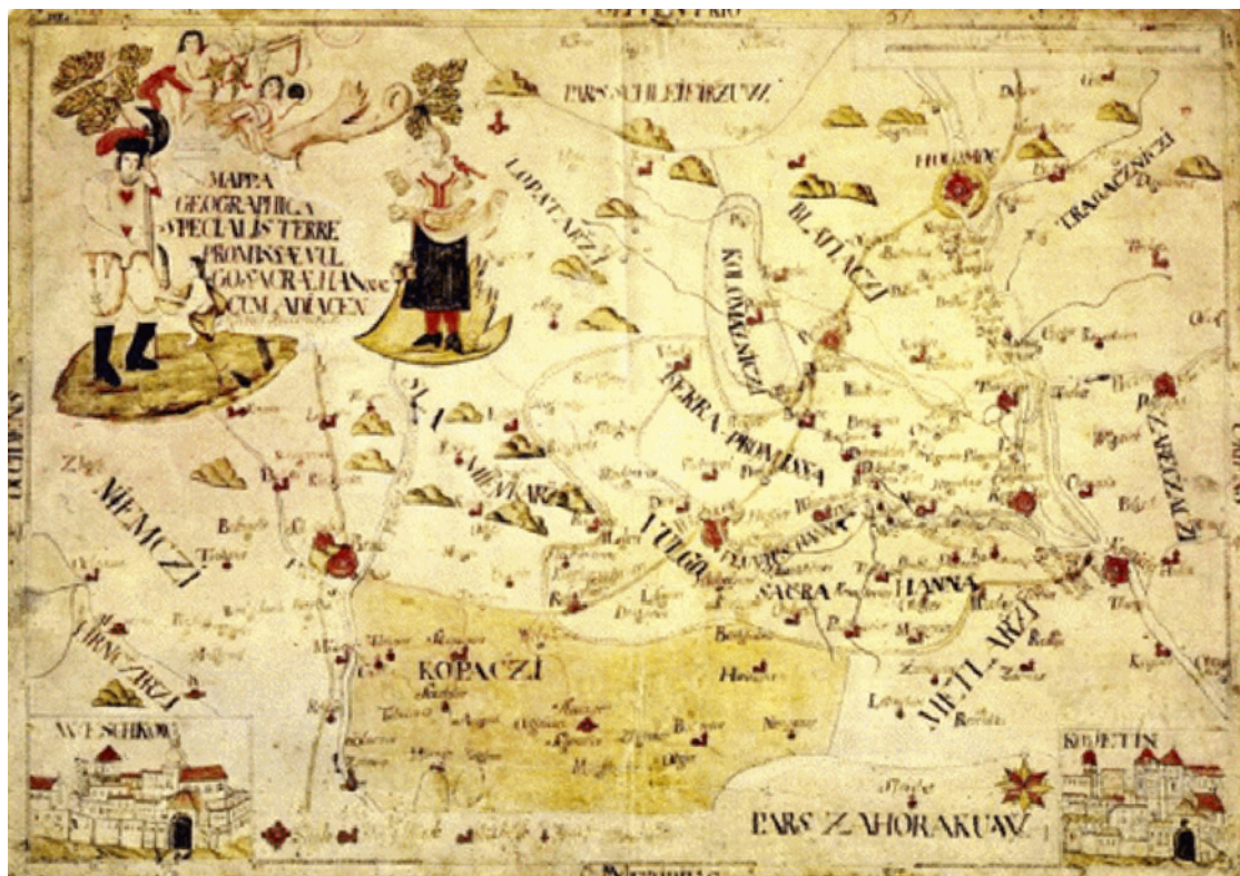
Mapa Hané od anonymního autora z doby kolem 1800. Parerga zachycuje Hanáka v ocáskovém kožichu a Hanačku v typickém regionálním oděvu s rouškou na hlavě. Muzeum Komenského v Přerově, p. o.

(především svrchní oděv, kabáty, kožichy apod.) a doplňků (boty, čepce, šátky). Také některá zaměstnání si vynutila specifické oděvní součásti, např. kovář potřeboval koženou zástěru, vinaři nosili modrou zástěru apod.