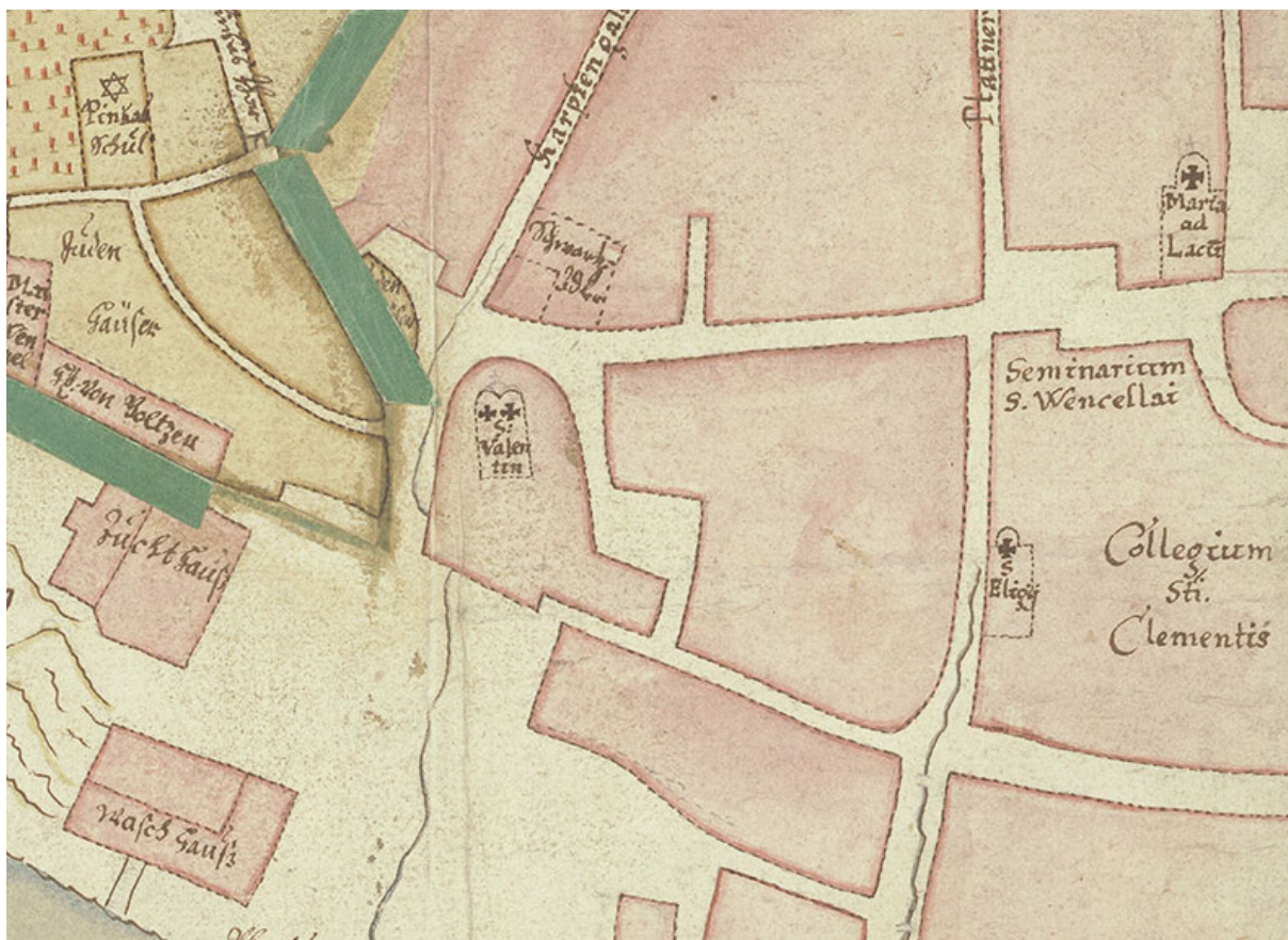
Půdorys kostela sv. Eligia na situačním plánu Židovského města Samuela Globice z Bučina z období kolem roku 1650.

zajišťovaly doprovod bohoslužby – zvoníkoví, žákům, literátům a v roce 1587 dokonce pozouně- rům. Díky dochovaným oficiím si i dnes můžeme představit, jak oslavy probíhaly a co se během nich zpívalo. 47