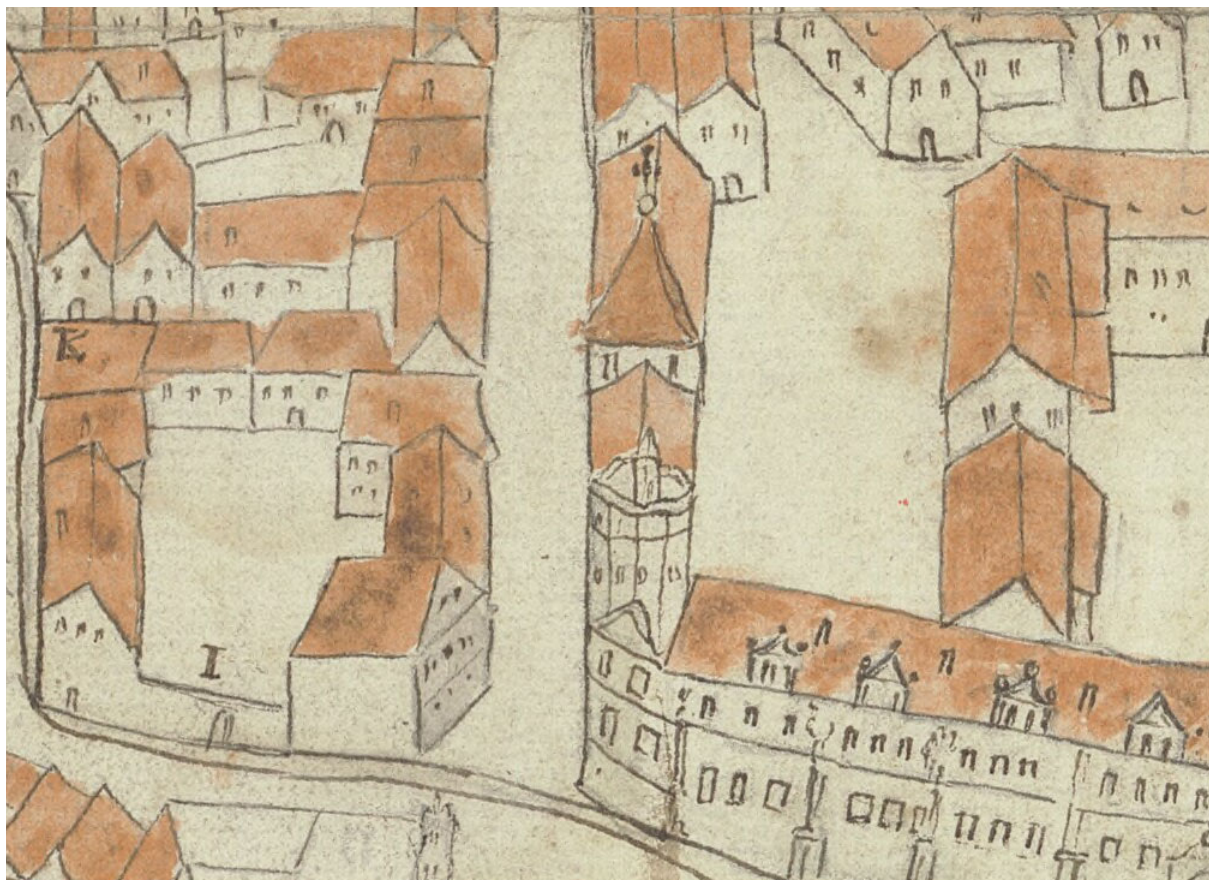
Kostel sv. Eligia na perspektivním plánu Samuela Globice z Bučina (tzv. Křižovnický plán) z období kolem roku 1650.

listiny, získala tato tradice právní základ. Když se v roce 1619 dovolávali zlatníci u direktoria svých někdejších práv na kostel sv. Eligia, přiložili ke své žádosti opis právě těchto artikulí. 44