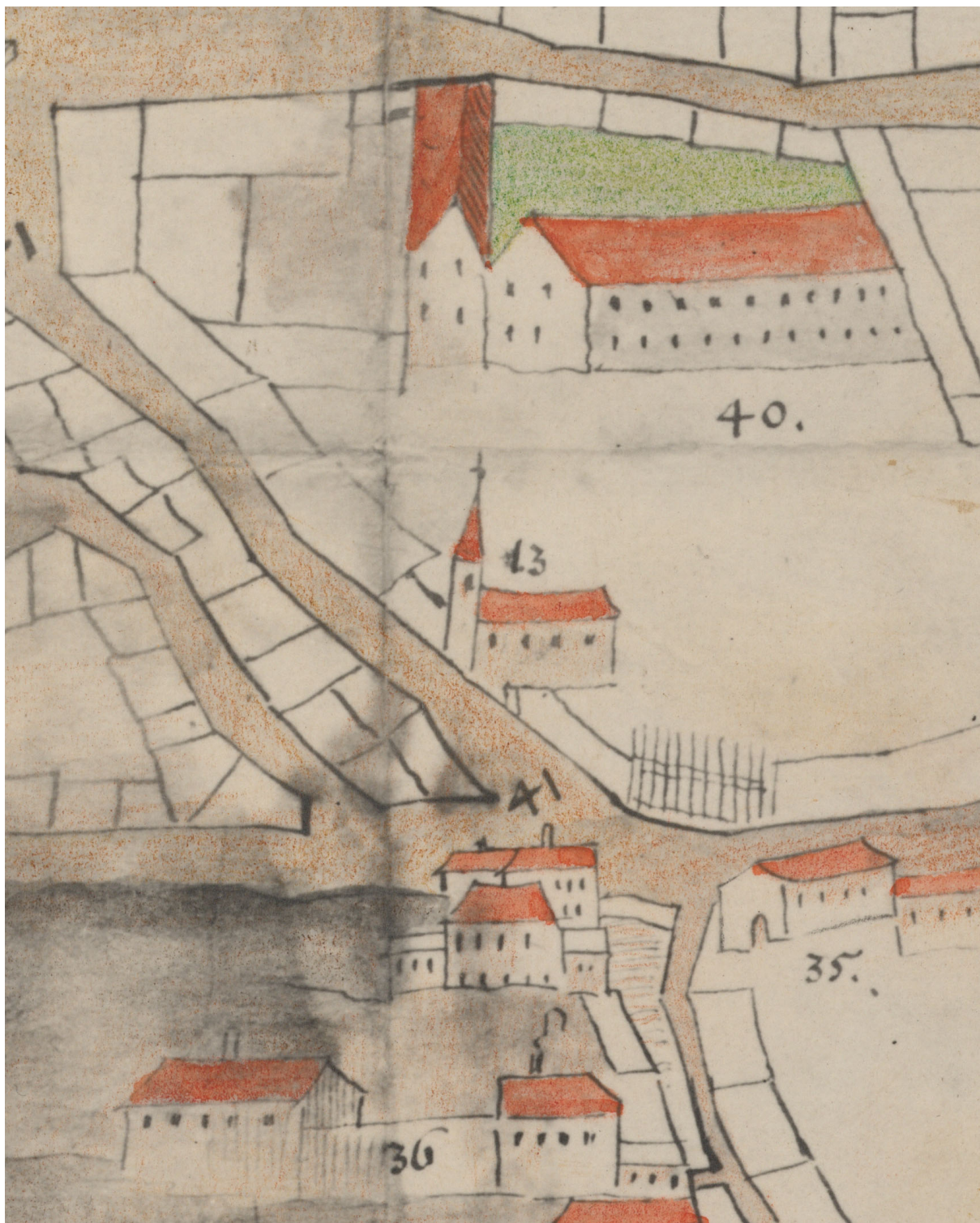
Kostel sv. Elgia na schematickém plánu Starého Města pražského a Židovského města z období mezi lety 1638–1649. Z technických důvodů je zde reprodukována kopie plánu uložená v Archivu hlavního města Prahy, originál se nachází v Národním archivu. AHMP, Sběrka map a plánů, sign. MAP P 1 A/2