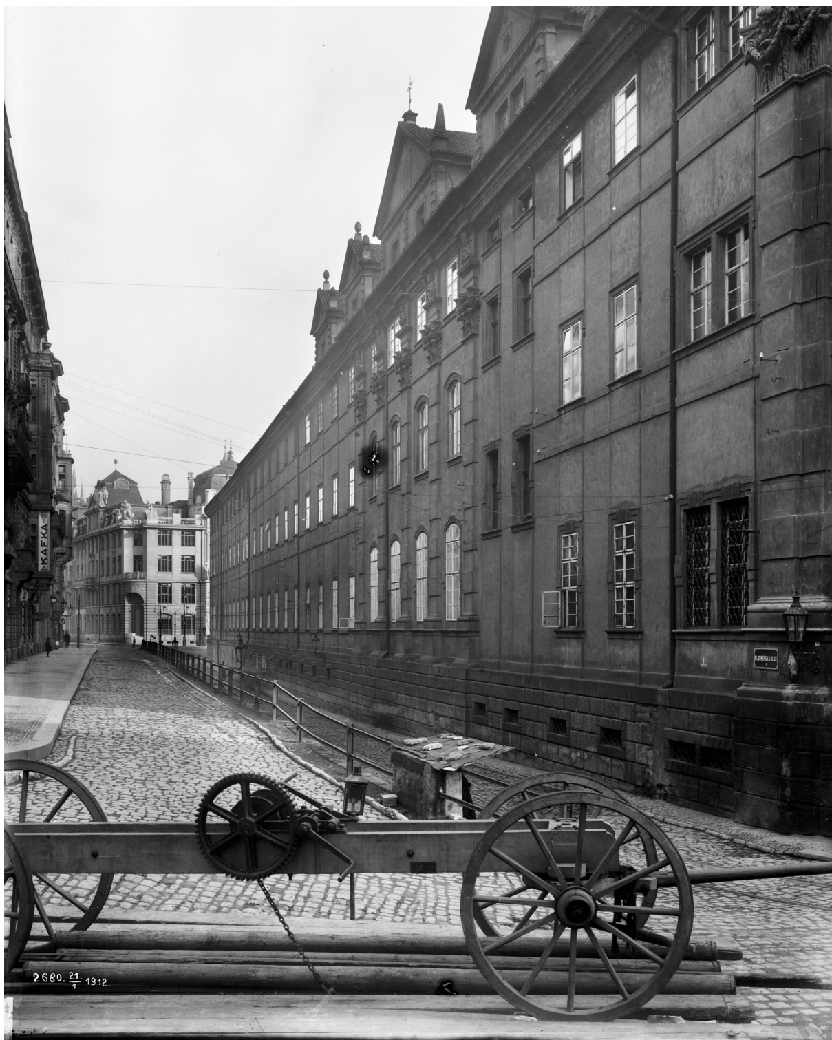
Pohled na severní křídlo Klementina v Platněřské ulici. Výzdoba i arkýře dodnes zvyrazňují tu část areálu, kde se od šedesátých let 17. století nacházela kaple sv. Eligia.