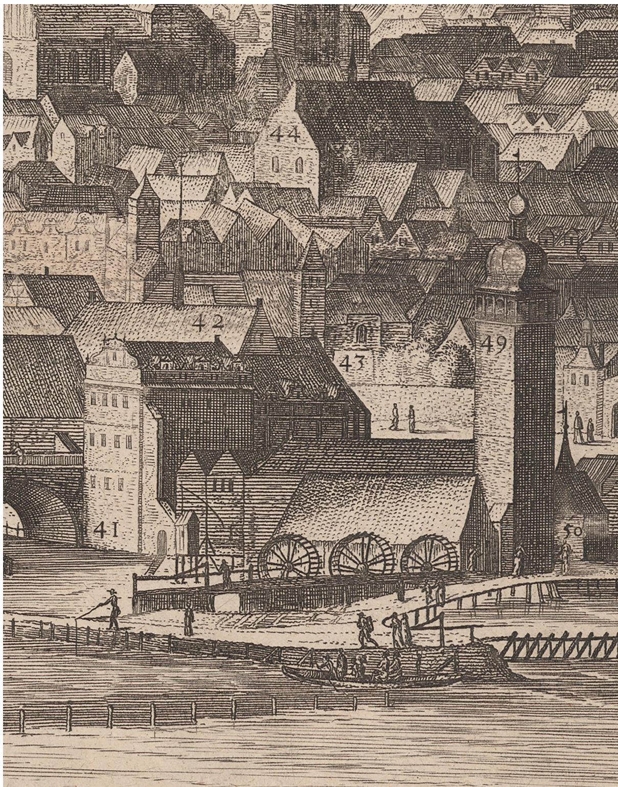
Kostel sv. Eligia na tzv. Sadelerově prospektu Prahy z roku 1606. Autorem předlohy grafického listu byl Philip van den Bossche.