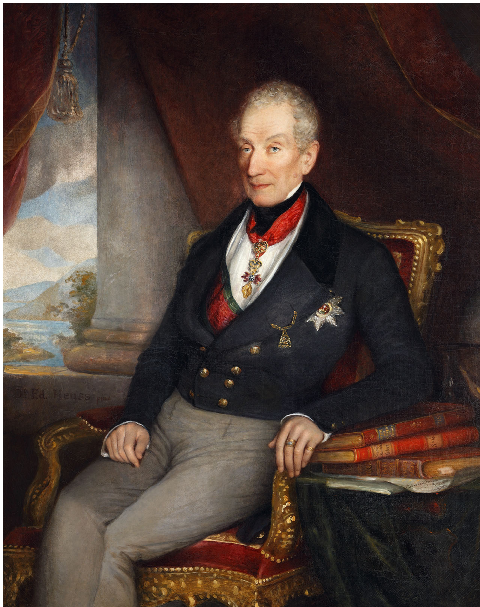
Fig. 1.2 Klemens Wenzel Nepomuk Lothar Prince Metternich, 1841, author: Eduard von Heuss, Inv. No. KY 1533.

kustoda sbírek. Tu představoval právě již bývalý kat Huss, který hosty rozmanitými kolekcemi osobně provázel. Byl to také Huss, kdo muzeum pojmenoval jako Metternichovský knížecí kabinet mincí, minerálů, zbraní a umění – „Hochfürstlich von Metternichsches Mineralien- Waffen- und Kunst-Cabinet“ (Huss 1828) – a kdo rovněž založil návštěvní knihu „Einschreib-Buch, das Fürstlich von Metternichsches Münz- und Mineralien-Cabinet zu Königswart für die besuchenden Fremden“ (Kancelářova knihovna, č. 27-A-1). Díky této knize známe jména více či méně významných osobností, které si jedno z prvních veřejně přístupných muzeí v Evropě prohlédli. V jejich osobních dokumentech se pak můžeme dočíst o jejich dojmech a předmětech, které je zaujaly (Krickel 1834; Carus 1846; Kratzmann 1850). Přitom exkluzivitou mezi vystavenými exponáty již tehdy vynikaly diplomatické dary mocného místodržícího Egypta Muhammada Alího Pašy (1769–1849).