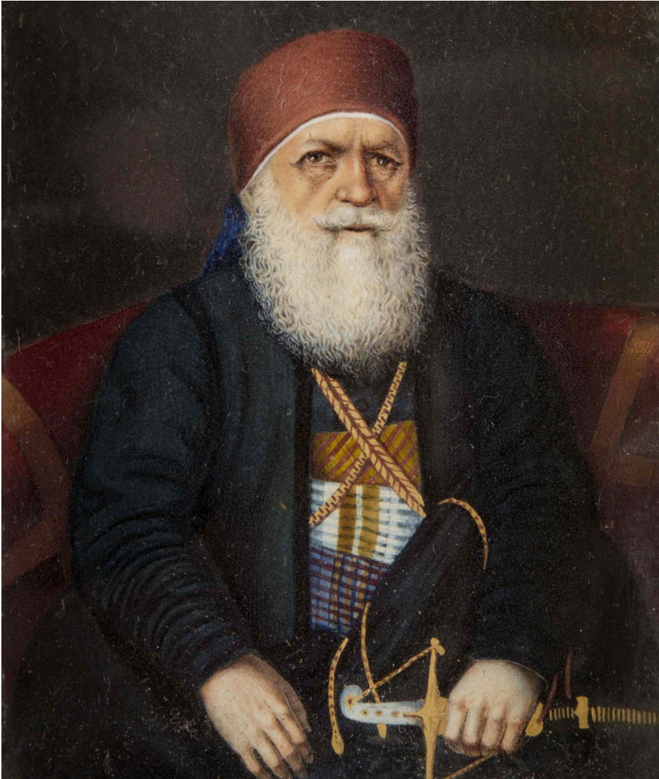
Obr. 1.5 Egyptský místokráľ Muhammad Alí, 1841; inv. č. KY 02524a3.