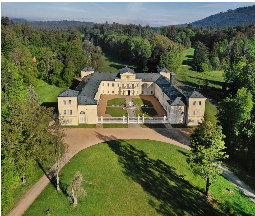
Obr. 1.1 Pohled na zámek Kynžvart od východu (Jaroslav Kocourek, Národní památkový ústav [následně NPÚ] – Státní zámek Kynžvart).

One of the oldest European museums can be found in the Kynžvart Castle (Fig. 1.1). Its establishment was a result of several circumstances. The most important factor was embodied by a person with wide interests and an extraordinary social status, Klemens Wenzel Lothar, Prince of Metternich (1773–1859), who served as the foreign minister of Austria between 1809 and 1848 and concurrently as Chancellor between 1821 and 1848. His parents and tutors brought him up in the spirit of the Enlightenment, moreover, he was encouraged to develop a broad range of interests. These were evident already during his studies in Mainz and Strasbourg, when he was devoted to natural sciences, history and arts (Siemann 2016: 58–82). Soon, these interests resulted in him “collecting, even hoarding all kinds of objects” (Bohatý – Velebil 2017: 6). Metternich surrounded himself with many works of art, paintings, prints, maps, sculptures, antiquities, as well as inventions, models, various devices and curiosities. He certainly collected these objects not only for the sake of social prestige, although a man of his kind could not be expected to be unaware of this dimension and unable to make proper use of it. Since his efforts in collecting various objects were generally known, many of those