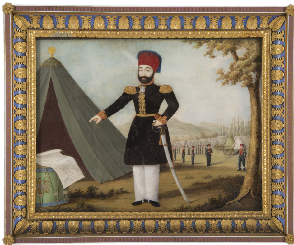
Fig. 1.6 Sultan Mehmed II of the Ottoman Empire, 1837, Marras, Inv. No. KY 2524a4.

doplněných 300 lahvemi tokajského. Ty dorazily do Alexandrie v listopadu 1829 a byly vystaveny v audienčním sále pod názvem Rakouská výstava. Dary z výstavy se těšily vysoké popularitě zejména mezi manželkami Muhammada Alího (Sauer 1971: 242–244). Tento krok byl motivován snahou o upevnění korektních vztahů s místodržícím osmanské provincie, se kterou mělo Rakousko rozsáhlou obchodní výměnu. Ve 30. letech se dokonce stalo největším evropským importérem egyptské bavlny. Do egyptských přístavů také připlouvalo mnoho rakouských obchodních lodí (Šedivý 2013: 448).