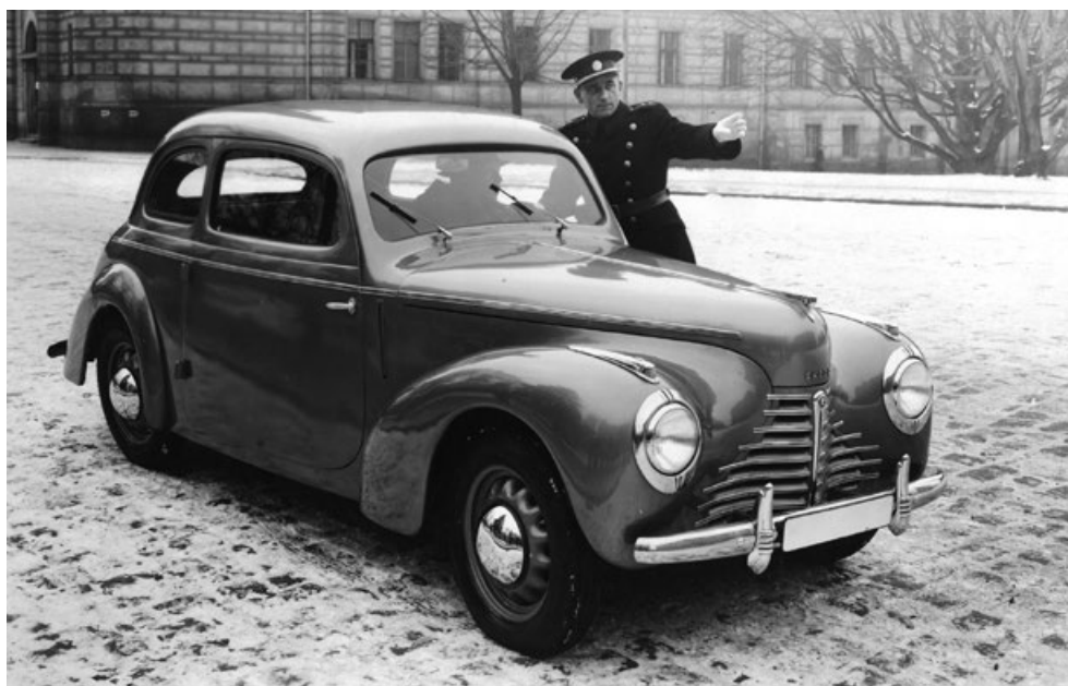
První poválečný automobil Škoda 1101, dokončený v březnu roku 1946

Škoda 1101 měla rozvor náprav 2485 mm, rozchod kol 1200 mm vpředu a 1250 mm vzadu. Byla dlouhá 4050 mm, široká 1500 mm a vysoká 1520 mm a v základním provedení vykazovala pohotovostní hmotnost 940 kg. Její užitečná hmotnost měla hodnotu 360 kg. Tudor dosahoval největší rychlosti přes 100 km/h, jako trvalou rychlost výrobce uvá-