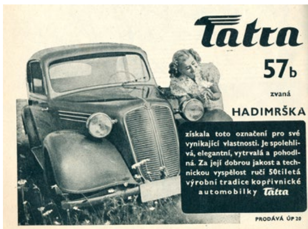
Reklama ÚP 20 na Hadimršku uveřejněná ve Světě motorů v červnu 1947

Ještě na přelomu šedesátých a sedmdesátých let patřily Hadimršky k běžnému obrazu našich silnic, dnes jsou ozdobou každé veteránské akce.