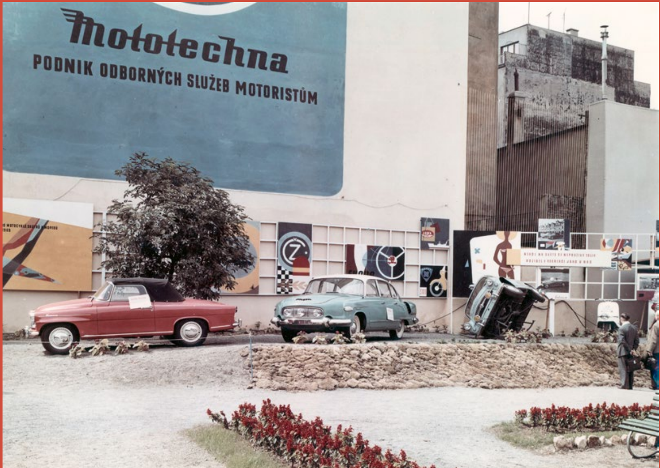
V létě 1960 vystavovala Mototechna vozidla na pražském Karlově náměstí

Poválečné počátky motorismu v Československu provázal nedostatek všeho. Od automobilů přes pneumatiky až po benzin. V roce 1946 v Mladé Boleslavi ze zbylých dílů smontovali posledních 250 malých vozů Popular 995 Liduška a na povolenky ministerstva dopravy je rozprodávali za 39 000 Kčs, ale bez pneumatik. Ty si zájemci museli opatřit sami.