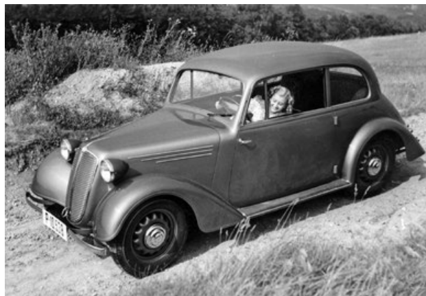
Poválečná Tatra 57 B, poháněná vzduchem chlazeným plochým čtyřválcem

a povrchové díly z ocelového plechu. Od své předchůdkyně se navenek odlišovala nejen nově tvarovanou zaoblenější kapotou a předními blatníky, ale také nově upravenou zádi karoserie. Náhradní kolo bylo nyní uloženo uvnitř, ve vodorovné poloze pod dvojitým dnem zavazadlového prostoru. Ten byl nově přístupný zvenku nahoru vyklápěcím víkem, dole opatřeným dvěma klikami.