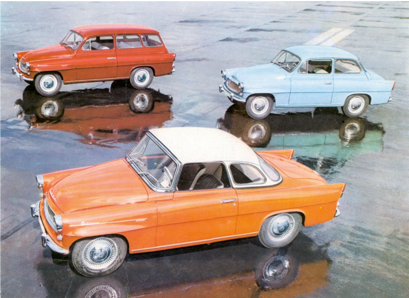
Česká klasika z roku 1963: Škoda Felicia Super, Octavia a Octavia Combi

Pětačtyřicet let poválečného rozvoje našeho automobilismu představuje pestrou mozaiku nadějí, úspěchů i trpkých zklamání. Mezi zeměmi východního bloku bylo Československo výjimečné dlouhou a bohatou tradicí vlastní výroby automobilů, ale také šíří a množstvím jejich dovozu. Nejen ze spřátelených východních zemí, ale také ze Západu.