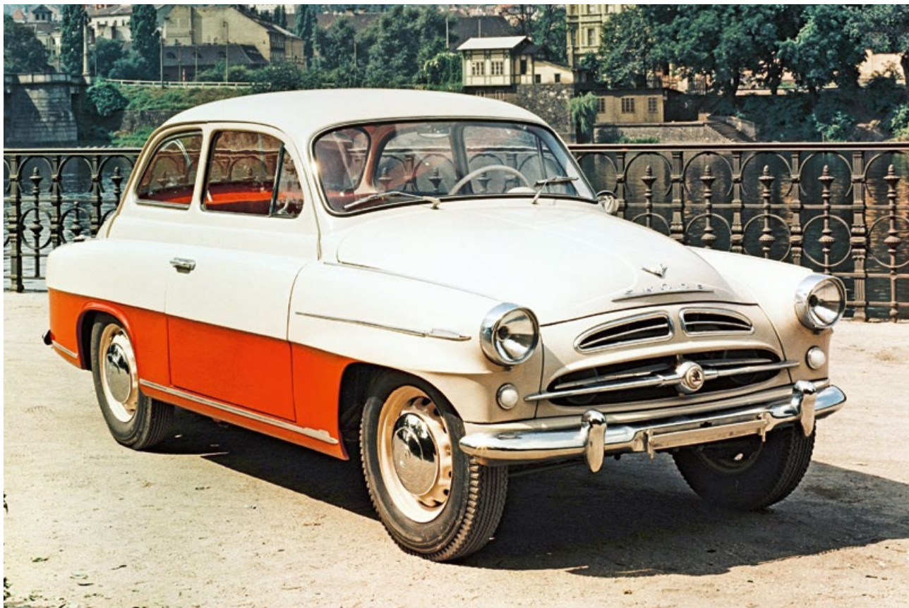
Škoda 445 Spartak vybavená motorem 1221 cm 3 o výkonu 45 k

Ve druhé polovině čtyřicátých let už československý automobilový průmysl podléhal centrálnímu řízení. Jeho výrobní program navazoval na předválečné konstrukce. Vozy Škoda měly nadále páteřový rám s centrální nosnou rourou, s nímž debutoval v roce 1934 model Popular, kopřivnická Tatra 87 se vzduchem chlazeným osmiválcem v zádi pokračovala téměř beze změny, nový vůz Tatraplan s plochým čtyřválcem také respektoval tradice značky. Novinkou vyvinutou za okupace byl malý vůz Minor s dvouválcovým motorem a předním pohonem.