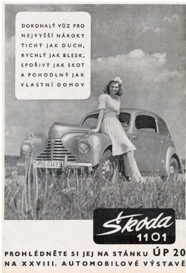
Lehce humorná reklama prodejny ÚP 20 ze Světa motorů z října 1947

děl 85 km/h. Jeho spotřeba benzínu se pohybovala mezi 9 až 11 l na 100 km. Automobily Škoda 1101 se představily světové veřejnosti v říjnu 1946 na prvním poválečném ročníku pařížského autosalonu. Byly označeny jako modely Škoda 1947 a vedle dvoudveřového uzavřeného modelu se tam objevil i dvoumístný roadster a čtyřdveřový polokabriolet s pevnými rámy dveří a oken a skládací textilní střechou. Toto provedení se však sériové výroby nedočkalo.