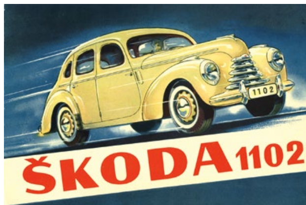
Prospekt čtyřdveřového sedanu Škoda 1102 v provedení z roku 1949

Od jara 1949 se souběžně s typem Š 1101 vyráběl i lehce modernizovaný typ Š 1102 s řadicí pákou pod volantem, větracími klapkami na bocích před dveřmi a robustnějšími nárazníky v barvě karoserie s lesklou ozdobnou lištou. V témže roce počet vyrobených čtyřdveřových sedanů poprvé pře-