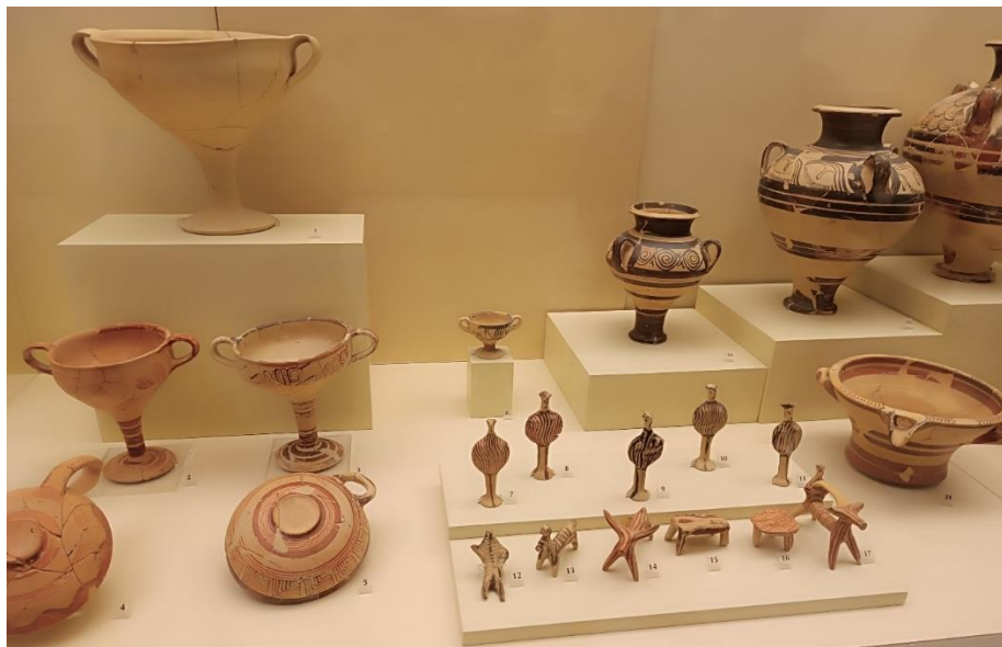
(Obr. 4) Poháry kylix a obětní figurky z Petsas house v dolním mykénském městě (vystaveno v Archeological Museum of Mycenae).

Zdejší dílny produkovaly tisíce kusů keramiky – především ušatých pohárů kylix – pro místní obyvatelstvo, palác či obchod s Kyprem i dalšími odbytími. Vyráběly se zde i figurky lidí a zvířat, s kultovní a votivní funkcí. Tento dům se nazývá v angličtině Petsas house po svém objeviteli a vzniknul během 14. stol. př. n. l.