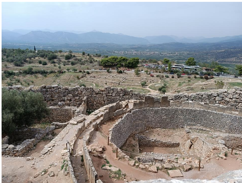
(Obr. 5) Hrobový okruh A se zbytky luxusního obložení. Dole pod hradbami pozůstatky sídel dolního města.

Jde o jednu z nejvýznamnějších lokalit svého typu z dané epochy v celém Řecku. Tvoří ji několik staveb. Součástí je chrám, svatyně i síň megaron , ale taky technické, skladovací a pracovní zázemí. Nachází se zde slavný „dům fresek“. Místo je s palácem spojené procesní cestou, která začíná dlouhou rampou. Cesta, nebo její část, byla zřejmě i zastřešená baldachýny, aby slavnostní průvody, které tudy o svátcích proudily, netrápilo ostré slunce nebo jiné rozmarné počasí.