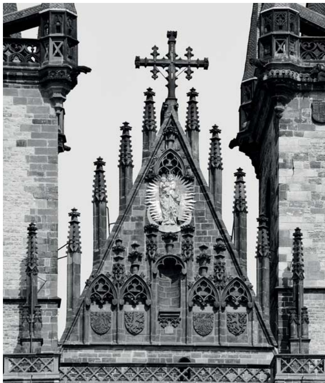
V · Praha, kostel Panny Marie před Týnem, západní štít hlavní lodi