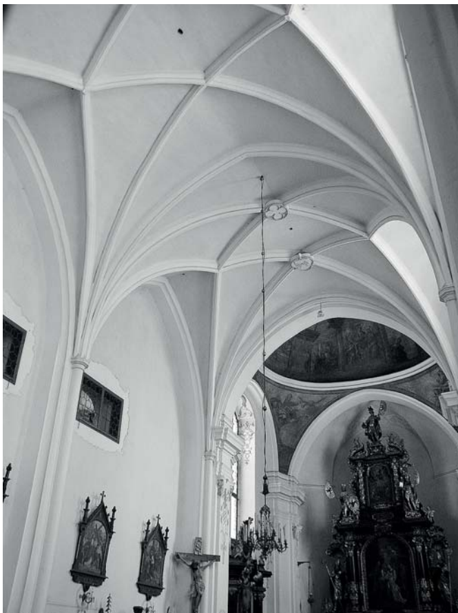
VIII · Borovany, kostel Navštívení Panny Marie při bývalém proboštvství augustiniánů kanovníků, pohled na klenbu lodi od jihozápadu

gotickým kostelům spatřoval v architektuře klášterního kostela augustiniánů v Borovanech „jediný příklad jihobavorského vlivu u nás“. [obr. VIII] Posunul starší dataci kostela v Žumberku (1455) do poslední třetiny 15. století a započítal kostela v Blatné (presbytář 1444) nejdříve do třetí čtvrtiny 15. století. Z městských staveb poděbradského období upozornil Líbal kromě severní Malostranské mostecké věže v Praze na Pražskou bránu ve Slaném (zbořena 1841), z hradních staveb na konzervativní novostavbu východočeského hradu Litice (1468).