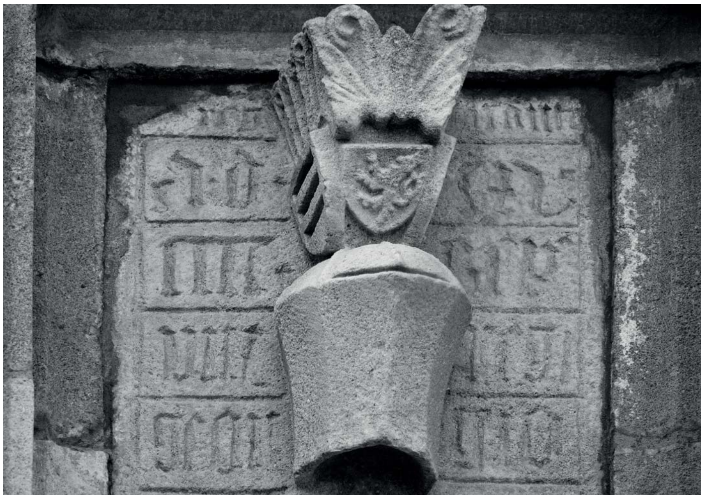
VII · Litice, hrad, detail znakové desky českého krále Jiřího z Poděbrad z roku 1468 na vstupní bráně