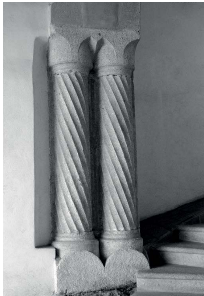
IX · Jindřichův Hradec, zámek, sružené sloupy arkády v přízemí spojovacího křídla mezi dvorním traktem starého paláce a bočním křídlem bývalého hradu

Z předních znalců české středověké architektury se po Bernhardu Grueberovi, Karlu Chytilovi, Vojtěchu Birnbaumovi, Václavu Menclovi, Dobroslavě Menclové a Dobroslavu Líbalovi k architektuře poděbradského období vyjádřil Götz Fehr. Okrajově nejprve ve své monografii o Benediktu Riedovi (1961) 50 a následně jako autor kapitoly o pozdně gotické architektuře v syntéze českého gotického umění kolektivu německých historiků umění Gotik in Böhmen (1969). 51 V základní charakteristice se neodchýlil od výsledků staršího bádání. Architekturu po husitských válkách charakterizovala neinvenční závislost na pražské parléfovské huti. Důraz měl být kladen na výzdobu („ standen Dekoration, Verschönerung, Ausschmückung im Vordergrund “). Tyto tendence přetrvávaly ještě na počátku vlády Vladislava II. Jagellonského (Prašná brána, hradní kaple Křivoklátu, chór kostela sv. Barbory v Kutné Hoře, orloj Staroměstské radnice).