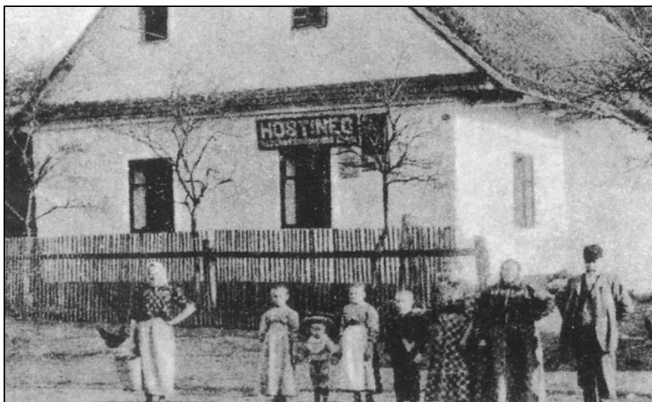
Hostinec U Zapletalů v Javoříčku v roce 1930