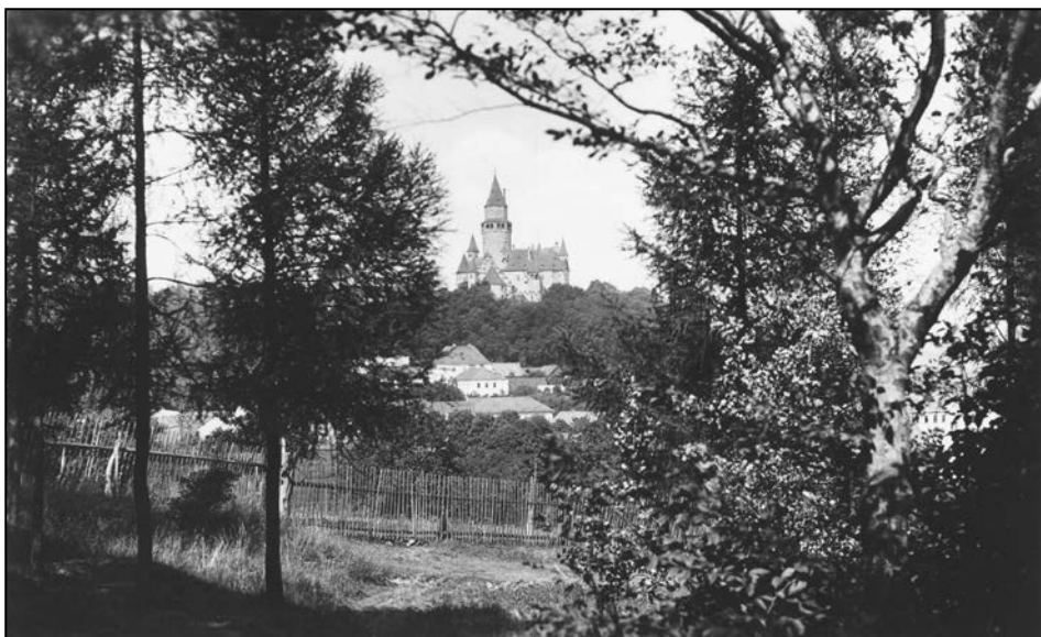
Bouzov na dobových pohlednicích