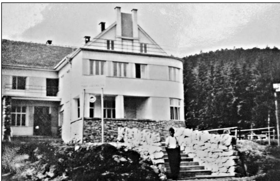
Hotel v Javoříčku krátce po dokončení