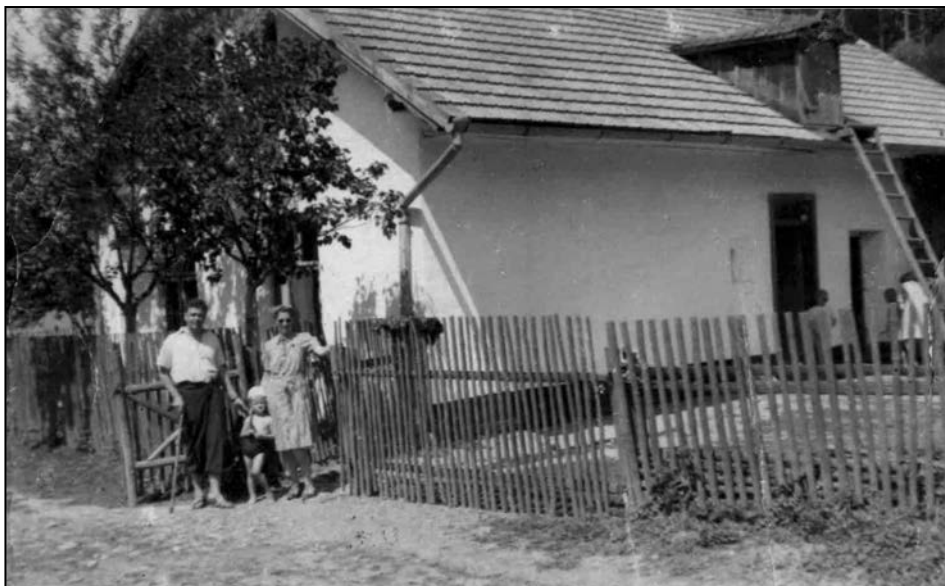
Domek Václava Vlčka čp. 29