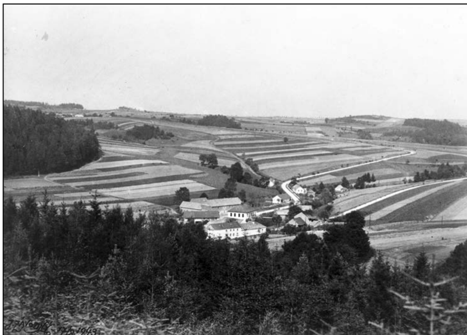
Celkový pohled na Javoříčko v roce 1943