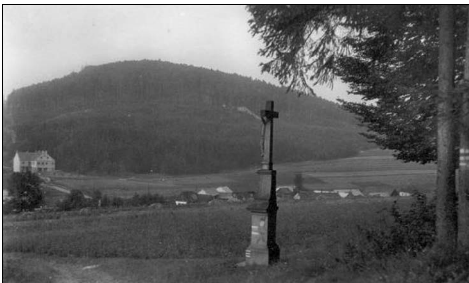
Ještě jeden pohled na Javoříčko z roku 1944. Na protějščí stráni je hotel Adolfa Pospíšila, v lese vpravo vstup do jeskyní