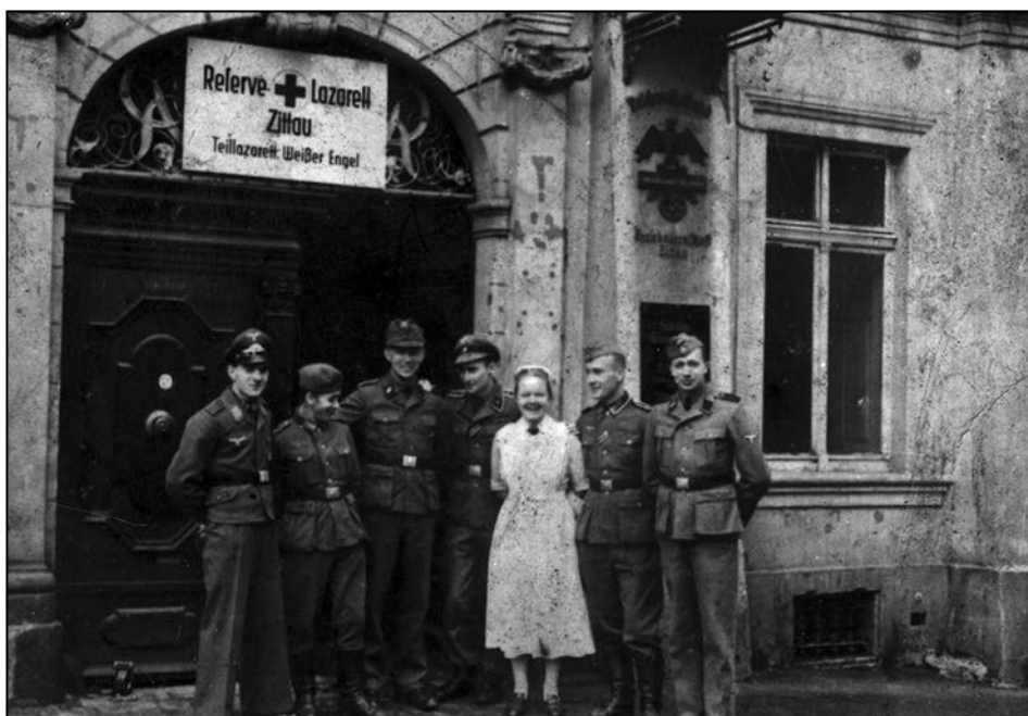
Othmar Víctora (uprostřed) se skupinou německých vojáků