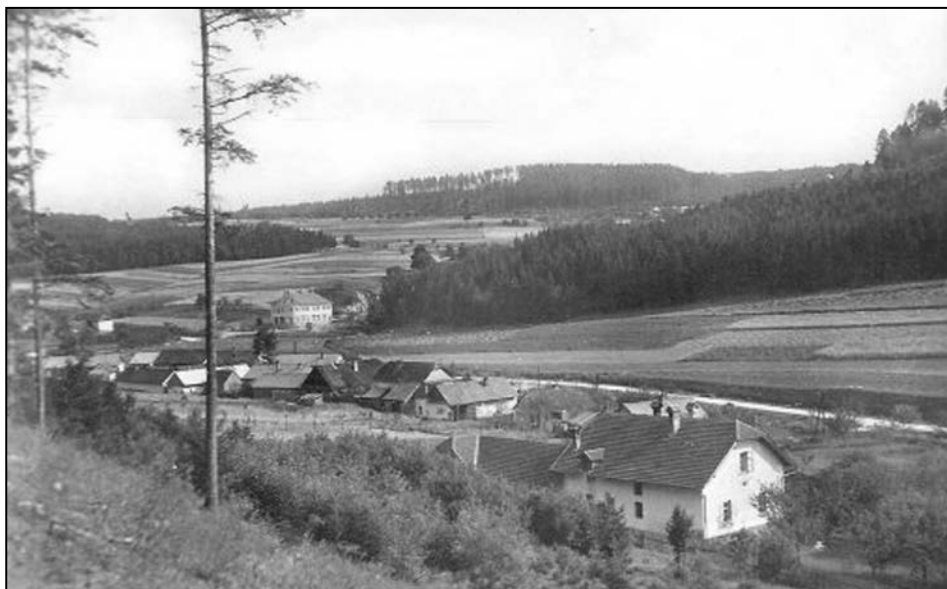
Pohled na Javoříčko z roku 1933