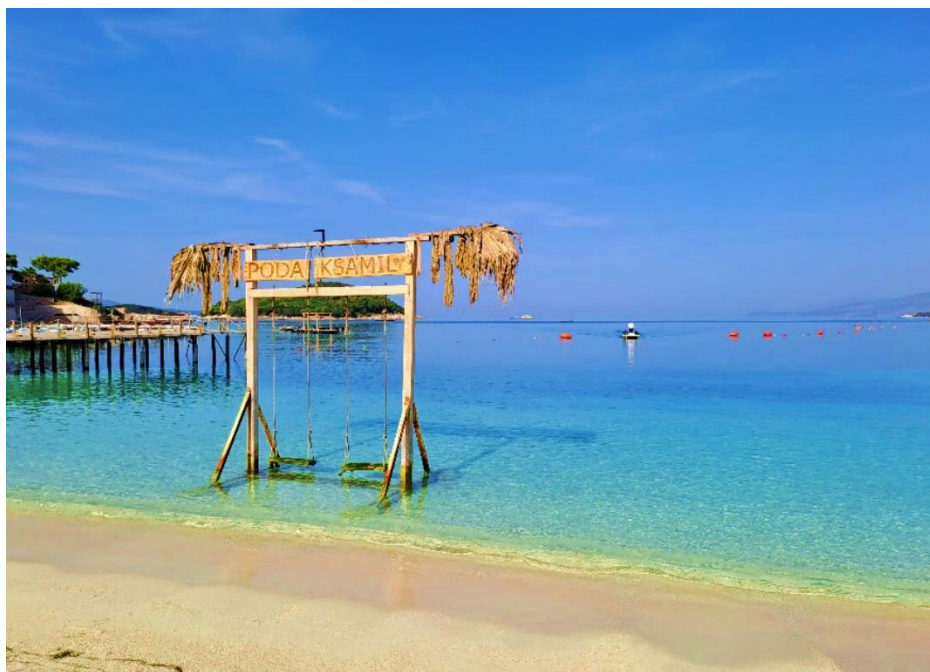
Albánské pláže připomínají Karibik.

Do Albánie mě to táhlo už dlouhé roky. V rámci Evropy se jedná o méně probádanou zemi, destinaci s nádechem exotična a neznáma. Tahle místa, kde nejsou davy turistů, mám moc rád, a tak nějak jsem tušil, že právě to mi Albánie poskytne. Když se potom po asi sté vlně