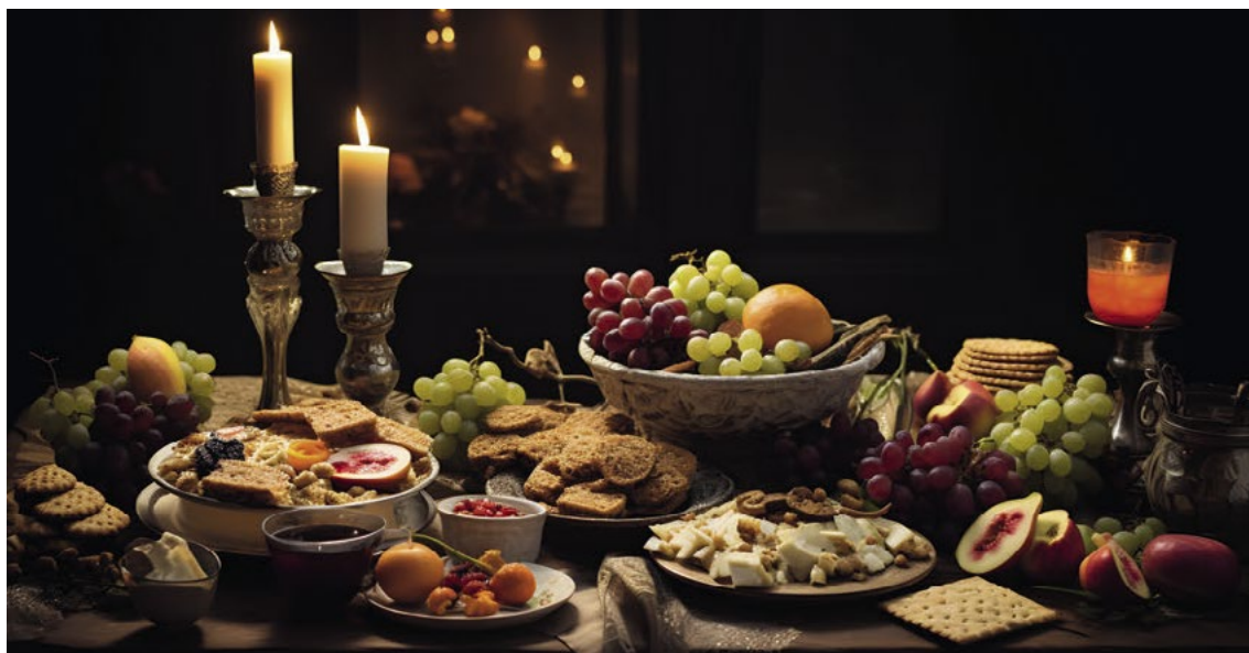
Sváteční pesachová tabule

V nejstarších dobách bylo totiž vnímání Velikonoc spojeno s přírodními jevy a cykly. Vítání jara mělo souvislost se vznikem a uctíváním kultu slunce, vítáním světla a tepla, které přicházelo po dlouhém chladném zimním období. Zkušenosti generací předků pomáhaly lidem alespoň zčásti předvídat chování všemocné matky, živitelky přírody. Se vznikem prvních civilizací pak dochází k organizovanějšímu uctívání a zbožštění přírodních cyklů. V Babylonu, kde mají Velikonoce svůj původ, byla uctívána bohyně nebes Astarote. S uctíváním této bohyně byl spojen zvyk „péct kulaté koláče se znamením kříže, což bylo babylonské mystické znamení