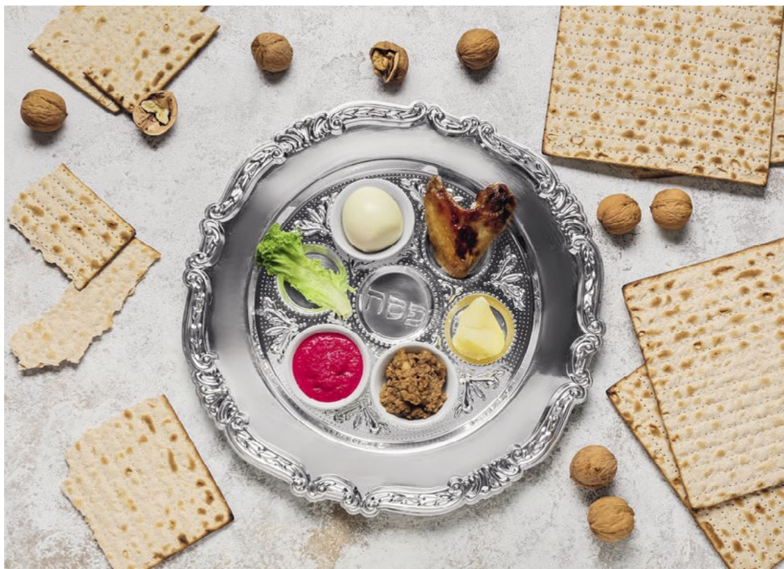
Tradiční sederová večeře o prvním večeru svátku Pesach

života“. Kříž jako symbol života nám dokládá fakt, že již tisíce let před Kristem vyjadřovali tehdejší lidé své vnímání reality za pomoci symbolů. Vždyť člověk sám – svým tělesným utvářením – je takový kříž, stačí rozpažit.