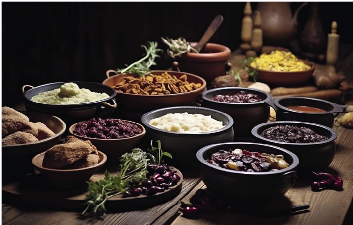
Velikonoční tabule s postními jídly