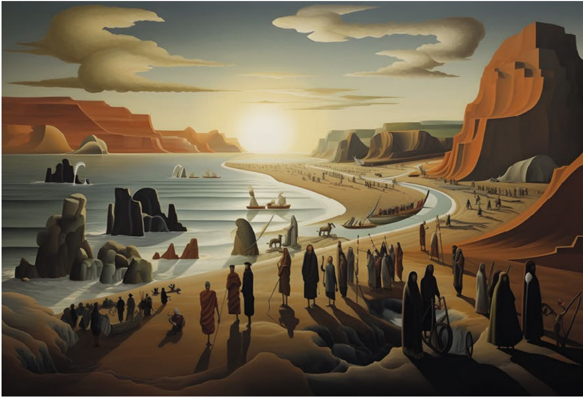
Vyvedení z Egypta

Křesťanské pojetí Velikonoc navazuje na židovskou tradici svátku Pesach, kdy po záchraně prvorozených a následných deseti egyptských ranách byli Židé propuštěni a vyvedeni Mojžíšem. Zbavení se pout otroctví a ponížení, někdy také smrti, nacházejí své historické završení