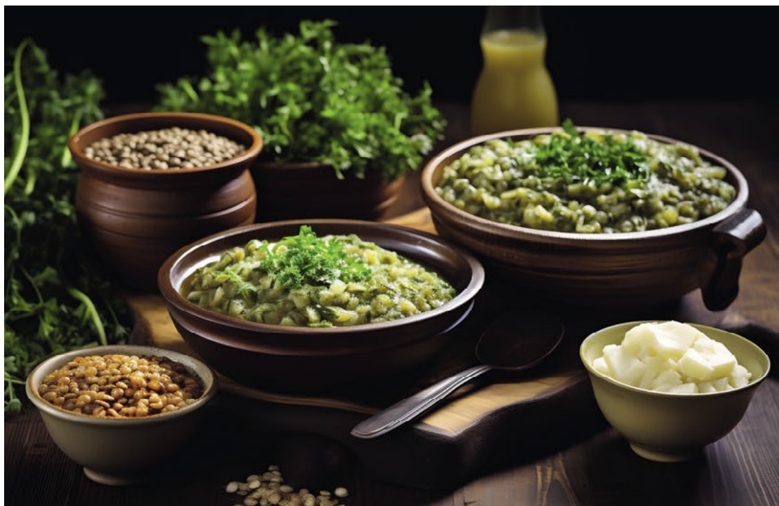
Pučálka, typické postní jídlo

Pokud si promítneme dnešní pojetí Velikonoc, které se hodně věnují dětem a završují se Velikonočním ponděním s pomlázkou, je to poměrně výrazný kontrast. Liščí nedělí byla nazývána také proto, že hospodyně napekly brzy ráno sladké preclíky, pověsily je na stromy v zahradě a dětem sdělily, že je tam poztrácela liška, která tudy běžela. Je tu jistá souvislost s jinou tradicí, hledáním vajíček na zahradě, jak je tomu zvykem v některých evropských zemích.