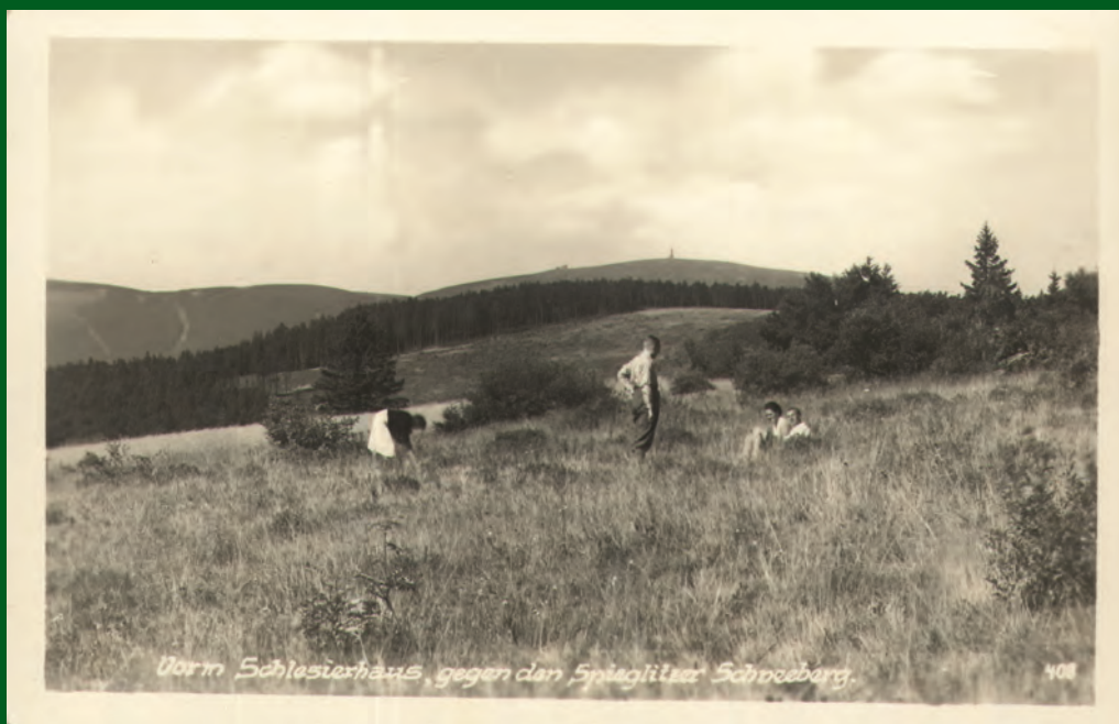
Králický Sněžník od východu (od Paprsku). Pohled odeslaný v roce 1940.