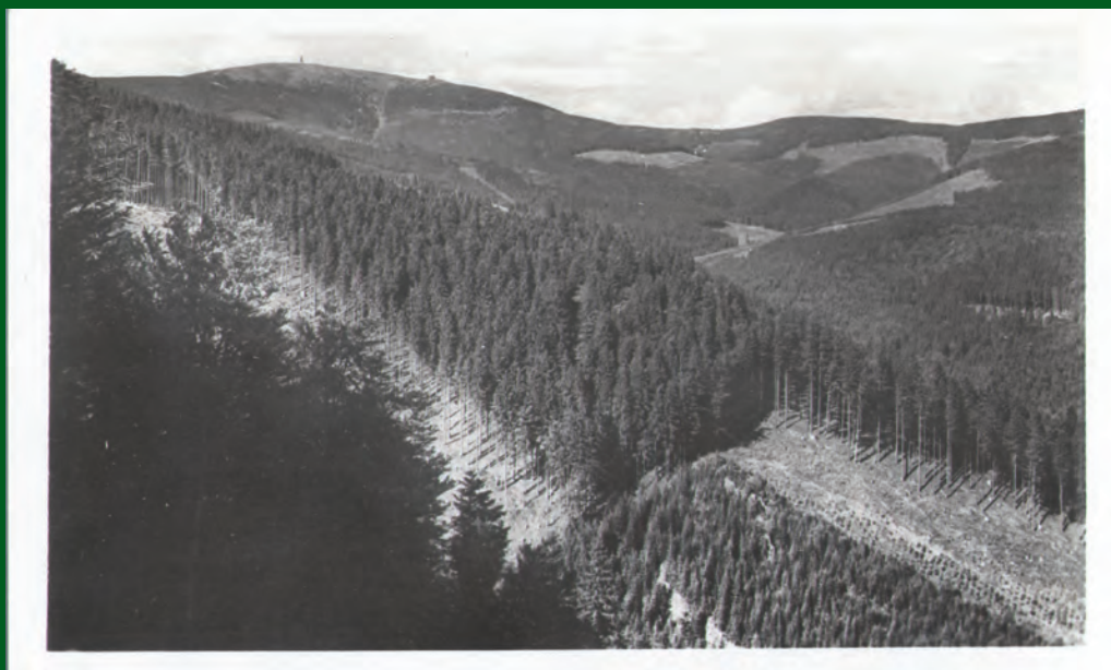
Vrchol Králického Sněžníku od jihozápadu. Pohled vydaný po roce 1945.