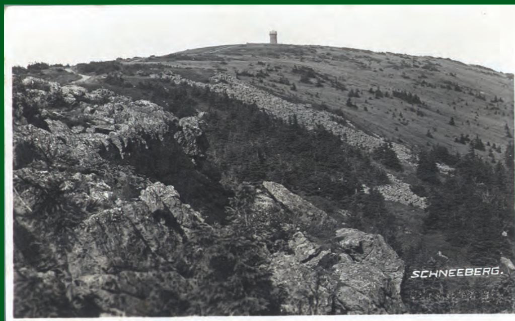
Z Vlaštovčích kamenů přes kamenná moře k rozhledně. Pohled z třicátých let.