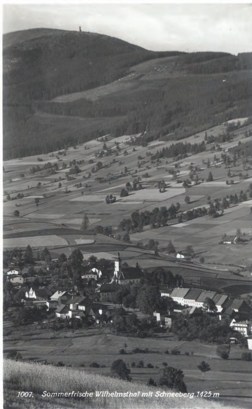
1007. Sommerfrische Wilhelmsthal mit Schneeberg 1425 m

Ráz každého pohoří, ale vůbec každého kraje, určují do značné míry horniny, které je budují. Králický Sněžník z největší části budují ruly. Říká se jim sněžnické ruly nebo ruly sněžnického typu. Jsou většinou šedé, jen zřídka růžové nebo červené, středno - nebo hrubozrnné. Mají málo slíd a proto jsou pevné, jejich rozpad je deskovitý nebo