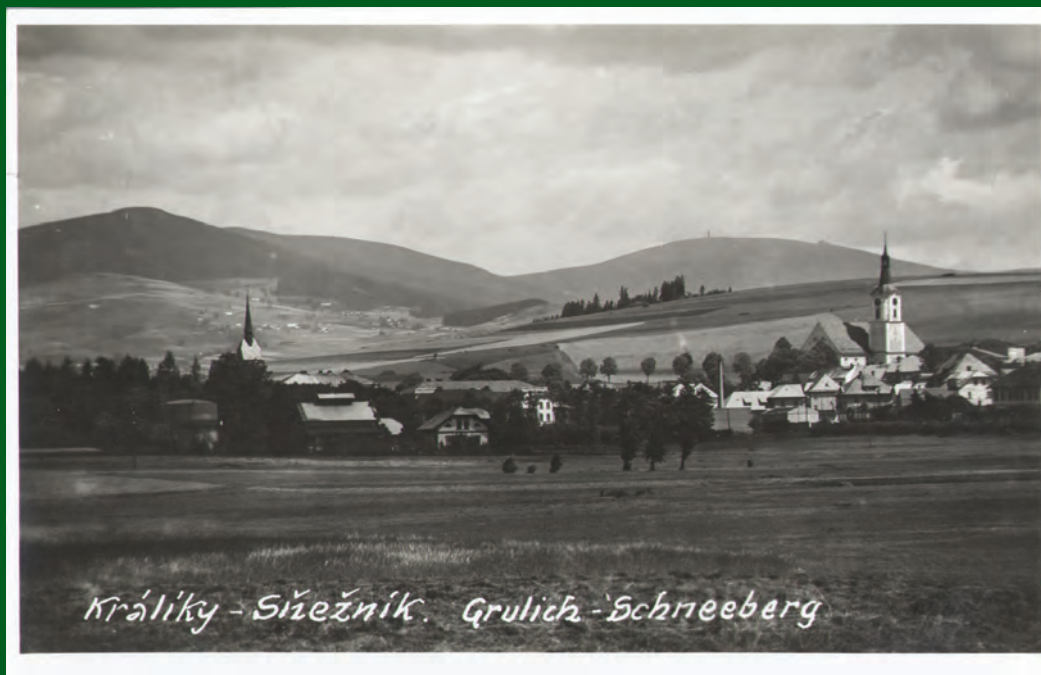
Centrum Králíků, Králický Sněžník a Klepý. Pohled z třicátých let.