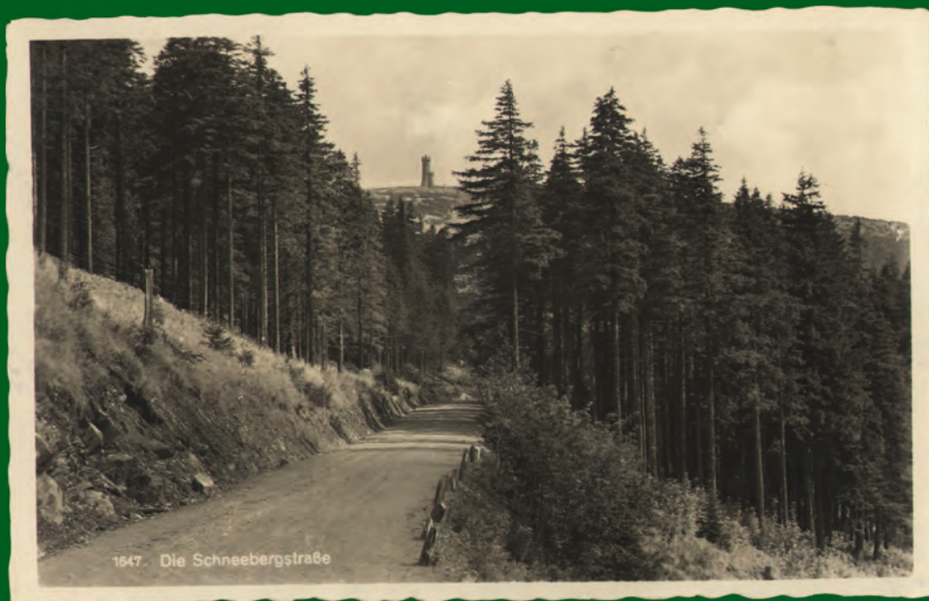
Rozhledna na Králickém Sněžníku od severu, z tzv. Sněžnické silnice. Pohled vydaný v Kladsku, odeslaný v roce 1939.