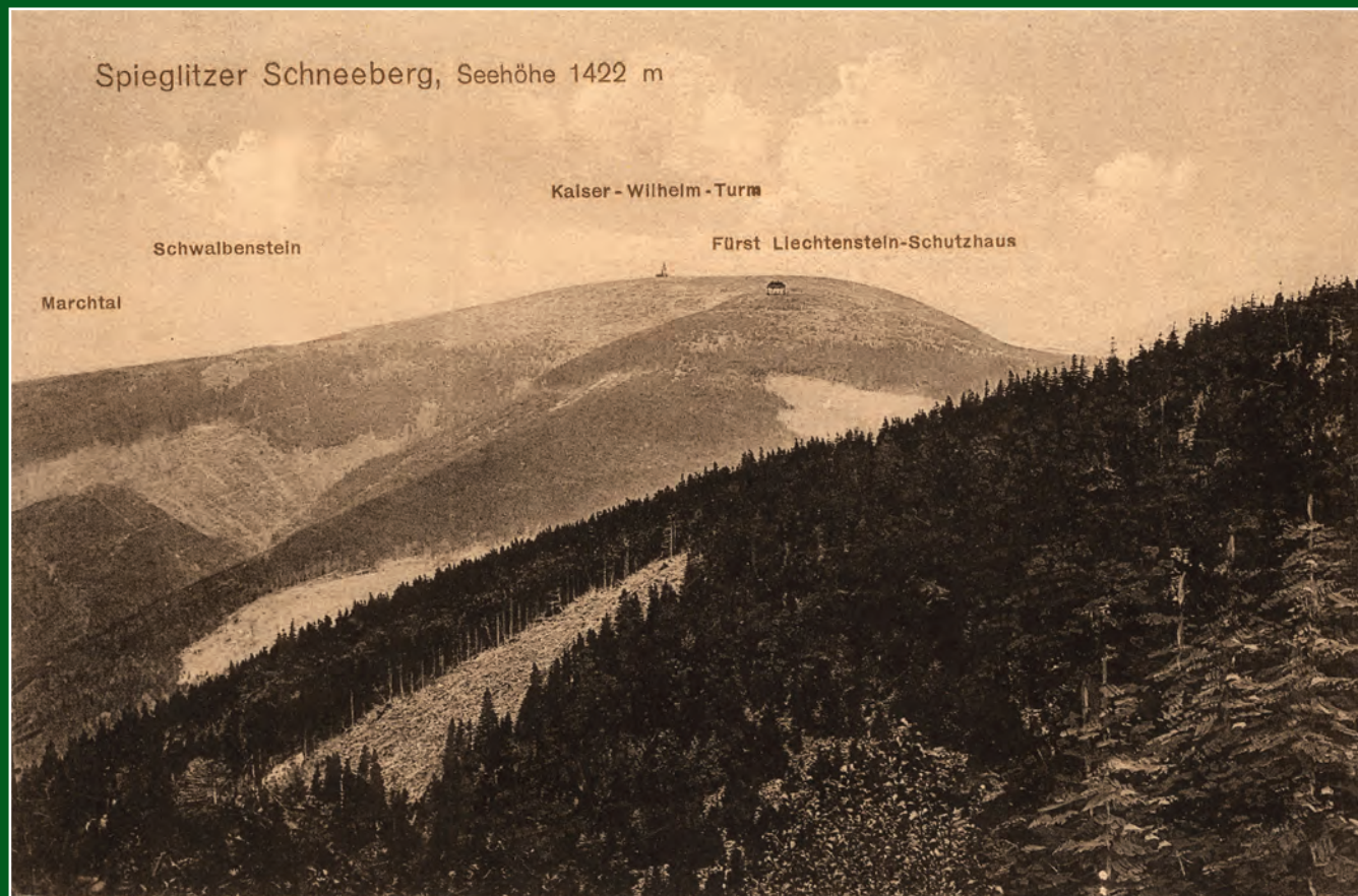
Králický Sněžník s rozhlednou a chatou od jihovýchodu. Pohled zakoupený v roce 1918.

Králický Sněžník (1423,7 m n.m.) je jedna z nejvyšších hor České republiky, zároveň ale je to i pohoří, rozlohou nejmenší v ČR (76 km 2 ). Ovšem jako pohraniční pohoří pokračuje do Polska, kde má poněkud větší rozlohu než u nás. Naše část pohoří má střední nadmořskou výšku 931 m a jeho hranice vedou v 600 – 900 m n.m. Jméno Sněžník je od toho, že na vrcholu dlouho leží sníh – ve starých průvodcích se píše, že sotva 4 měsíce v roce je bez sněhu. Po druhé a v podstatě už po první světové válce se v češtině ustálil pro horu i pro pohoří název Králický Sněžník. Němci horu nazývali různě: v Čechách Grulicher (Králický), na Moravě Spieglitzer (Špiklický) a v Kladsku Glatzer nebo Grosser Schneeberg. Pohoří říkali většinou Schneegebirge, což je do češtiny možno přeložit jako Sněžné hory.