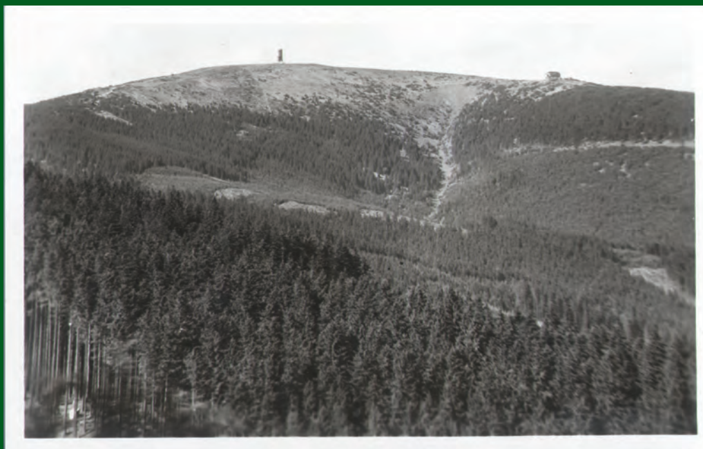
Vrchol Králického Sněžníku a nejhořejší tok Moravy od jihozápadu. Vydal Čuda v Holicích po roce 1945.

nejméně jeden „nerespektuje“ evropské rozvodí a z polské Medvědí jeskyně teče k nám do povodí Moravy, jak prozradily kolorační experimenty v letech 1982 - 83.