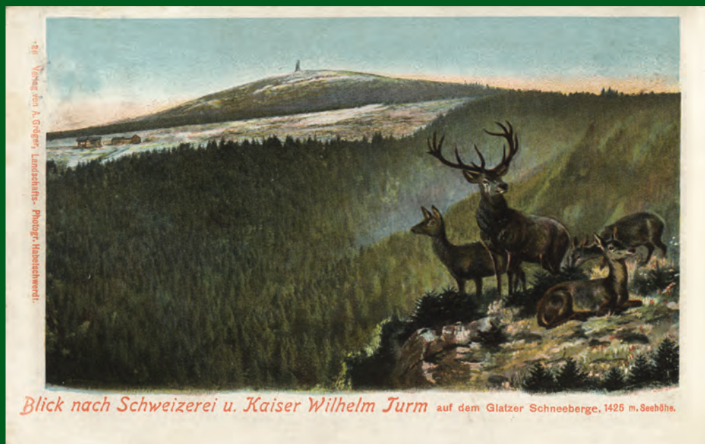
Vrchol Králického Sněžníku se Švýcárnou od jihozápadu (montáž s jelení zvěří). Pohled odeslaný r. 1908.