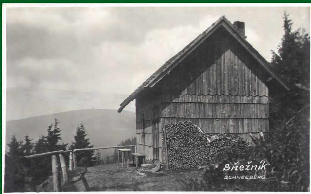
Vrchol Králického Sněžníku od lovecké chaty pod Podbělkou. Pohled z třicátých let.

pravoúhle kvádrovitý. Přirozeně vzniklé kameny v kamenných mořích a svahových uloženinách jsou nebo byly celkem bez úpravy vhodné na stavby zdí a zídek a také na stavby agrárních hald a valů, které v oblasti Malé Moravy, Skleného a Vojtíškova jsou nejlépe a nejdůkladněji postavené v celé České republice a ve své dokonalosti mají nepochybně světové parametry. Jenom podřízeně probíhají pohořím pruhy jiných hornin, které patří k tzv. sérii stroňské. K nim patří granátické svory, amfibolity a zejména krystalické vápence (mramory). Tak zvaný sněžníkovský mramor se po staletí těžil u Velké Moravy jako dekorační kámen na ušlechtilé a leštěné kamenické výrobky. Ještě proslulejší byl a je mramor z polské strany od obce Kletna s obchodními názvy růžová, zelená a bílá Marianna. Ve vápencích stroňské série se vytvořily i pozoruhodné krasové jevy. Na naší straně to jsou zejména jeskyně Tvarožné díry, známé už v 17. století, a četné ponory a vyvěračky v oblasti Velké Moravy. Na polské straně je prvořadou turistickou atrakcí jeskyně Medvědí s chodbami 2 km dlouhými, naleziště množství kostí vyhynulých savců, jeskynních medvědů a lvů i drobnějších zvířat. Fascinující je představa, že v hloubce v dutinách vápence proudí podzemní toky, z nichž