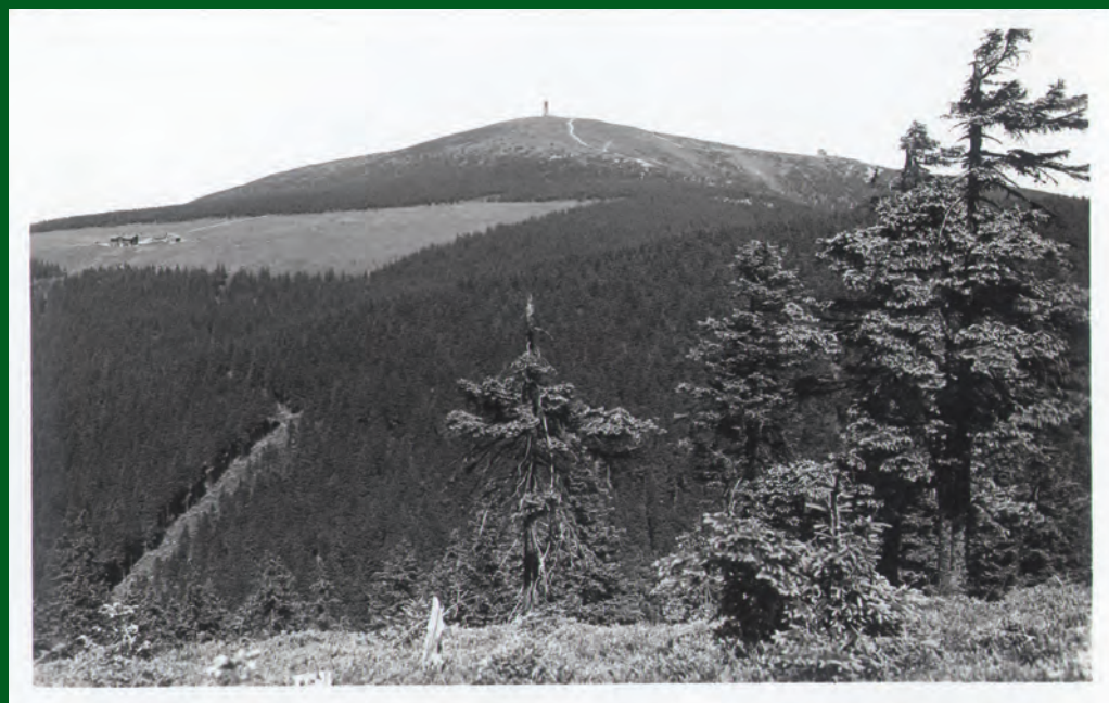
Králický Sněžník se Švýcárnou a Lichtenštejnskou chatou od jihozápadu. Pohled odeslaný r. 1938.