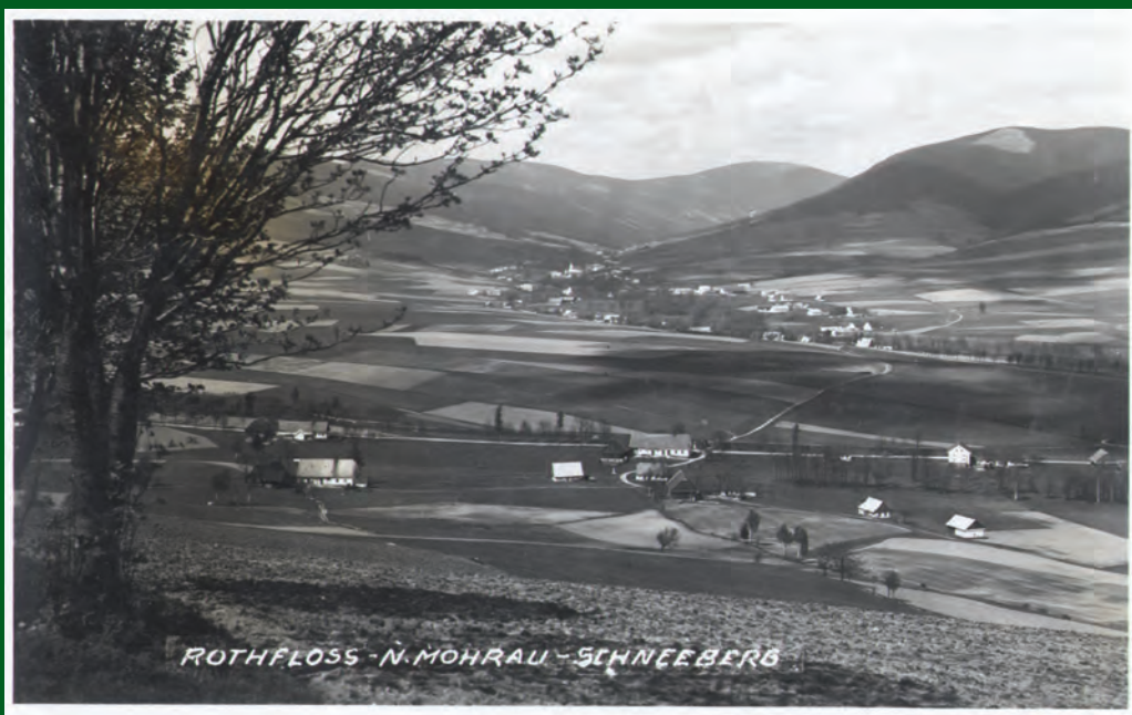
Pohled od Červeného Potoku ke Králickému Sněžníku. Pohled odeslaný r. 1935.

Když se Rakousko po neúspěšných válkách chtít nechť smířilo se ztrátou většiny Slezska, napětí na hranicích se zmírnilo. Zhoustlo zase v třicátých letech 20. století, kdy byly stále zřej-