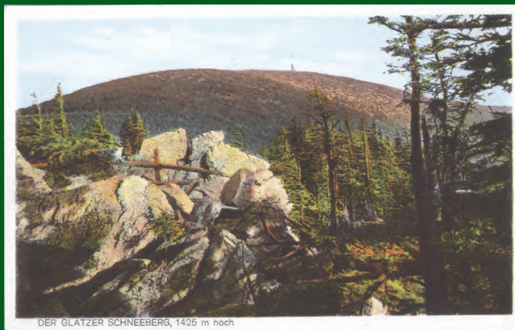
Vrchol Králického Sněžníku od severu. Pohled zakoupený v roce 1928.

Nejen nejvyšším bodem, ale doslova středem celého pohoří je mohutná kupa Králického Sněžníku, jejíž holý a po větši část roku zasněžený vrchol vyniká při pohledu ze všech stran. Však je také o sto metrů vyšší než další nejvyšší vrcholy. Od vlastního Králického Sněžníku vybíhá na všechny světové strany pět rozsoch – dvě k nám a tři do Polska. Do ČR vybíhá hřbet Sušiny (se Sušinou, 1322 m) a pohraniční hřbet s Malým Sněžníkem (1337 m). Tři polské rozsochy dosahují podstatně nižších výšek (nejvyšší hory jsou Šredniak 1210 m a Czarna Góra 1205 m).