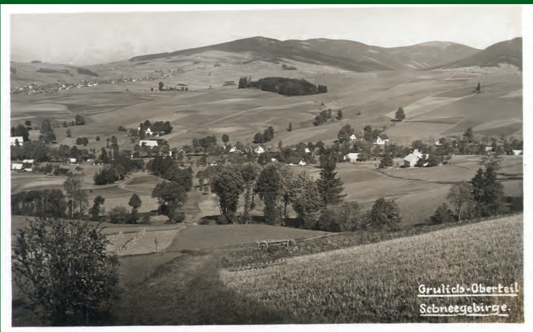
Pohled na horní konec Králíků, v pozadí pohraniční hřbet Králického Sněžníku s Klepým. Odeslán r. 1927.