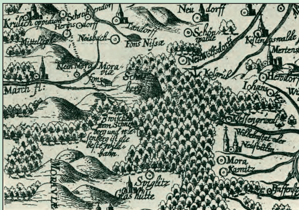
Králický Sněžník a pramen Moravy na Scultetově mapě kladského hrabství z roku 1626.