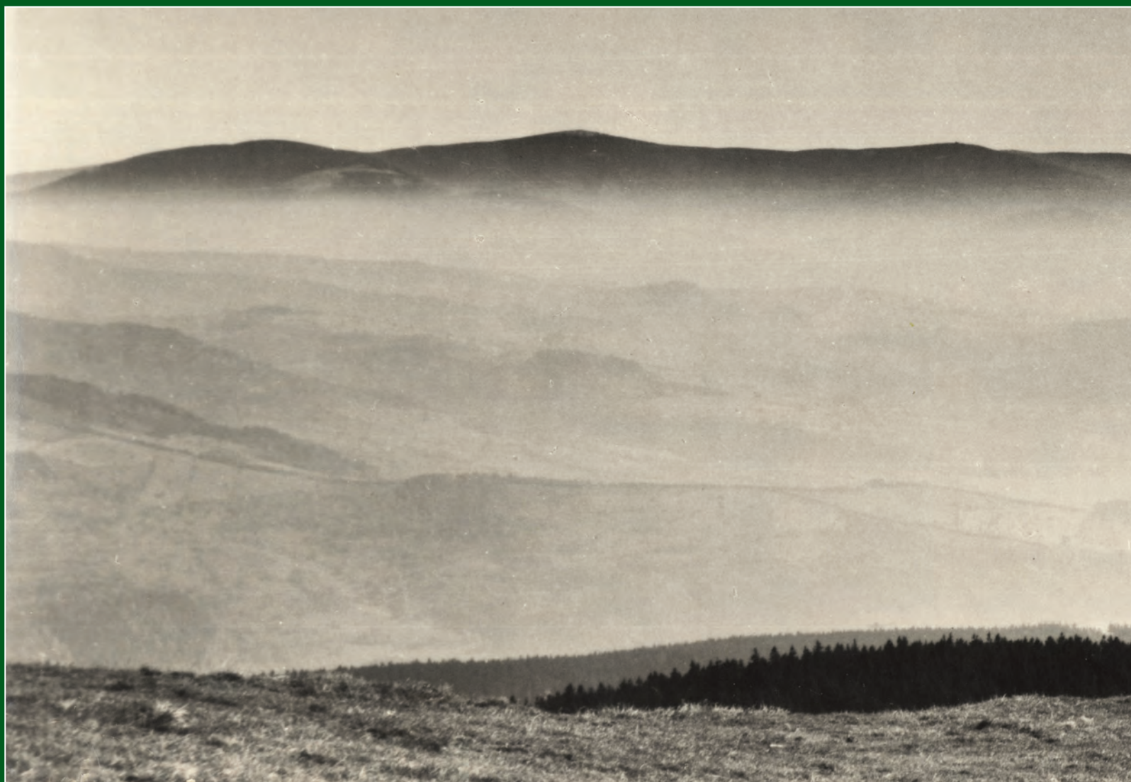
Pohled z Králického Sněžníku na Hrubý Jeseník.