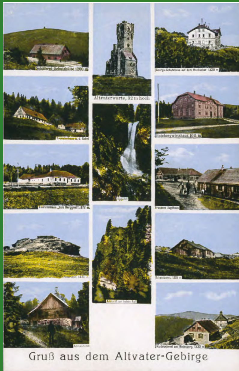
Gruß aus dem Altvater-Gebirge