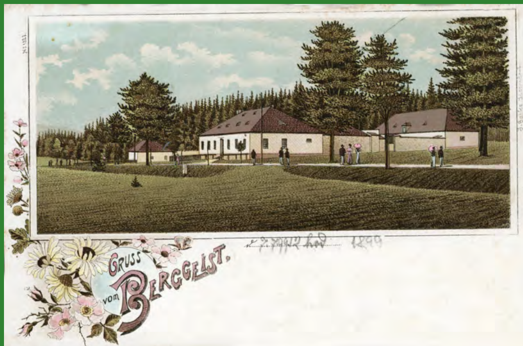
Pozdrav ze Skřítku, kolorovaná kreslená pohlednice, odeslaná v červenci 1899.

tu šumperská sekce německého horského spolku (MSSGV) měla vyčleněny dvě postele a v roce 1896 si hostinec od Kleinů pronajala a o dva roky později koupila a upravila na turistickou chatu. V roce 1911 se tu v reklamě uvádí 10 lůžek plus matrace v nolehárně. V restauraci lákali hosty na vždy čerstvé pivo a rakouská vína. V té době už zde jezdil i dvakrát denně autobus Sobotín – Rýmařov. Podmínky v sedle měly být ideální zvláště pro cyklisty, lyžaře a sánkaře. Je zajímavé, že centrem cykloturistiky byl Skřítek už koncem 19. století. Autobus i podle jízdního řádu z roku 1925 tu jezdil dvakrát denně, ale „poněkud“ pomaleji než dnes. Celá cesta mu trvala 1:55 až 2:05 hod. (Dnes jsou jízdní doby trasy Sobotín – Rýmařov 30 – 40 minut.) Větší inovace chaty proběhla v polovině třicátých let, kdy vznikly ubytovací prostory i v podkroví. Kapacita se pak udávala na 22 lůžek plus ubytování v nolehárně. Co se dělo na Skřítku za okupace, o tom máme velmi málo zpráv. Při přechodu fronty v květnu 1945 dřevěná chata vyhořela. Je těžké pochopit, proč pak celých dvacet let na tak turisticky exponovaném místě žádné zařízení pro turisty nebylo. Jeho potřeba se samozřejmě pociťovala. Až v roce 1965 nechalo