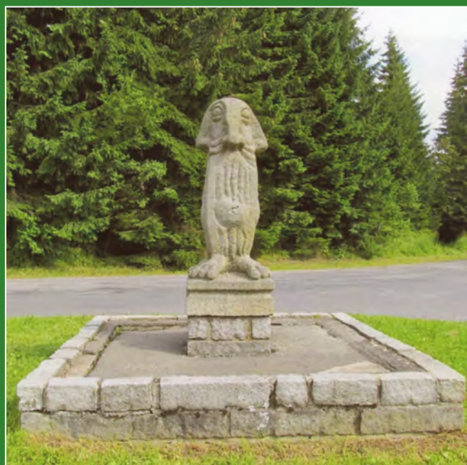
Skulptura skřítky či horského ducha stojí u chaty.