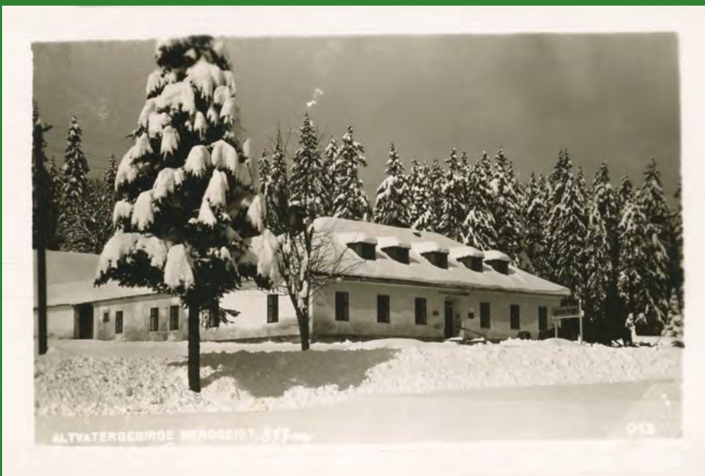
Chata Skřítek (Schutzhaus Berggeist) na pohlednici z doby okupace.