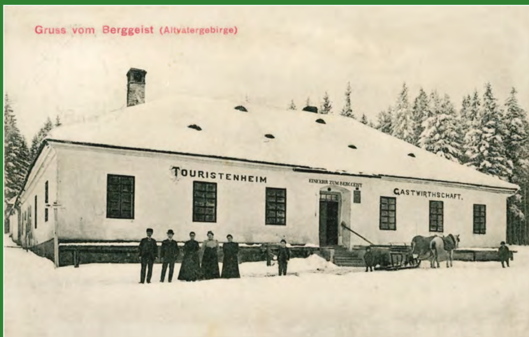
Zimní pozdrav ze Skřítku, odeslaný v únoru 1908.