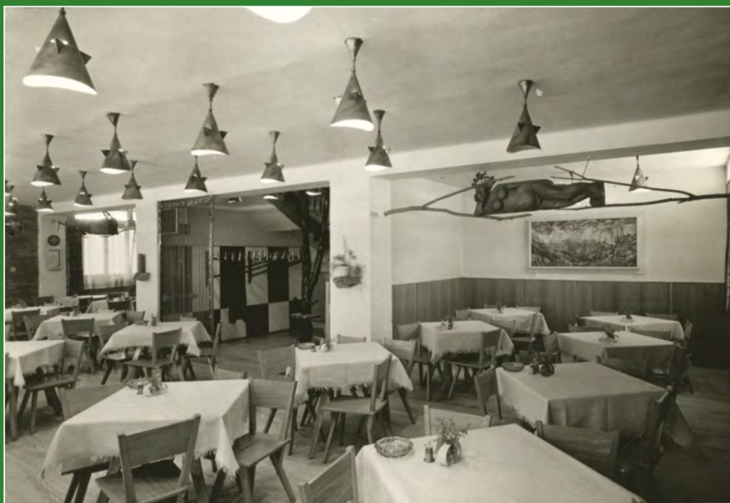
Interiér restaurace na Skřítku na pohlednici Orbisu, 1967.