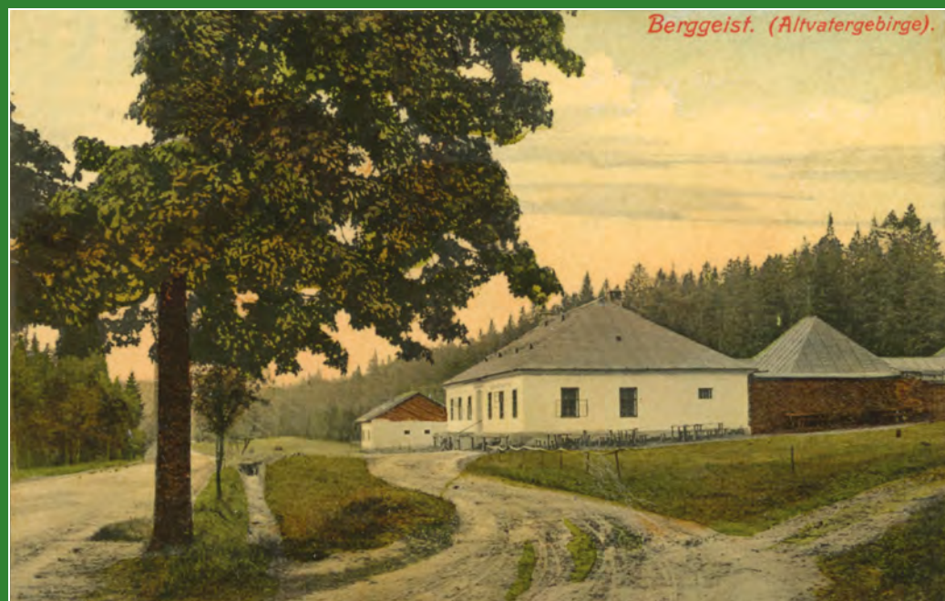
Hostinec Na Skřítku - pohled z roku 1909.

Dnes najdeme na Skřítku chatu, parkoviště, kiosek s udírnou a chatu Horské služby. Z areálu vedou značené cesty do sedmi směrů, nejfrekventovanější je cesta na hlavní hřbet Hrubého Jeseníku.