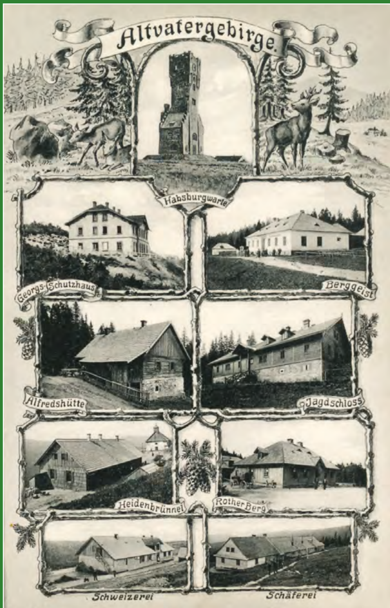
Černobílá montážní pohlednice „Altvatergebirge“ s pohledy na osm horských chat a věž na Pradědu. Vydána kolem roku 1910.