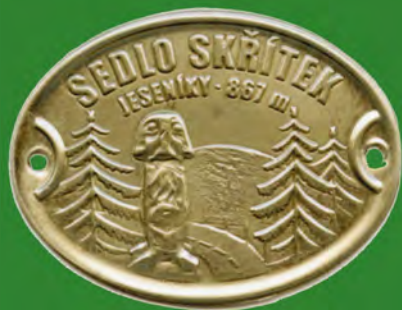
Štítek na turistickou hůl.