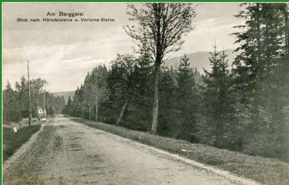
Silnice na Skřítku, v pozadí hostinec. Pohled odeslán po roce 1908.