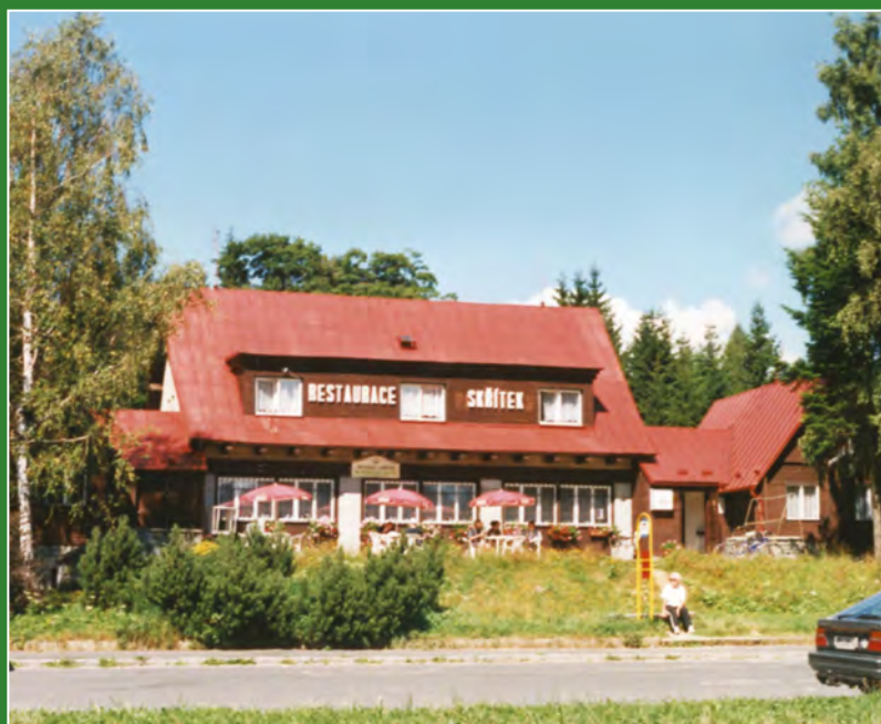
Motorest Skřítek

Nově postavený motorest Na Skřítku s interiéry restaurace. Pohlednice Orbisu z roku 1967.