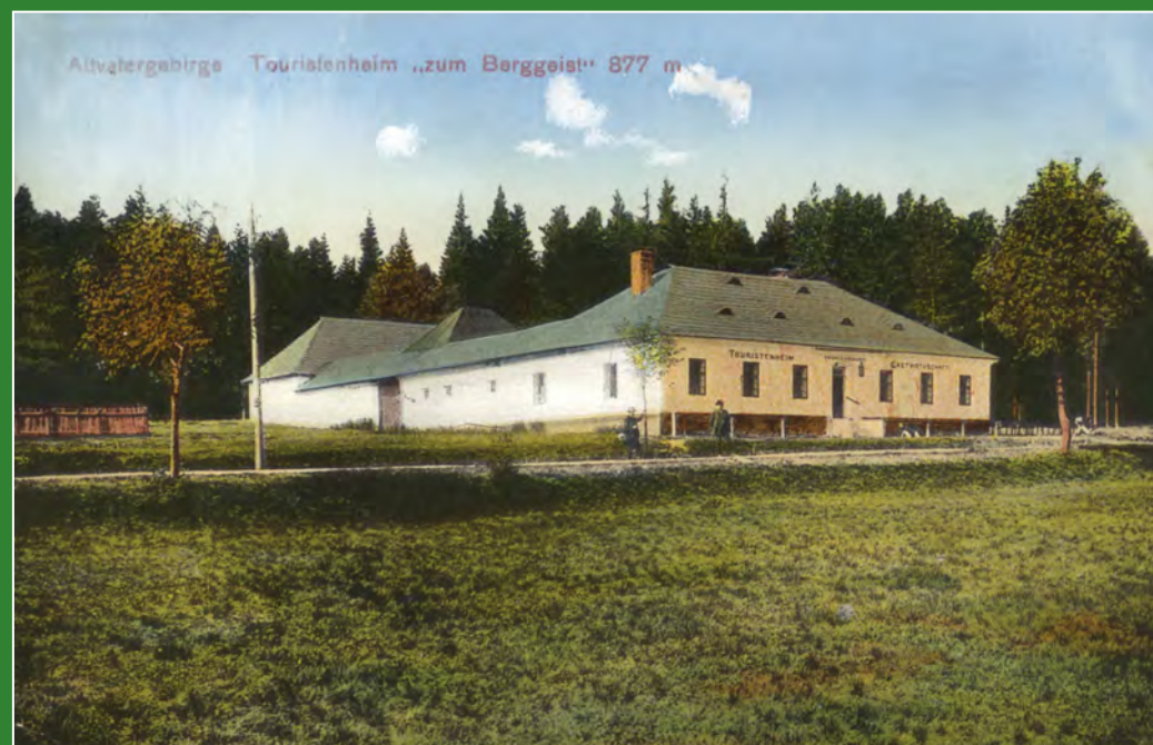
Ubytovací hostinec na Skřítku. Pohled odeslán v srpnu 1911.