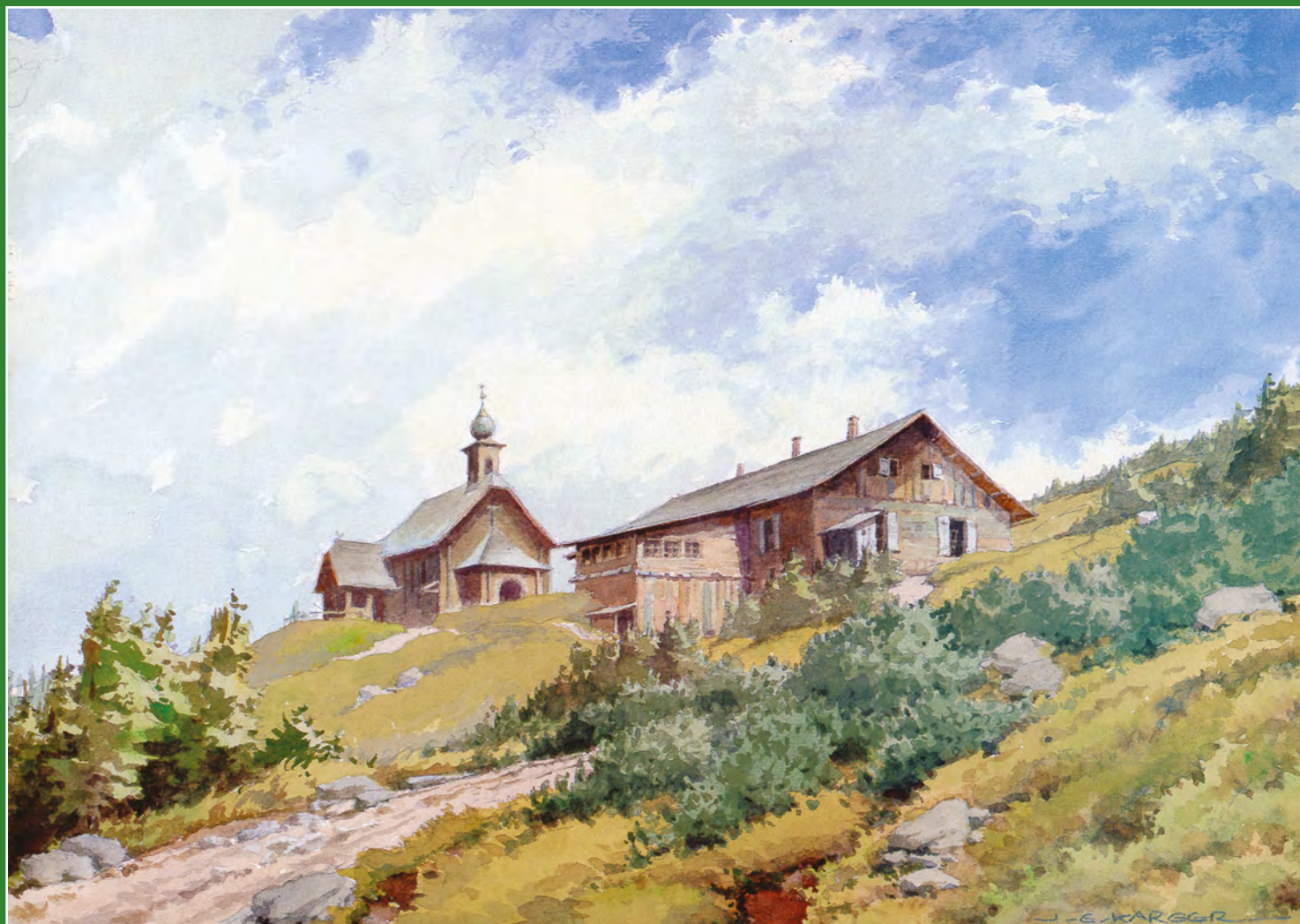
Vřesová Studánka a vpravo Ovčárna s Pradědem na akvarelech J. E. Karger. Stav z třicátých let.

Na první straně vzácná pohlednice zachycující stav všech horských chat v Hrubém Jeseníku pravděpodobně v roce 1896.