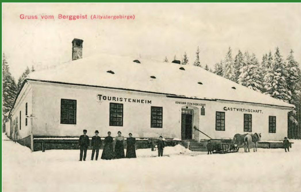
Zimní pozdrav ze Skřítku, odeslaný v únoru 1908.