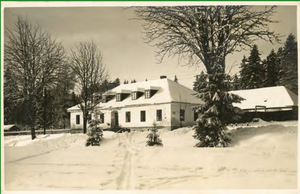
Hostinec Na Skřítku na pohlednici vydané po zaboru Sudet a odeslané v srpnu 1939.