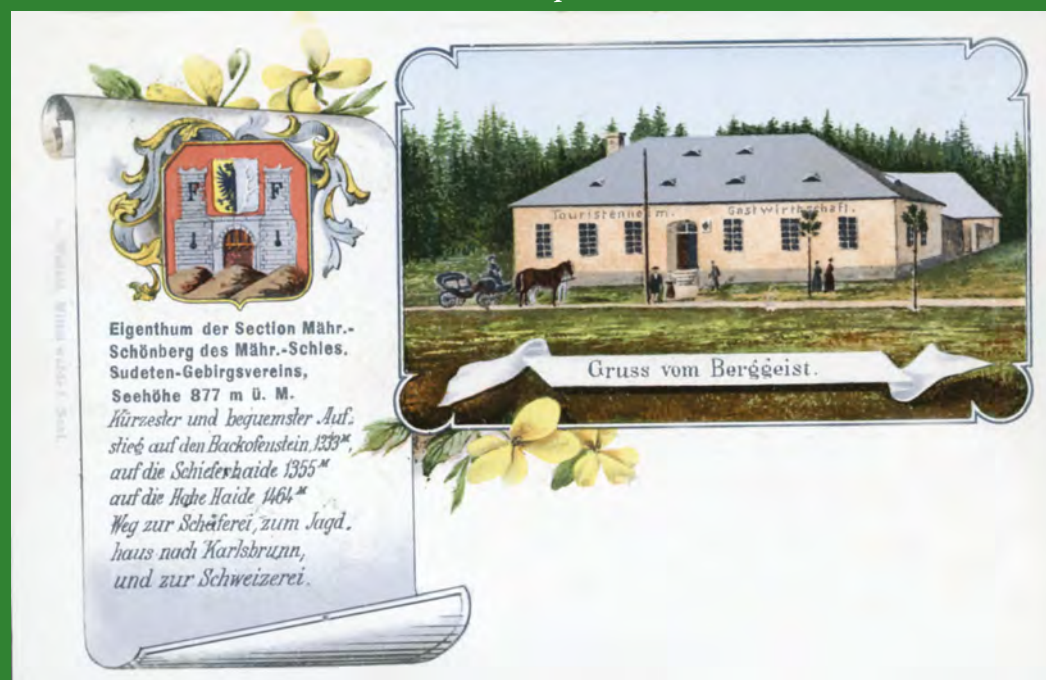
Kreslený pohled na hostinec Na Skřítku se znakem Šumperka, kolem roku 1900.