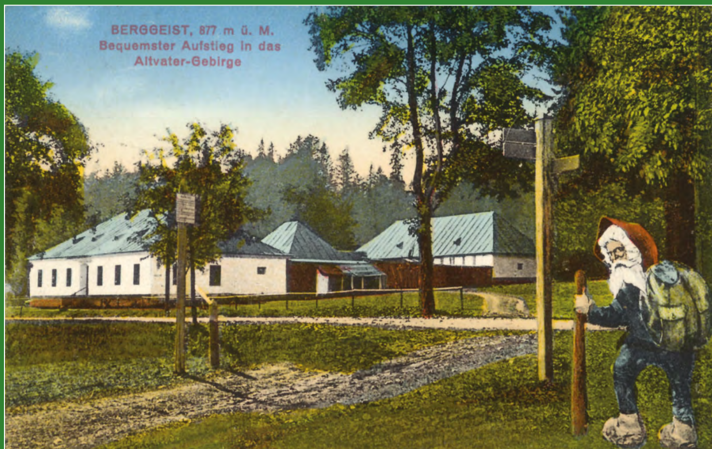
Chata v sedle Na Skřítku s dokresleným skřítkem. Pohled odeslán v roce 1930.

Chata na Skřítku je ve stejnojmenném sedle u silnice I. třídy ze Šumperka do Opavy v nadmořské výšce 870 m. Stojí na místě zájezdního hostince, který v roce 1841 u tehdy nové „šumperské“ silnice nechal postavit majitel vízmberského panství hrabě Mitrovský. Již v té době se hostinec jmenoval „U skřítků“ (Gasthaus zur Berggeist) a to jméno časem přešlo i na samotné sedlo (předtím Fichtling). V roce 1844 se majiteli panství a tím i hostince stali čtyři bratři Kleinové. Více než padesát let tento ubytovací hostinec sloužil svému účelu, tady na vrcholu stoupání byl pro formany obzvláště důležitý. Od šedesátých a sedmdesátých let 19. století začal sloužit i prvním turistům po Jeseníkách. Později