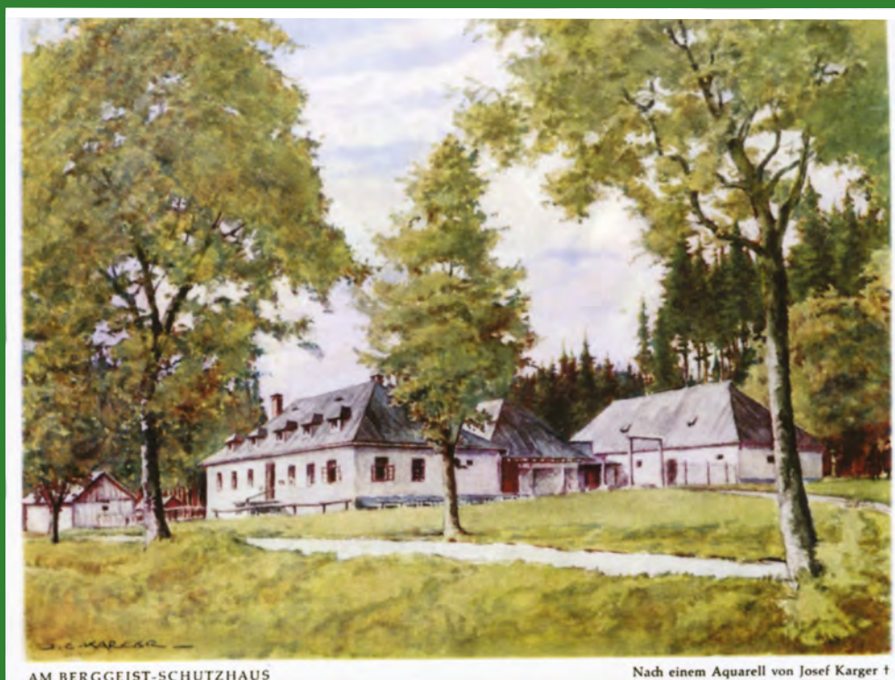
Pohlednice podle akvarelu J. Karger – hostinec Na Skřítku již s podkrovím.