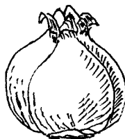
„Cibulohlíza“ Crocus × hybr.

Cibulovité hlízy mají rody jako např. Crocus nebo Gladiolus . Jejich zásobní orgán není diferencován jako u cibulovin (podpučí s pupeny a suknicemi), ale je více členěn než u pravých hlíz, které má třeba sasanka nebo jiřina. Tvarem se však cibulohlízy velmi podobají cibulím a vytváří také „brut“ – dceřiné hlízky (korálky).