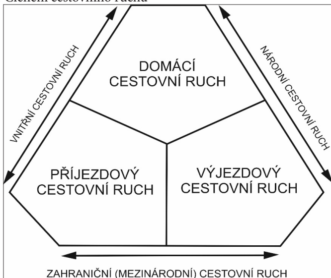
Obr. 1 Členění cestovního ruchu

Z členění uvedeného na obrázku 1 vyplývá další klasifikace cestovního ruchu, která zahrnuje národní cestovní ruch, vnitřní cestovní ruch a mezinárodní cestovní ruch: