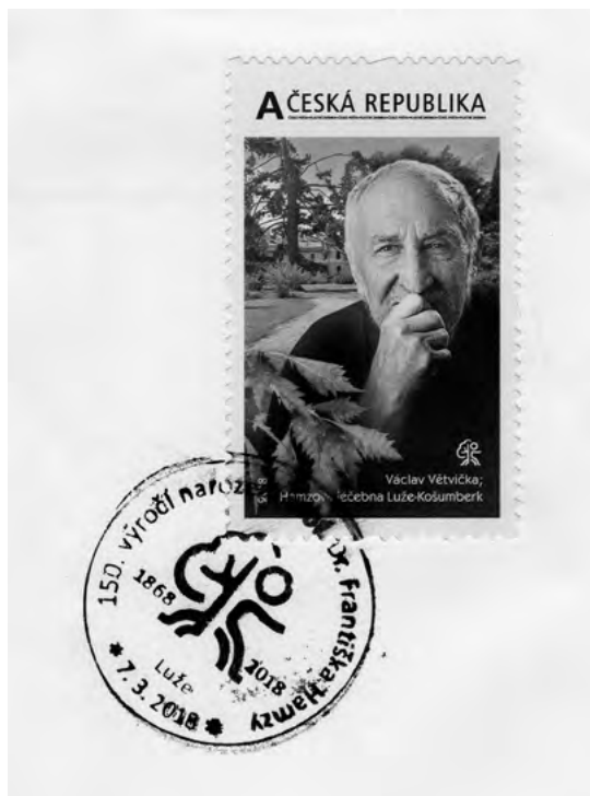
Václav Větvička na poštovní známce