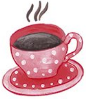
cup of tea/coffee