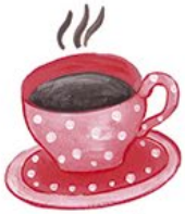
cup of tea/coffee