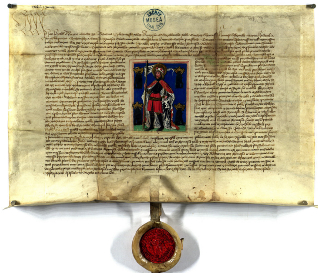
Cechmířtí a starší cech sladovníků Starého Města pražského dávají sladovníckému cechu v Chomutově stejná práva a povolují jim užívat vyobrazení sv. Václava se čtyřmi lopatkami pod zlatými korunkami na cechovní pečeti a korouhvi, 1. 1. 1466. ANM, Sbirka pergamenů A, sign. Perg-A521.

Dějiny Archivu Národního muzea přinášejí celou řadu zajímavých muzejních, archivních i osobních příběhů, které, jak věříme, dokážou zaujmout i „nearchiváře“. Tedy – vítejte v nejstarším veřejném organizovaném archivu u nás...