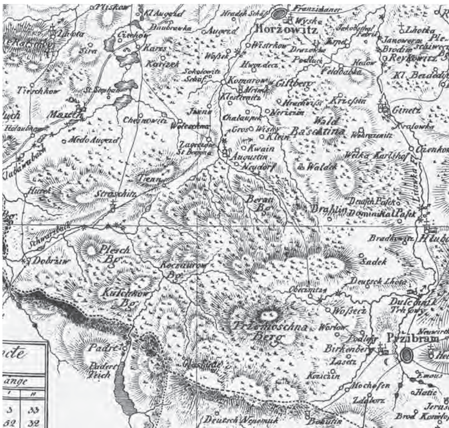
Označení pro střední Brdy jako les Baština (Wald Baschtina) najdeme ještě na Kreybichově mapě Berounského (původně Podbrdského) kraje vydané v Praze roku 1828. (Reprodukovan je výřez z mapy, kolorované mědirytiny)

dvě údolí oběhaná vrchy. Severněji položené je údolí potoka Reserva, jež obkružují hory Hlava, Jordán, Tok a Koruna. Potok tvořící druhou komoru srdce se jmenuje Třítrubecký a podkova výšin tu opět začíná Korunou. Z této velkolepé hory se dále zatáčí na Brdce, Malý Tok, Prahu, Paterák a Kočku. Nedlouho poté, co se obě údolí a oba potoky setkají, vysvitne z tmavé zeleně jas loveckého zámečku Tři Trubky – a ten lze chápat jako hrot našeho iluzorního srdce.