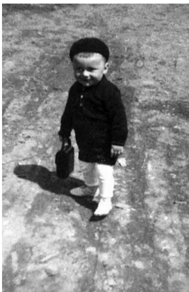
Měl jsem radostné dětství