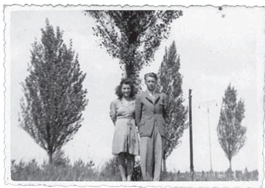
Moje krásná maminka a zamilovaný tatínek