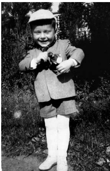
Já a můj bubeníček na klíček