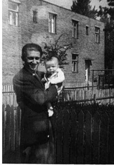
Tatínek mě velice miloval