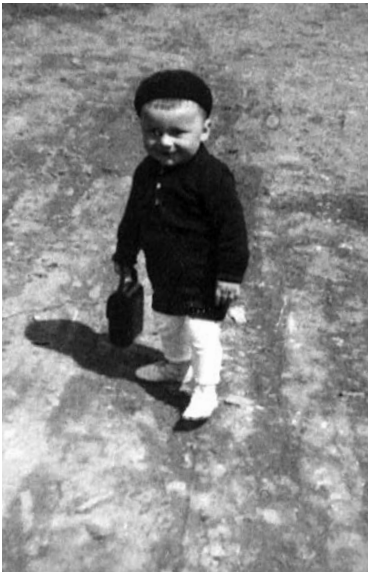
Měl jsem radostné dětství