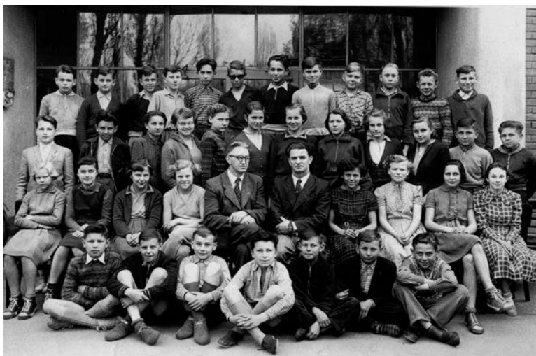
Naše otrokovická základka