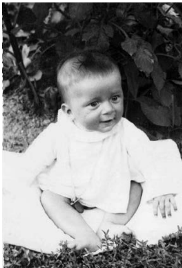
Nejspíš první fotka z mého života