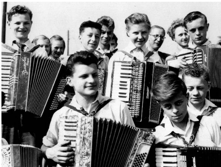
Náš velký harmonikový soubor