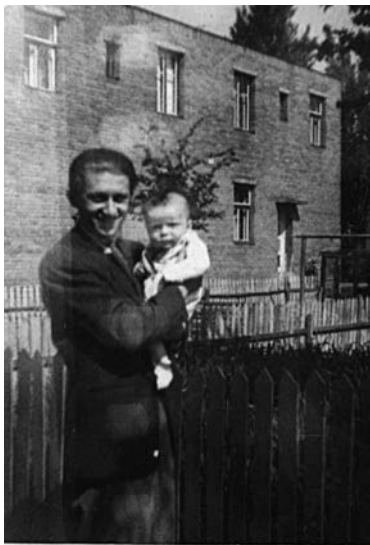
Tatínek mě velice miloval