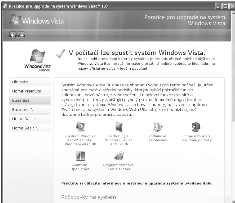
Obr. 1.3 Poradce informuje o možnostech spuštění Windows Vista

Jakmile je kontrola hotova, najdete v okně tlačítko Zobrazit podrobnosti . Když je stisknete, vzápětí se dočtete, zda vůbec lze na vašem počítači Windows Vista spustit, a pokud ano, jaká verze Windows Vista je pro váš počítač vhodná, čímž se rozumí verze, která na vašem