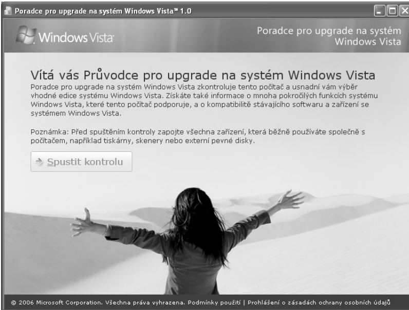
Obr. 1.2 Okno Průvodce pro upgrade na systém Windows Vista

Jakmile je kontrola hotova, najdete v okně tlačítko Zobrazit podrobnosti . Když je stisknete, vzápětí se dočtete, zda vůbec lze na vašem počítači Windows Vista spustit, a pokud ano, jaká verze Windows Vista je pro váš počítač vhodná, čímž se rozumí verze, která na vašem