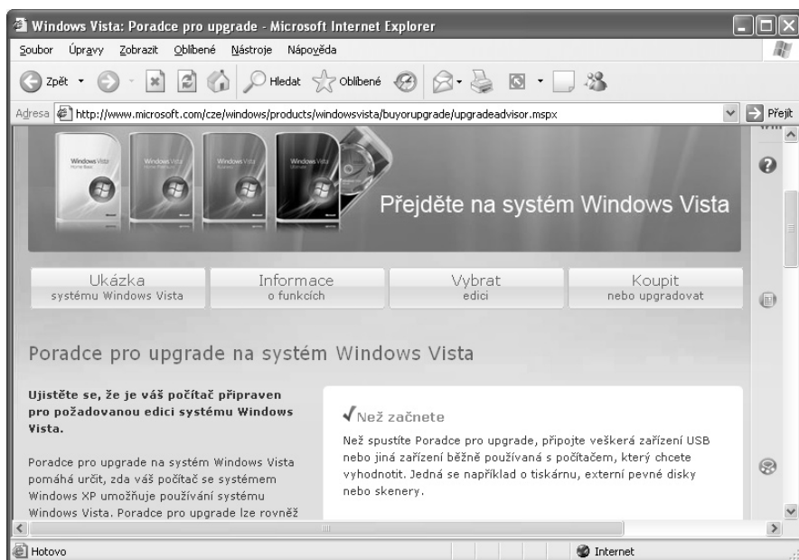
Obr. 1.1: Webová stránka Microsoftu s poradcem pro upgrade

Poradce najdete na internetové stránce společnosti Microsoft. Srovnějte s obrázkem 1.1.