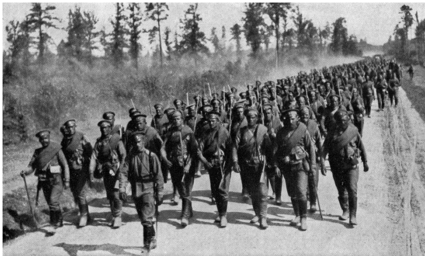
Ruská pěchota pochoduje na frontu