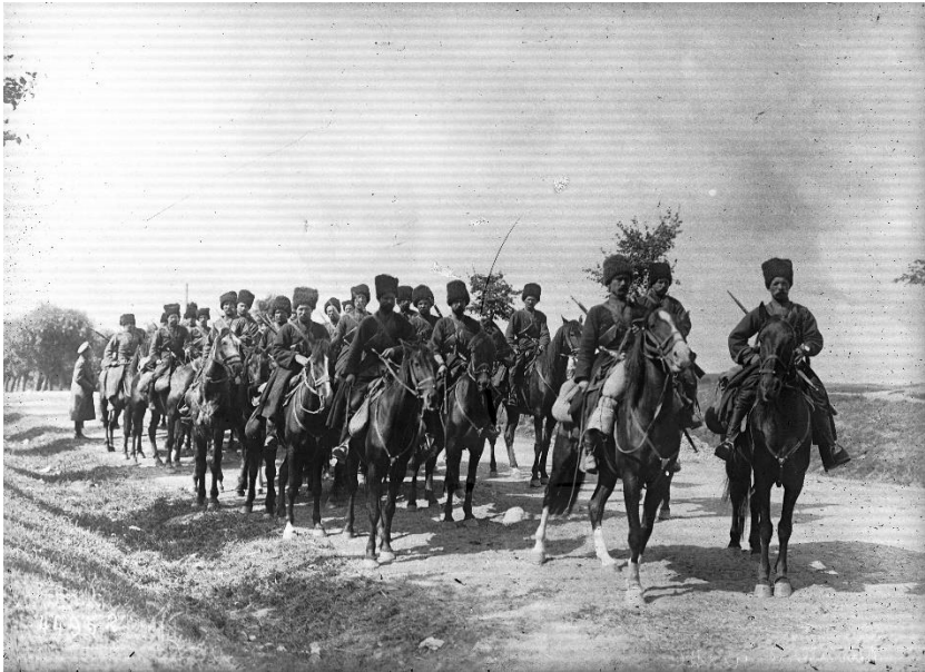
Kozácká jízda na začátku války