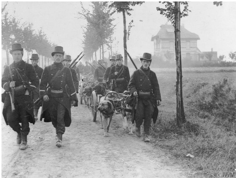
Belgické kulomety tažené psím spřežením