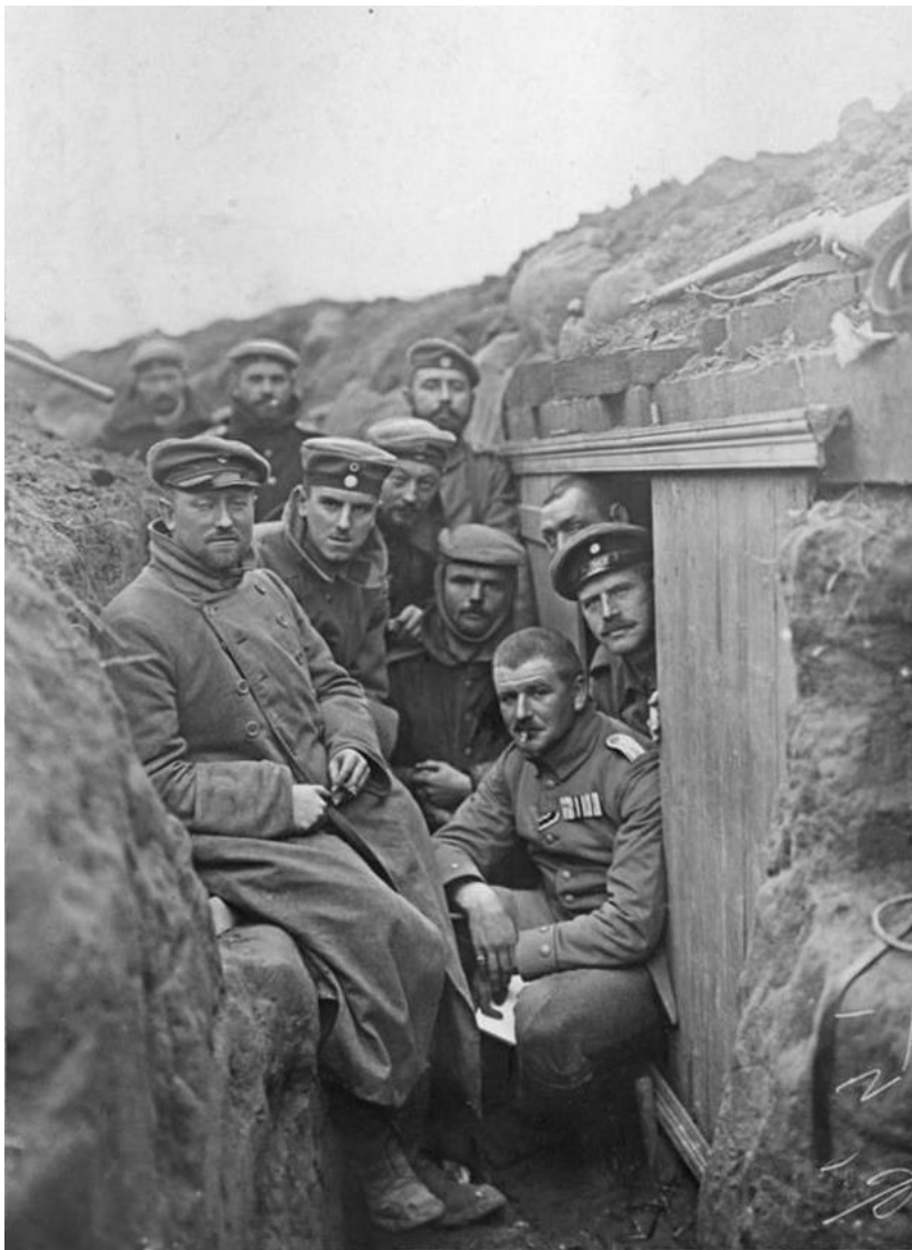
Němci pózuji v zákopech během bitvy u Yper