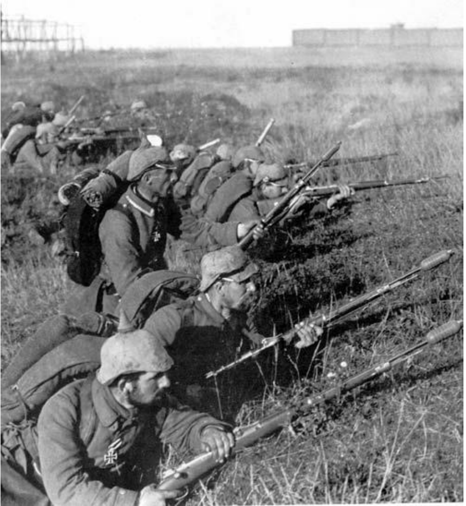
Německá pěchota během první bitvy na Marně