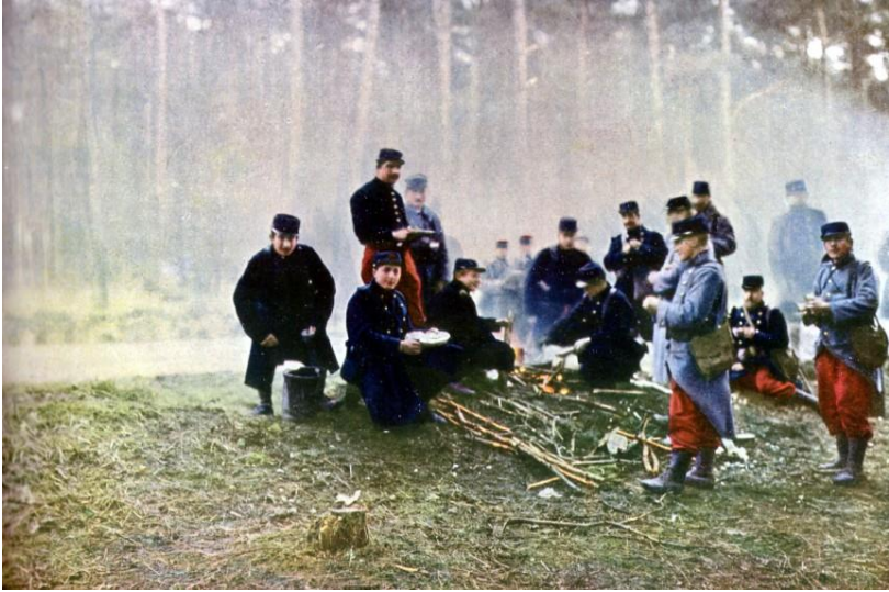
Vojáci Francie narukovali do války v zastaralých barevných uniformách