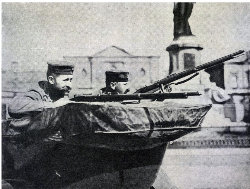
Němečtí vojáci během bojů o pevnost Liège