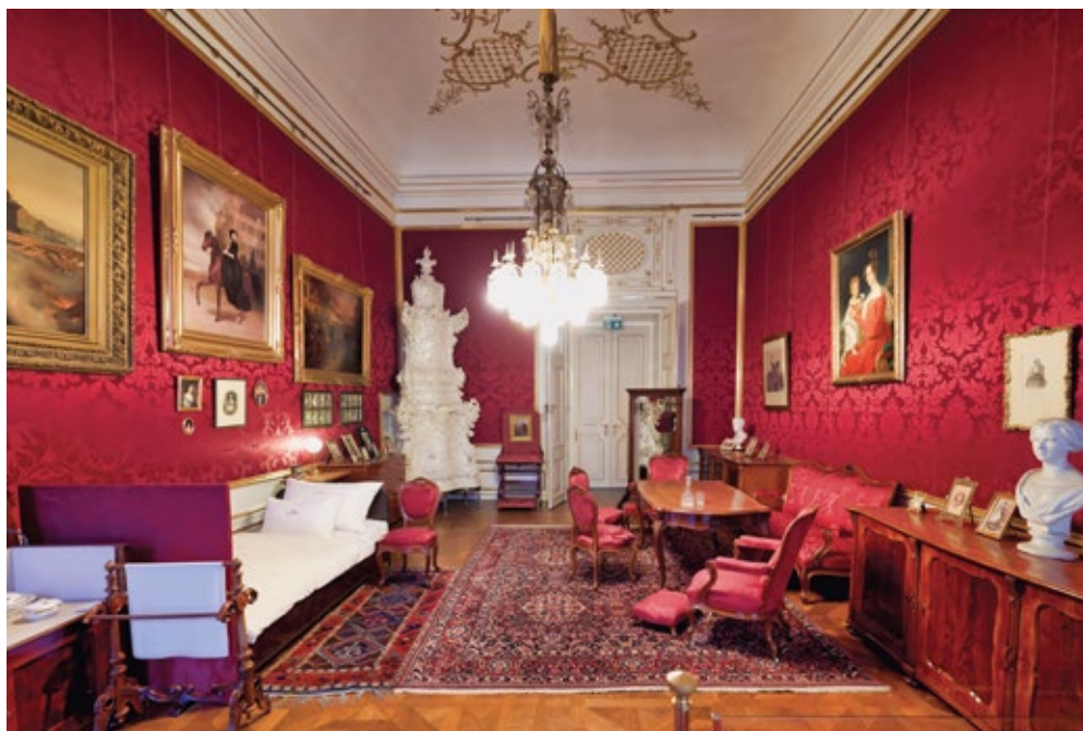
Ložnici Františka Josefa v Hofburgu zdobí obraz Sisi na koni.

fotografie mocnářova apartmánu. Poté dílo zdědila nejmladší dcera císařského páru Marie Valerie a v majetku jejich potomků se portrét nacházel po mnoho desetiletí, než byl prodán. Jména dalších majitelů zůstala v anonymitě. Velký rozruch ale vzbudila aukce pořádaná vídeňskou aukční síní Dorotheum 27. dubna 2017: na ní byl tento obraz telefonicky vydražen za neuvěřitelnou částku 1 540 000 € a přešel do vlastnictví jistého rakouského sběratele. V císařských apartmánech v Hofburgu visí kopie tohoto plátna. Fotografie originálu obrazu najdou čtenářky a čtenáři na obálce této knihy.