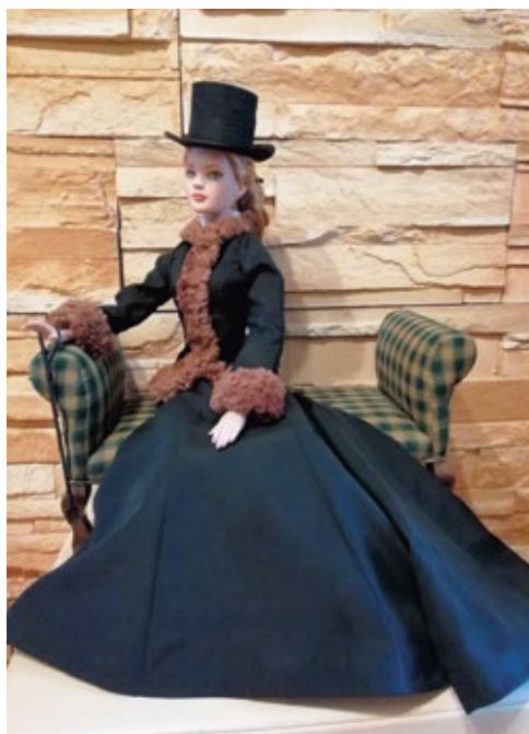
Replika Alžbětina loveckého kostýmu.

Pot si Alžběta během honů otírala papírovými kapesníčky nebo ubrousky, které si nechávala dovážet z Japonska. Tyto hygienické potřeby vzbuzovaly velkou senzaci; v její době se používaly kapesníky pouze látkové. Na sedle měla Sisi připevněné pouzdro na vějíř, který vyndávala při každé zastávce, aby si chránila oči a pleť před sluncem a tvář před zraky zvědavců. A možná také z jiné příčiny: aby zakrývala údajně nepěkné zuby. V prstech svírala bičík vykládaný slonovinou a drahokamy, zdobený obvykle portrétem císaře. Drahocenné bičíky často darovala svým jezdeckým společníkům přímo ze sedla; třeba z vděčnosti za projevenou laskavost. Několik takových bičků se zachovalo v majetku rodin obdarováných. Jiné byly vydraženy v aukcích za astronomické ceny. Jeden