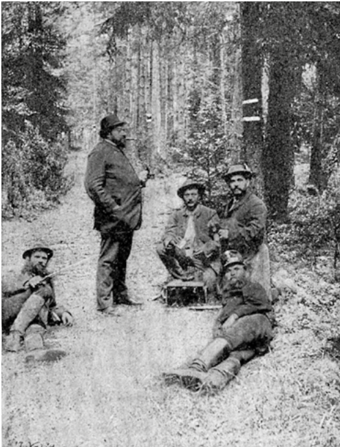
První označovací družstvo, Svatojánské proudy, 1899

Bylo rozhodnuto, že věž bude vztyčena na vrcholu Petřína a zdůvodnění znělo: „Položen téměř uprostřed samého města, poskytuje již nyní rozkošný pohled na ně. Rozhlednou poněkud jen vyšší rozšířil by se však nejen pohled na město samotné a veškeré jeho části nejvýš položené, nýbrž i netušený pohled po celé zemi až k dálným horám pohraničným.“