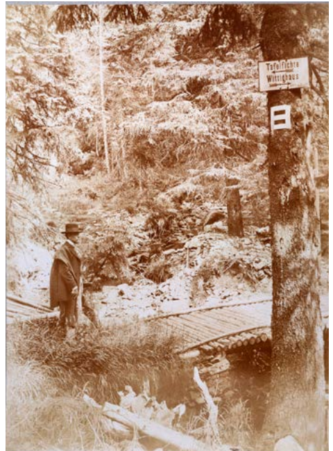
Cestou k vrcholu Tafelfichte (dnes Smrk), Jizerské hory, 1908