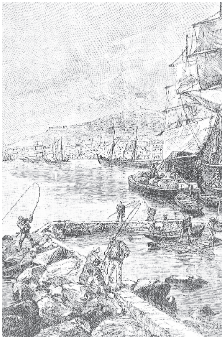
Na severu se rýsuje v podobě trojúhelníku nové nábřeží, do kterého ústí průplav.