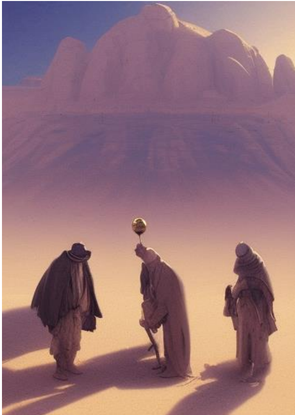
Ztraceni v poušti s magickou koulí...

poslat je na takovou misi, ale co mohl dělat, když mu to ten hlas poručil? Starší bratři byli v pořádku, ale nejmladší z nich jménem Nefi, byl ve špatném stavu, celý od krve a blouznil. Když spatřil Lehiho, zastavil se a vztáhl k němu ruku. „Otče, dokázal jsem to,” řekl vysíleně. „Splnil jsem, cos mi přikázal. Mám ty desky...”. A s těmi slovy odpadl.