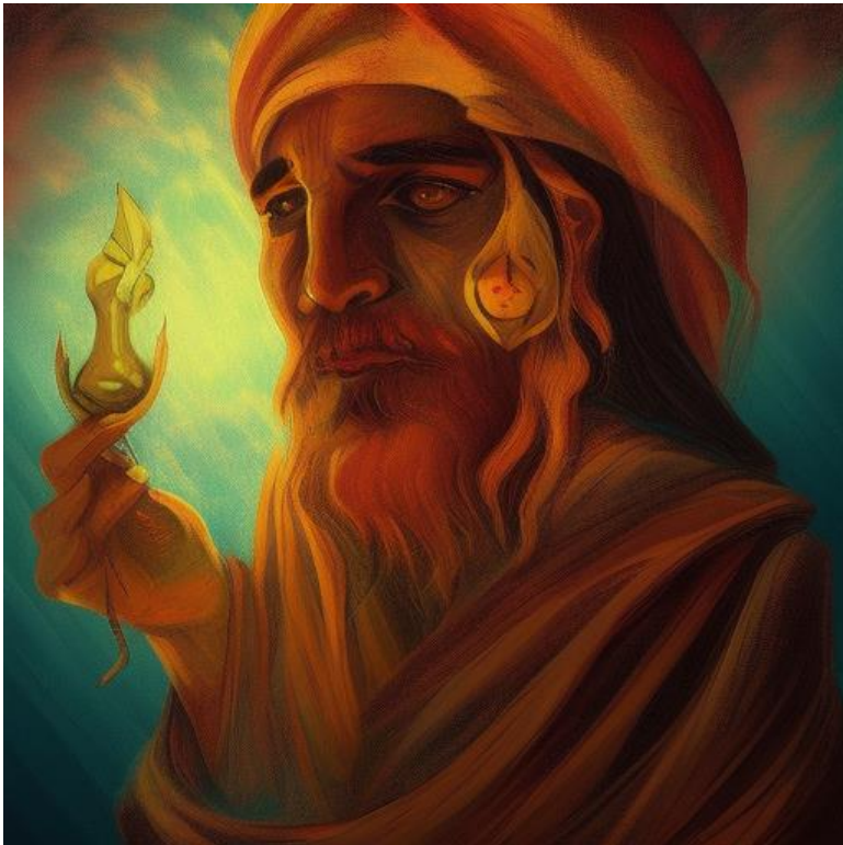
Prorok Lehi nese světlo do dále...

Když se Lehimu opět vrátil zrak, zjistil, že leží na zemi, a je stále hluboká noc. Rozhlédl se okolo sebe, ale sloup ohně i obrazy byly pryč, a ulicemi Jeruzaléma se touto dobou toulali jen ožralí lidé a vyhladovělí psi. Bez dalšího rozmyšlení se zvedl a utíkal domů, aby se o svůj zážitek podělil s rodinou.