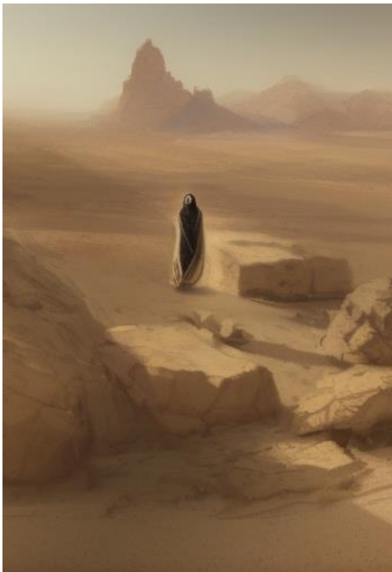
Záhadný duch v píscích...