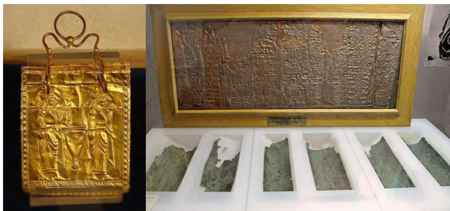
Zlatá orfická kniha z doby okolo roku 600 př.n.l. a bronzový svitek, datovaný do prvního století n.l. Obojí nalezené až ve dvacátém století, z toho bronzový svitek v Kumránu...