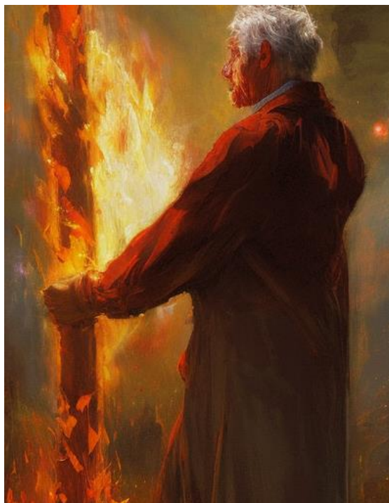
Zjevení, které vedlo k nalezení Pavlovy apokalypsy...

text (dnes jsou v Etruském muzeu v Římě). Narazil jsem postupně na kovové desky z celého starého kontinentu (až po Indii a Čínu), které zachycovaly různé náboženské i historické texty. Lidé nejspíš vnímali, že pergamen, papyrus i dřevěné desky (na které psali třeba pohané z keltského a slovanského prostředí) mohou být zničeny ohněm, a hliněné desky se snadno rozbijí. Pokud chtěl někdo svou zprávu zachovat na dlouhou dobu, musel ji napsat na trvanlivý materiál (například kov), nebo ji skrýt v trvanlivém obalu do země (jako v případě apokryfů z Nag Hammadí a Pavlovy apokalypsy).