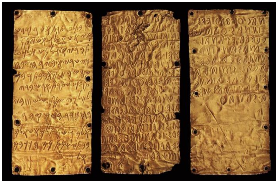
Pyrgiho desky, neboli zlaté etruské desky z doby okolo 6.století př.n.l. (doba Lehiho)...