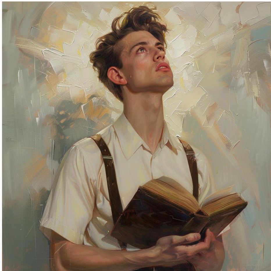
Chlapec a jeho zjevení