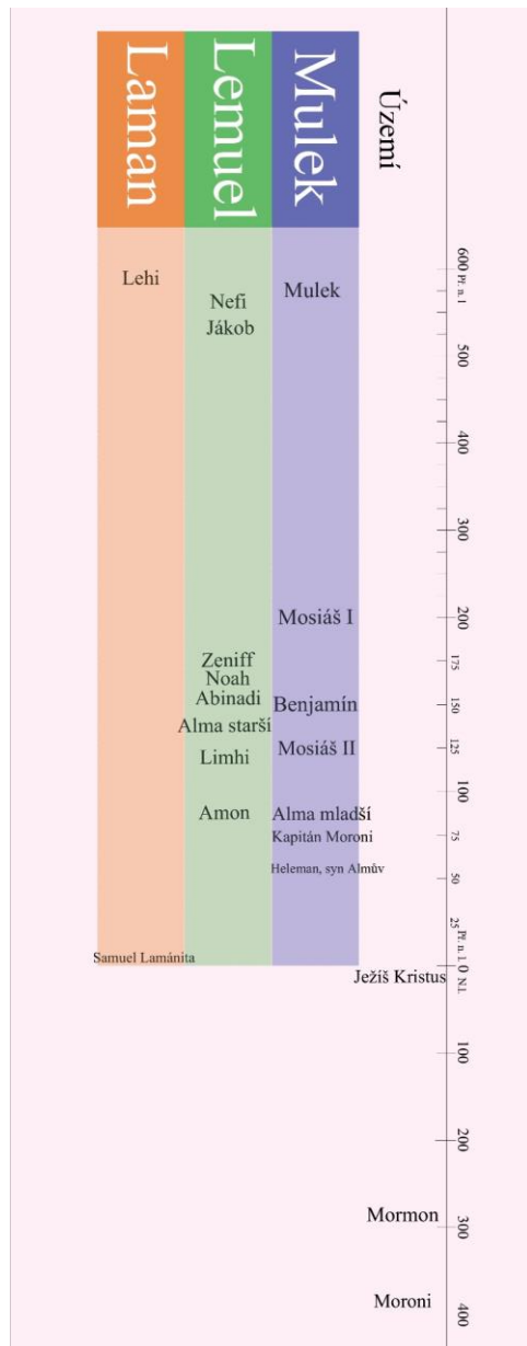
Základní přehled fiktivních dějin Knihy Mormonovy