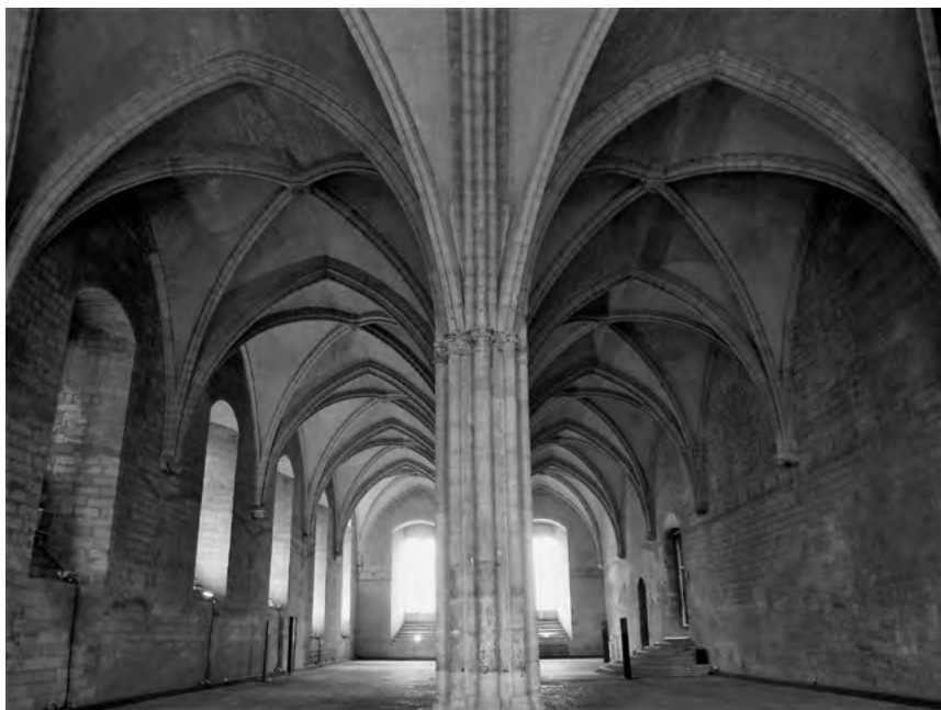
4. Sál papežského soudního dvora (audiencie) v tzv. Novém papežském paláci v Avignonu. Klenbu rozsáhlé prostory podpírá pět pilířů.