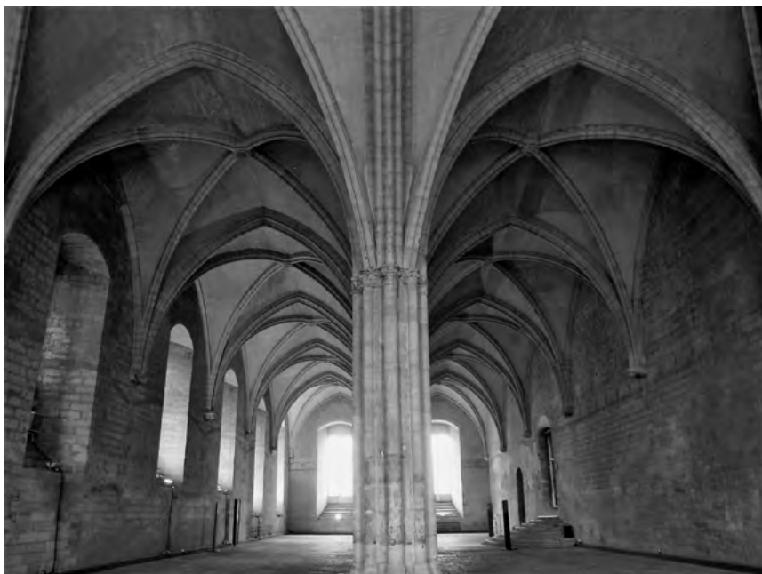
4. Sál papežského soudního dvora (audiencie) v tzv. Novém papežském paláci v Avignonu. Klenbu rozsáhlé prostory podpírá pět pilířů.

Je evidentní, že se při všech dokladech o počátcích Jana Očka setkáváme s projevy přízně a vlivu Karla IV., který se po plném oslepnutí svého otce (po nezdařeném léčení oka v Montpellier v březnu 1340) ujal vlády. A s masivním uplatněním markraběte Karla na evropské politické scéně souvisela i celá supplika pro Jana Janova, resp. příprava jeho budoucnosti. Suplika byla schválena 20. dubna 1344 a 30. dubna t.r. byla vydána bula o zřízení arcibiskupství v Praze. Jan Očko, či dosud Jan Janův, se bezpochyby těchto jednání u kurie zúčastnil jako člen většího českého poselstva, jež jednalo o vzniku arcibiskupství a dalších zásadních záležitostech. Není vyloučeno, že si při svém prvním pobytu u kurie teprve plně uvědomil souvislosti a důsledky možné formálně právní závady svého původu. S ohledem na svůj vztah k panovníkovi a možná už i na očekávanou budoucnost se proto snažil vše právně urovnat.