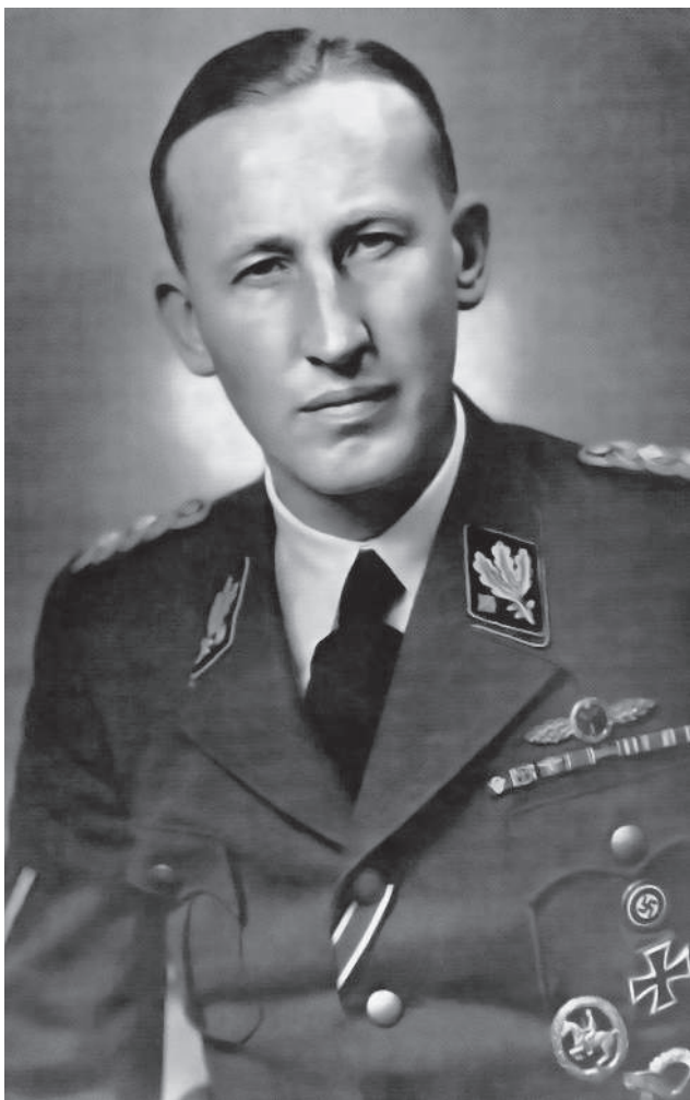
Portrétní snímek osmatřicetiletého Heydricha, 1942.