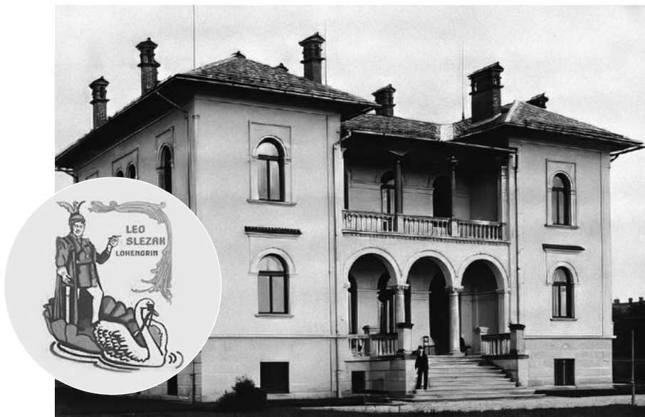
Obr. 3: Vila Doris – Leo Slezak jako Lohengrin s labutí na pamětní desce u vchodu do Vily Doris, dnes Střediska volného času a zařízení pro další vzdělávání pedagogických pracovníků

Volební heslo na jednom ze vstupních oblouků kulturního centra nazvaného Německý spolkový dům, otevřeného v roce 1902, zní: