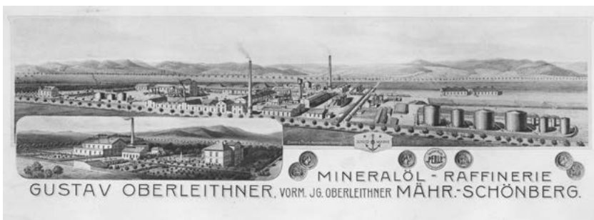
Obr. 7: Šumperská rafinerie ropy