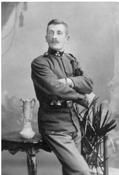
Obr. 5: Dědeček se na srbské frontě jako železničář stará o železniční dodávky

Čtu tedy deníky, zápisky o dějinách jednotlivých pluků, vojenské zprávy, vzpomínky vyšších důstojníků a generálů i ručně psané zápisky obyčejných vojáků, studuji předpisy německé pěchoty. Zpovídám přeživší a jejich rodinné příslušníky. Válka zuří na mém pracovním stole a později v rozhlasovém studiu.