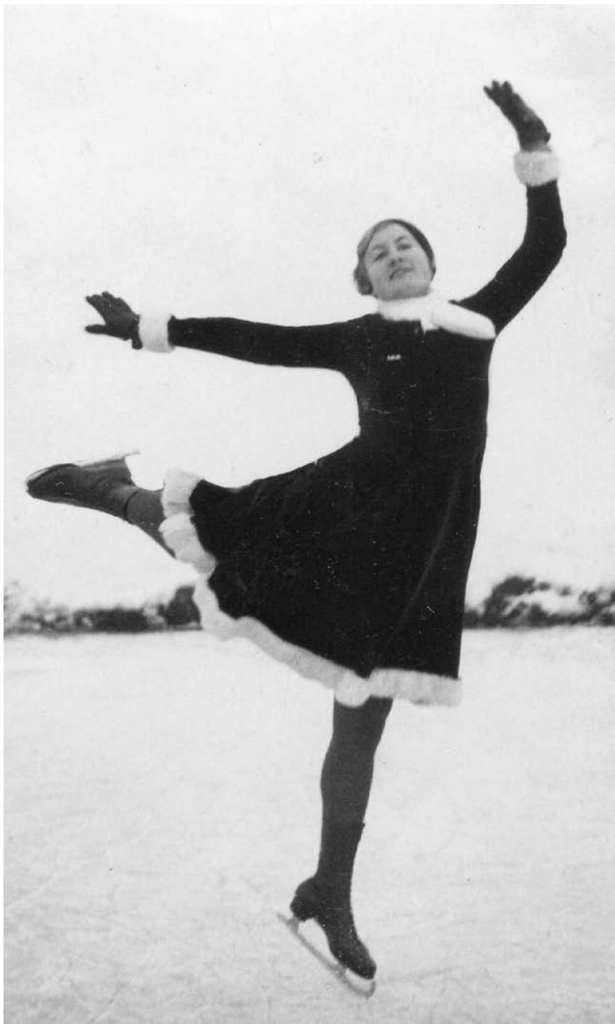
Obr. 1: Matka na ledě