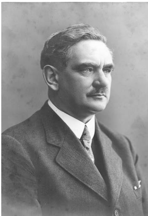
Obr. 6: Gustav Oberleithner (1871–1945)