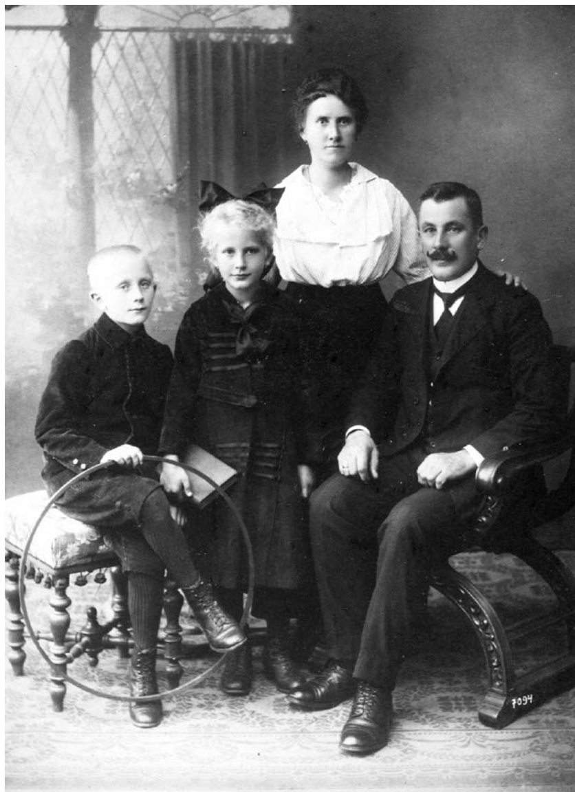
Obr. 8: Císař prohrál válku. Dědeček, už v civilu, se nechá v Olomouci vyfotografovat se svojí ženou a dětmi Grétkou a Hansem