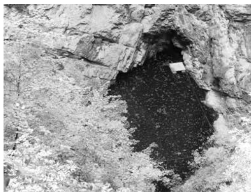
Hranické jezírko v současnosti