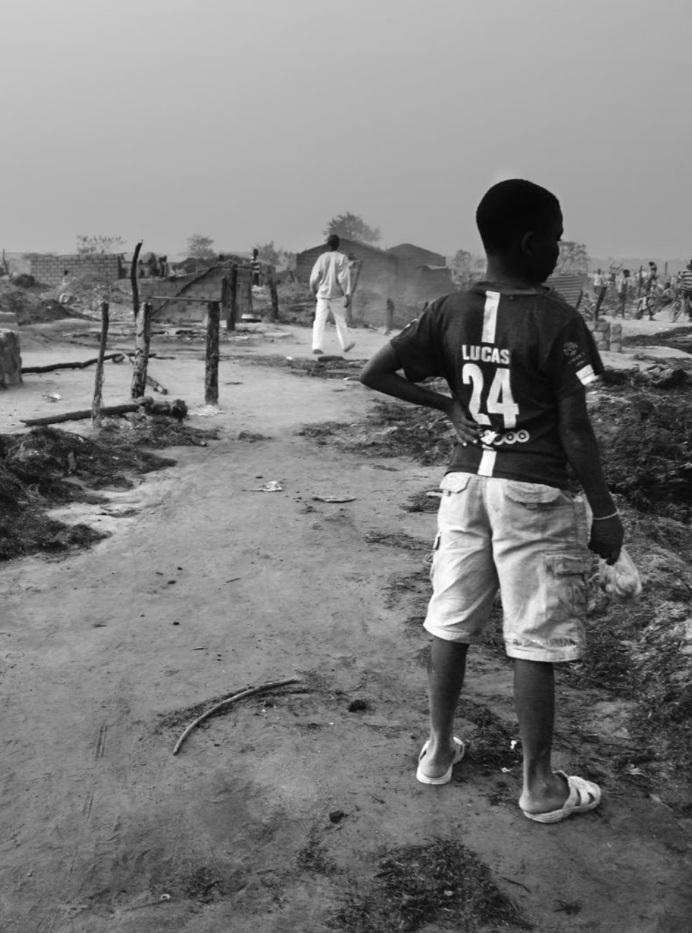
Požár v táboře Kaga-Bandoro vzal domovy desítkám rodin.