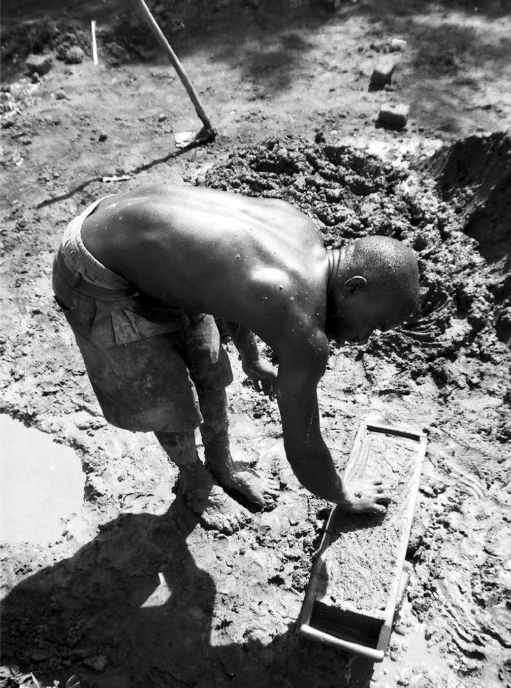
Bývalý dětský voják vyrábí cihly ve válkou zničené severní Ugandě.