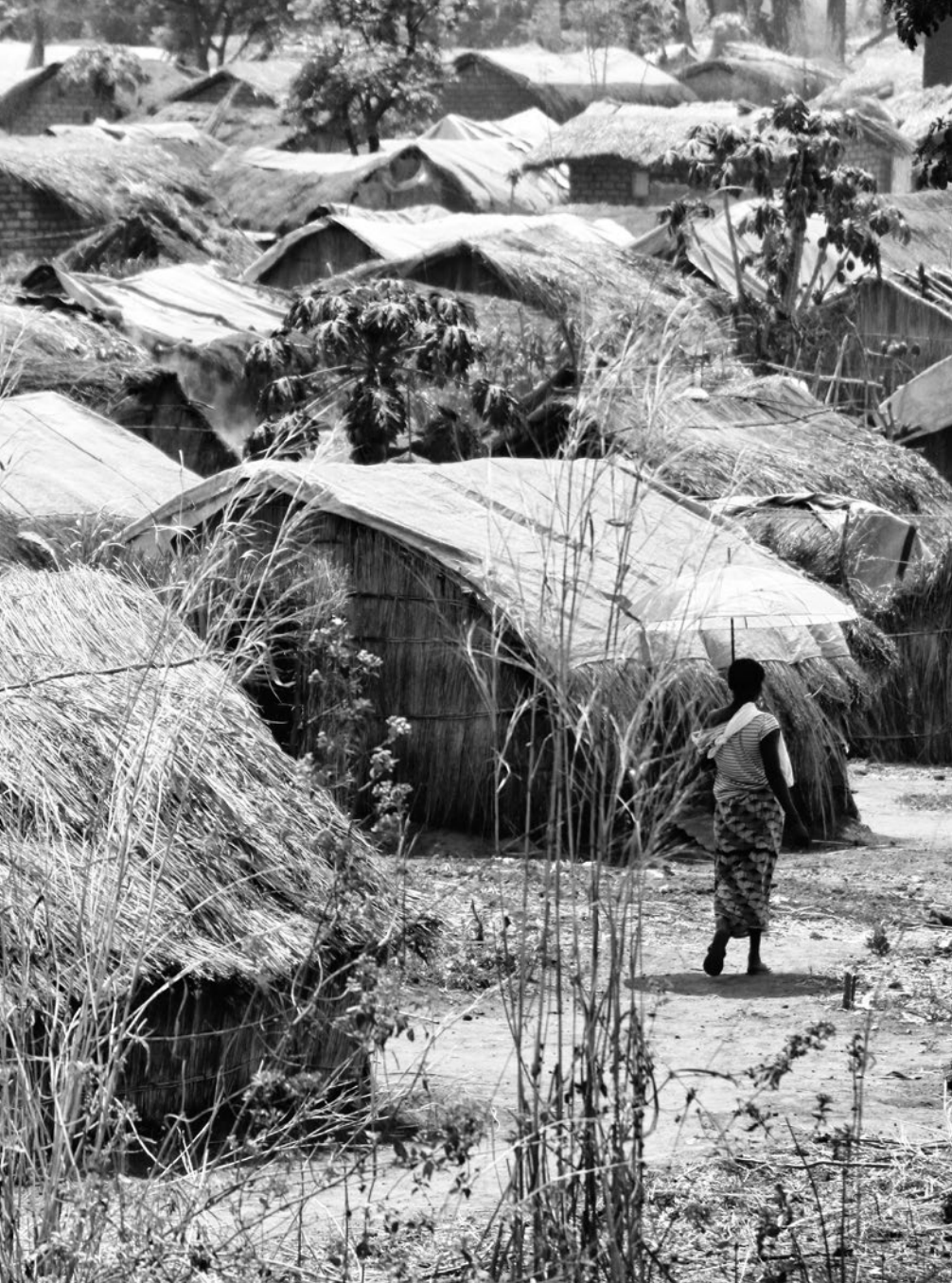
Uprchlický tábor v Kaga-Bandoro.