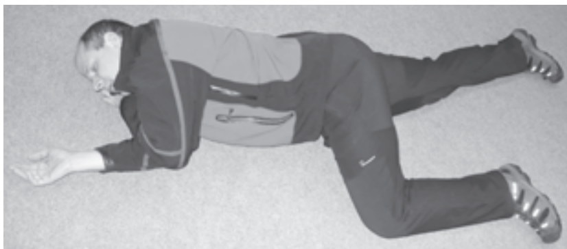
Obr. 1 Stabilizovaná poloha na boku se záklonem hlavy