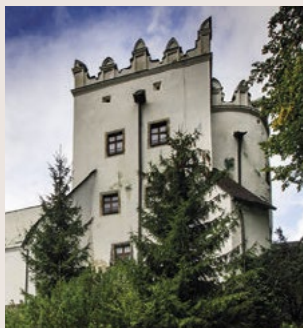
▲ Kaštieľ Strážky

❓ Ako sa tam dostanete: K hradu sú dva možné prístupy – buď smerom od obce Spišské Podhradie cestou cez Dolný hrad, alebo zo severu po odbočke z hlavnej cesty medzi Prešovom a Levočou. V oboch prípadoch vás, samozrejme, neminie výstup do kopca. ■