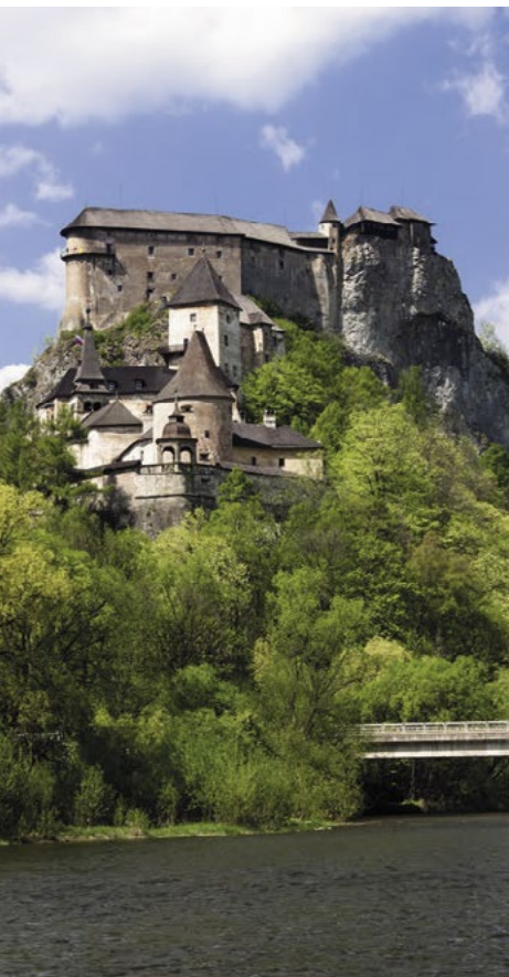
▲ Oravský hrad, prvýkrát zmienený v roku 1267, kedysi strážil cestu do Poľska.