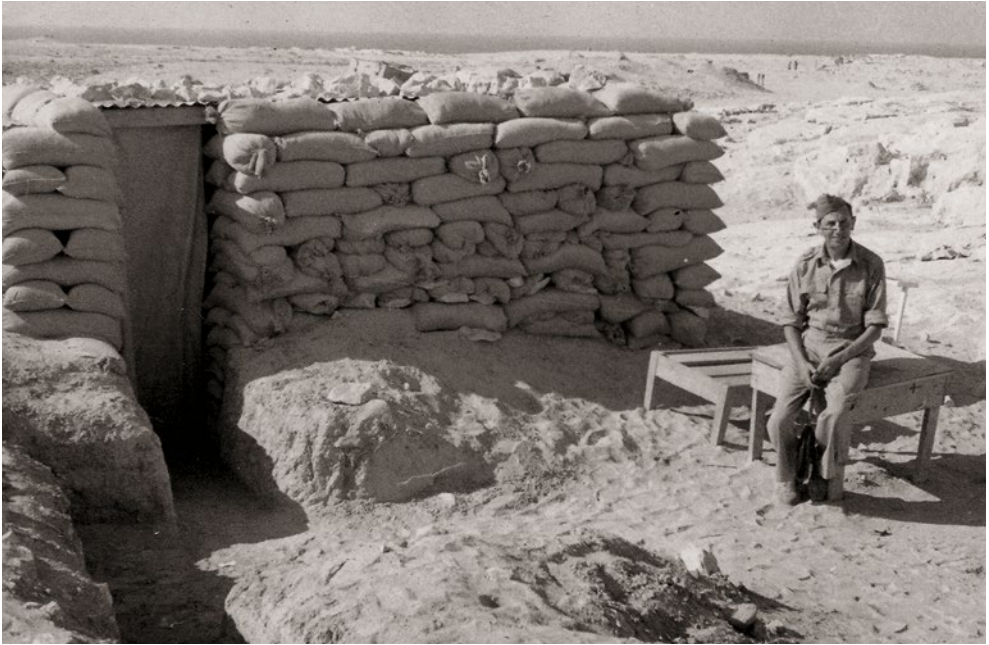
Leopold Firt před ošetřovnou, chráněnou před ostřelováním pytlí s pískem.

Firt, pohledem se rozloučí a mávaje vlajkou vykročí z velitelství na sluncem rozpálený písek.