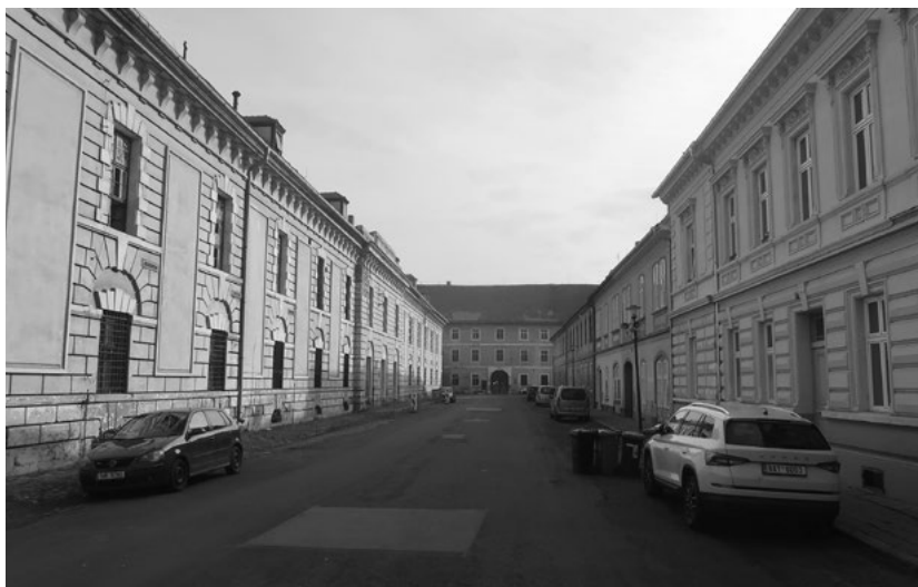
Pohled do ulice někdejšího terezínského židovského ghetta, kde nalevo je vidět část tzv. Podmokelských kasáren a vzadu pak část tzv. Drážďanských kasáren – zde na půdě žila Inge Auerbacher s rodiči.