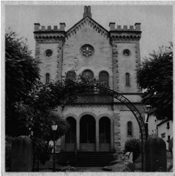
Synagoga v Kippenheimu před zničením

Od oněch událostí již uplynulo mnoho let. Přesto mě někdy specifické věci jako uniforma, vysoké černé holínky nebo zvuk sirény či vlaku vtáhnou do minulosti. Během dovolené v kanadském Quebecu mi pohled na staré opevnění přinesl záplavu vzpomínek. Vysoké zdi z červených cihel se na mě úplně hroutily. Měla jsem strach. Připadala jsem si, že jsem zpět v Československu. Včerejšek se stal dneškem. Už to nebyl Quebec; stal se Terezínem. Vrátila jsem se do doby, kdy má noční můra začala.