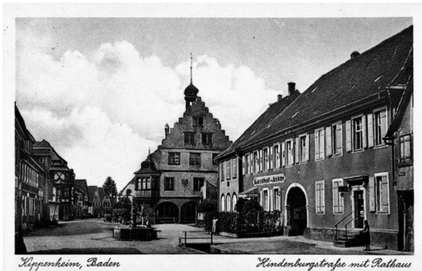
Moje rodné město – Kippenheim