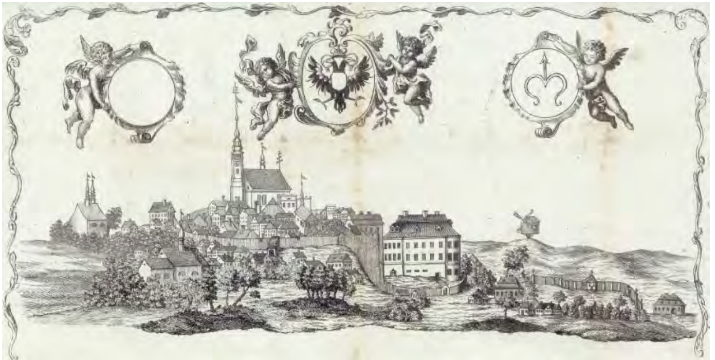
Bílovec před 1808, pohled od JZ (znaky rakouské monarchie a Bílovce), cech. list, anonym, mědiryt, 35,5 × 16,5, SOKA Liberec, fond Cech soukeníků Liberec, i. č. 58, kart. 9