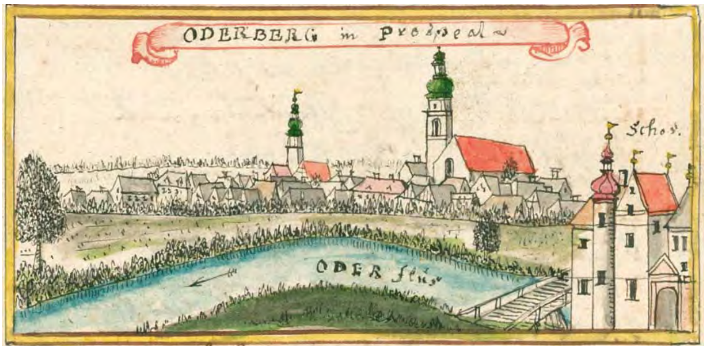
Bohumín 1762–1768, pohled od Z (na Starý Bohumín , ODERBERG in prospect), F. B. Werner, kolor. kresba, 17 × 8,5, soubor TopSl, volné dílo, archiv autora