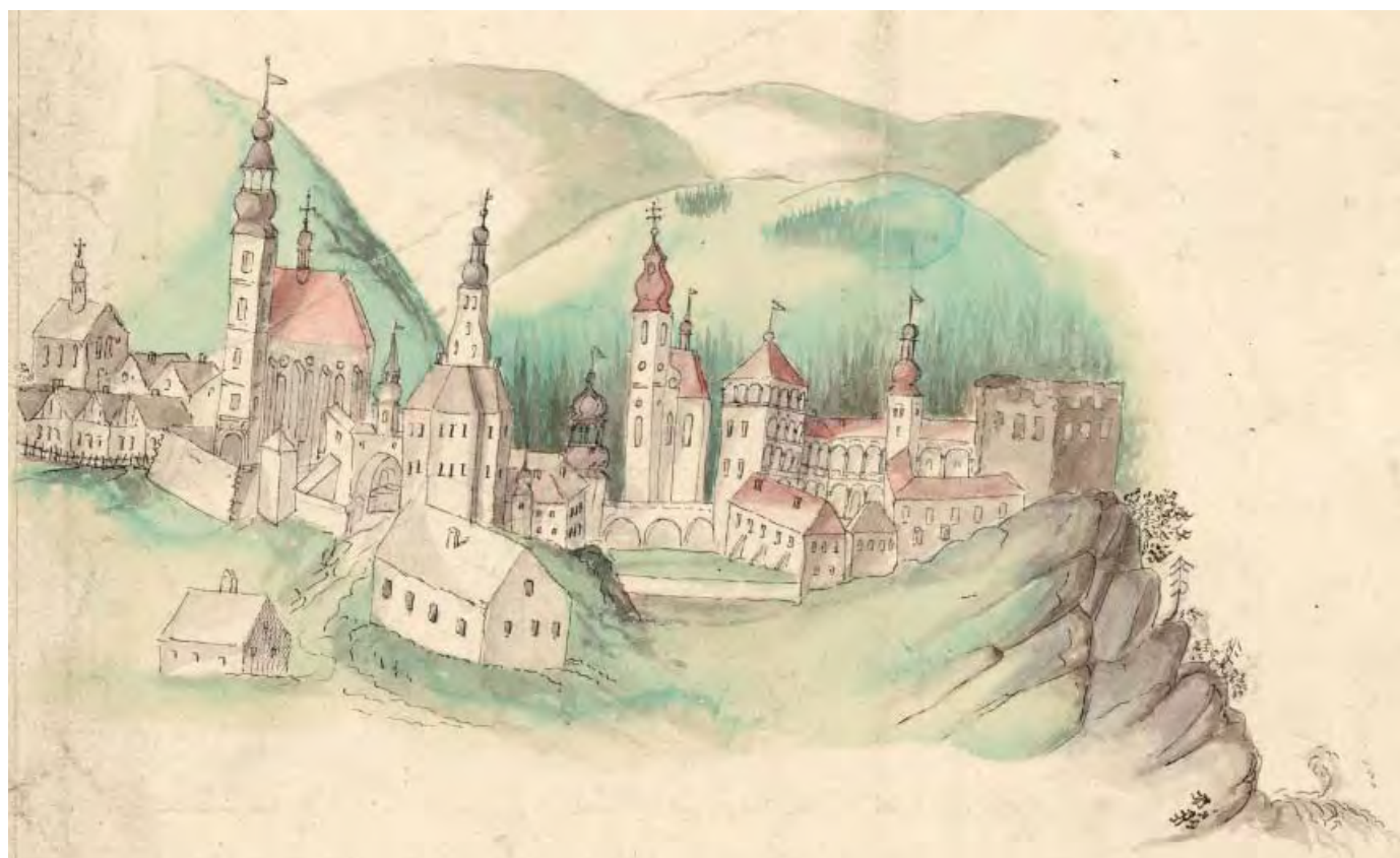
Branná (Kolštejn) 1817, pohled od JZ, parerga na mapě panství, F.V.Horký, kolor. mědiryt, asi 20 × 15, MZK Brno, s.STMpa-1208.966