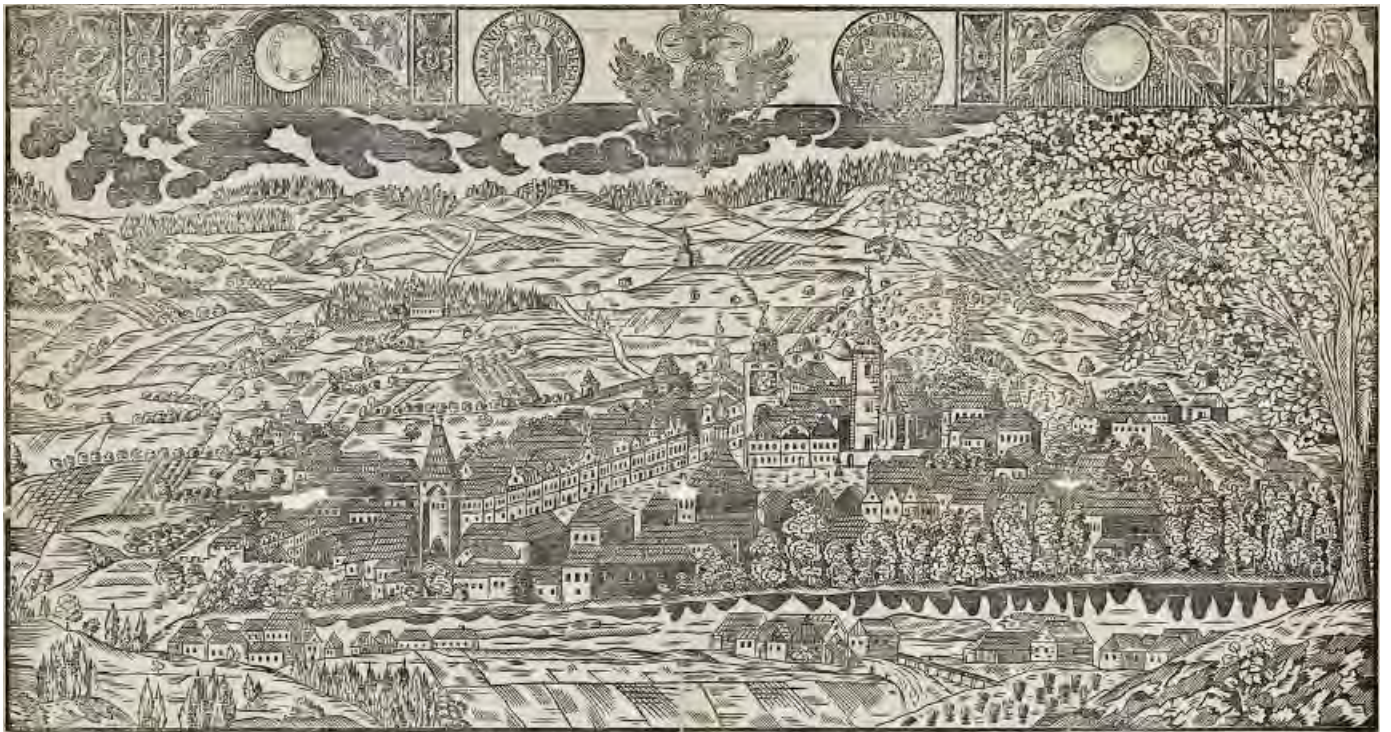
Beroun k.1820, pohled z nadhledu od SV (znaky měst Berouna a Prahy), cech.list, anonym, mědiryt, 54 × 28, SOKA Tábor, fond Cech řezníků Tábor B 20, i. č. 9