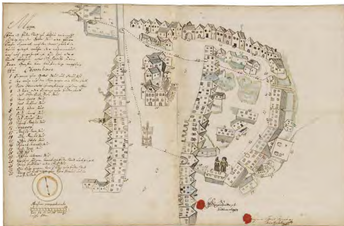
Bečov nad Teplou 1727, kavalírský plán separace žid. osídlení od SSV, od vstupu do zámku, Jan Kryštof Meyer, kolor. perokresba, leg. 23 zn., NA Praha, fond SMP, i. č. 1133, s. F/XI/30