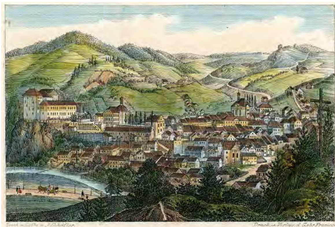
Bečov nad Teplou pol. 19. st., pohled z nadhledu od Z, z tzv. Vyhličky, J. Schäfler, kr. a rytec, bar. litografie, 13 × 8,5, Muzeum Karlovy Vary, i. č. Ug 1088