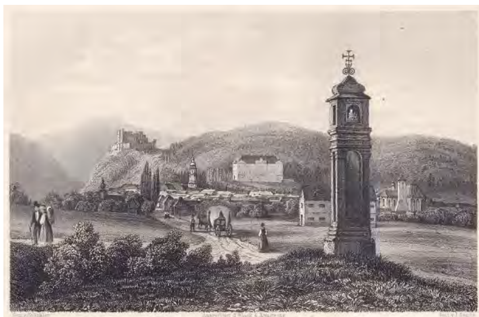
Boskovice 1839, pohled od SSV, Emanuel Stöckler kr., rytec James Sands, oceloryt, 15 × 9,5, knižní ilustrace, volné dílo, archiv autora