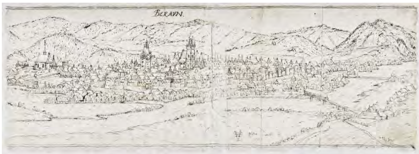
Beroun 1602, pohled z nadhledu od SV (BERAVN), J. Willenberg, perokresba, 52,5 × 18, knihovna KKPS Praha, s. DT 130