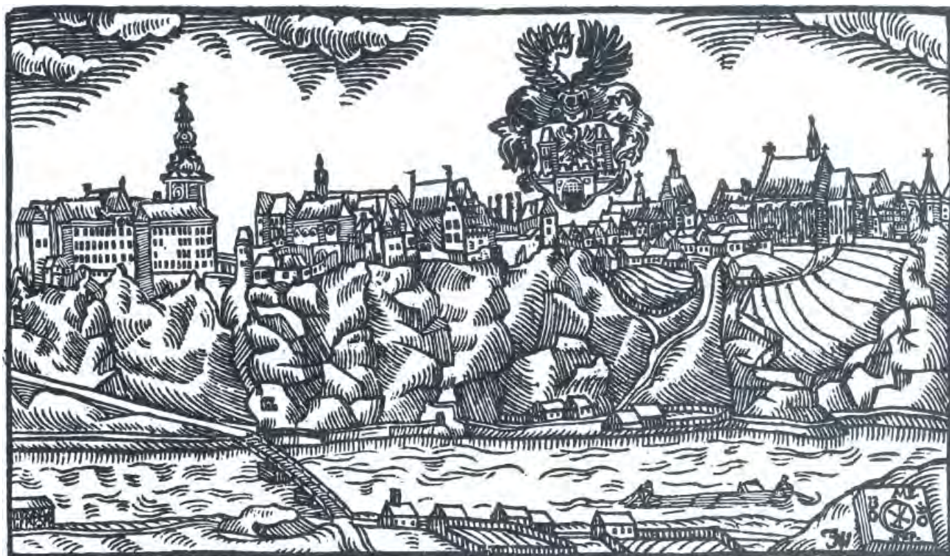
Bechyně 1602, pohled od V přes řeku Lužnici (znak města), J. Willenberg, dřevorez, 14,5 × 8,5, kniha Diadochos, volné dílo