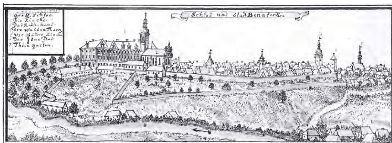
Benátky nad Jizerou po 1752, pohled od JJV přes Jizeru, F. B. Werner, lavír. perokresba, leg. 7 zn., soubor TopČM, f. 23, NPÚ Praha, s. N026135A