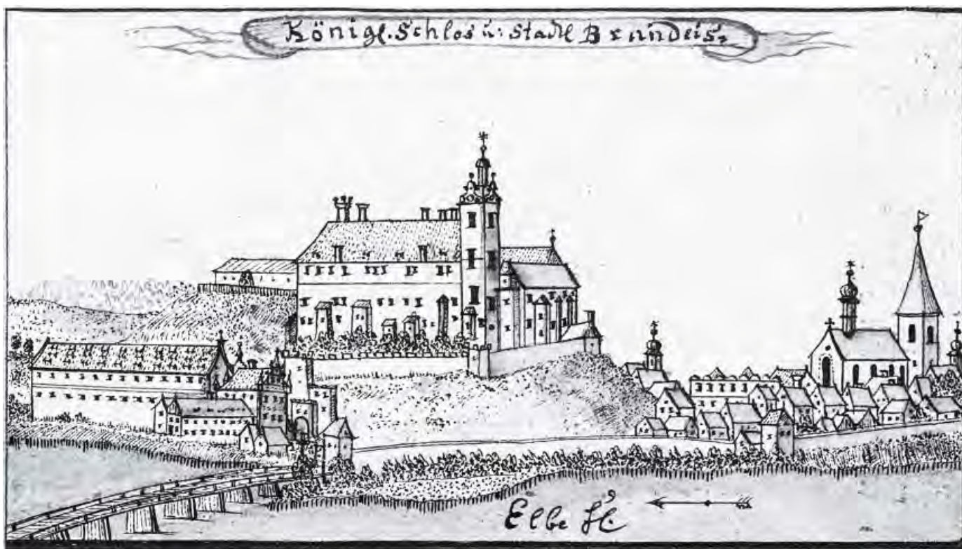
Brandýs nad Labem po 1752, pohled od SSV, F.B.Werner, lavír. perokresba, soubor TopCM, f.40, NPU Praha, s.N026153B