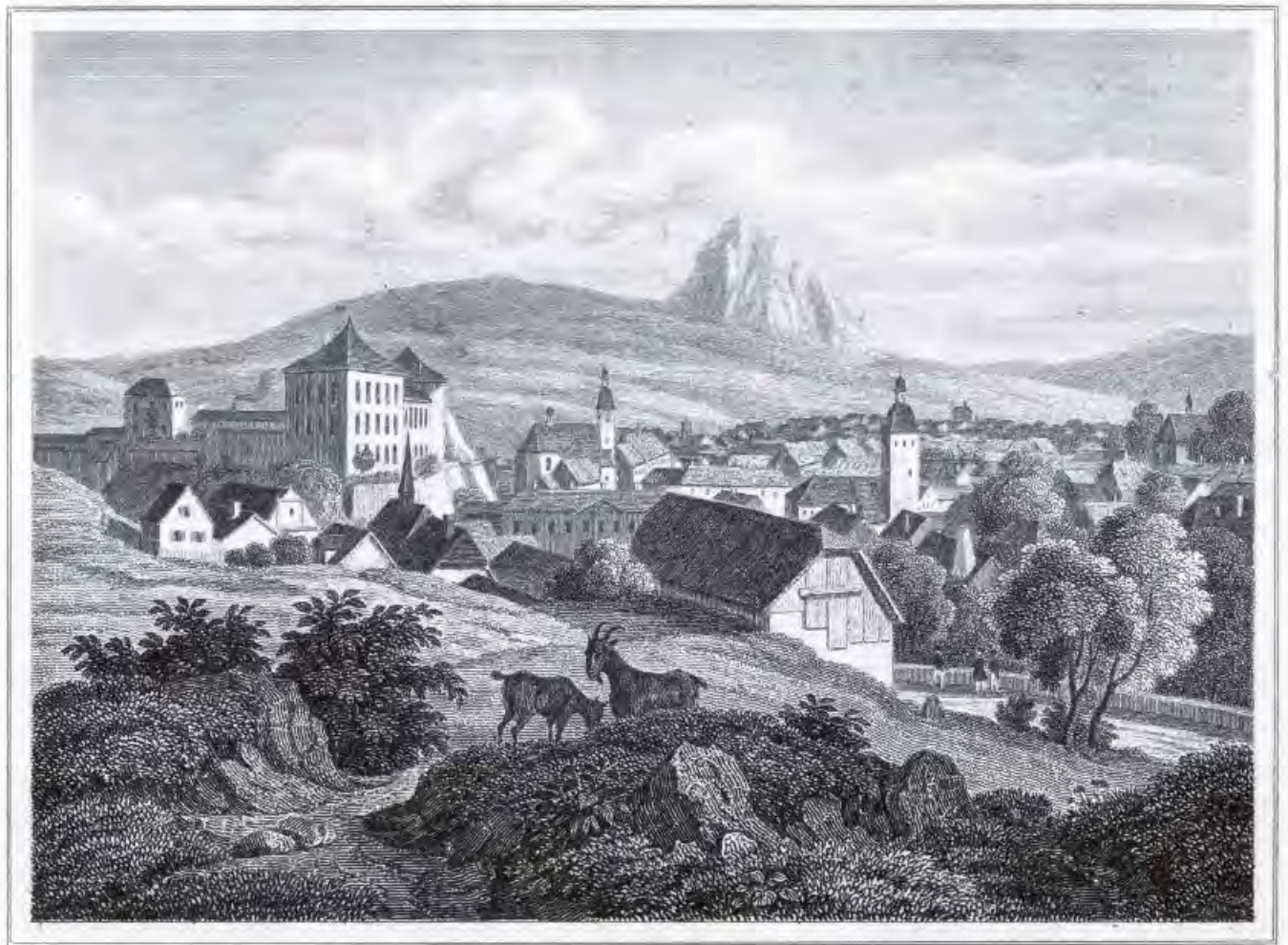
Bílina 1843, pohled od SZ, Wenzel Pobuda, mědiryt, 10 × 7,5, knižní ilustrace, volné dílo, archiv autora