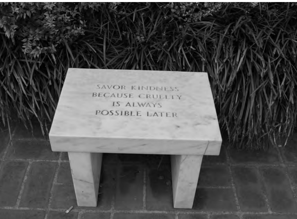
Užívejte si laskavosti, protože na krutost je vždy dost času; lavička v Muzeu Peggy Guggenheimové v Benátkách.

Informační blackout: Nedostatek informací živí obavy a ty mohou vést až k panice a bezhlavému chování, které je vždycky nebezpečné (rvačky o jídlo, zbytečné, násilné konflikty, které např. v USA často končí tak, že někdo začne střílet). Na úrovni místní samosprávy se jedná o krizovou komunikaci, na osobní úrovni buď o chladno-